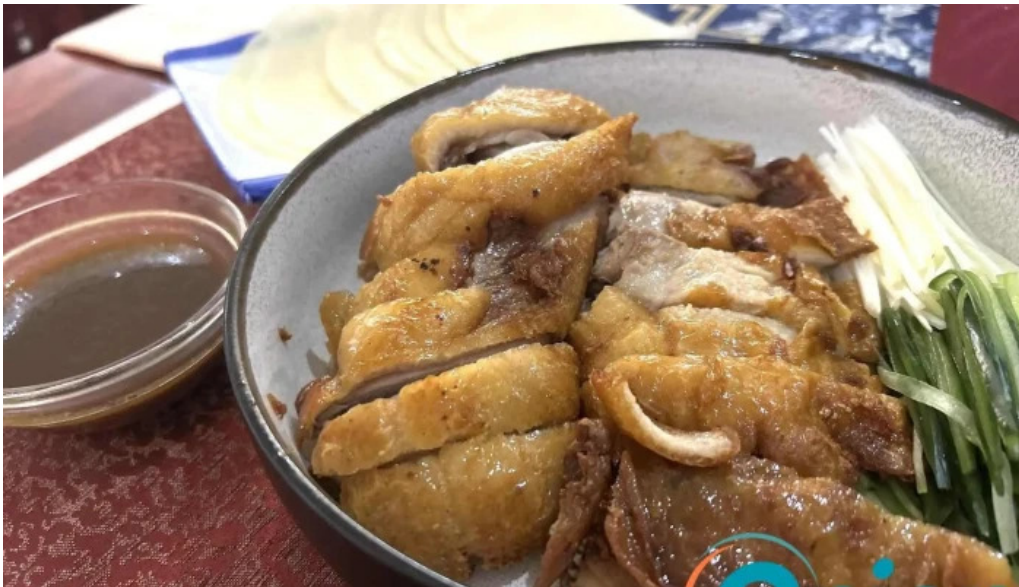
Bento ramen essen und trinken