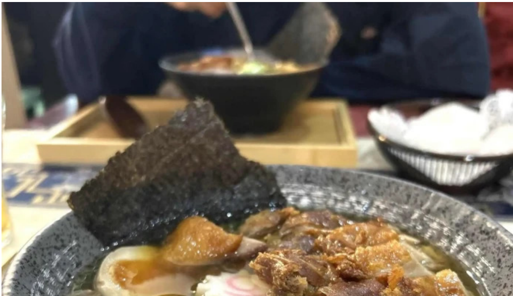
Bento ramen adress