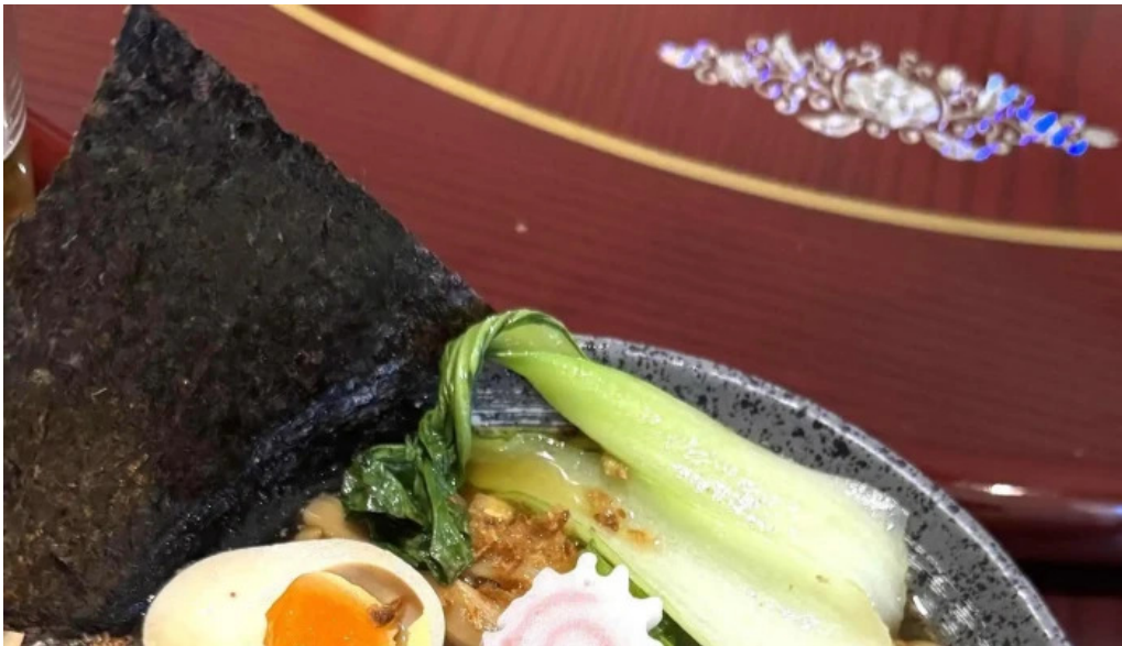
Bento ramen petange