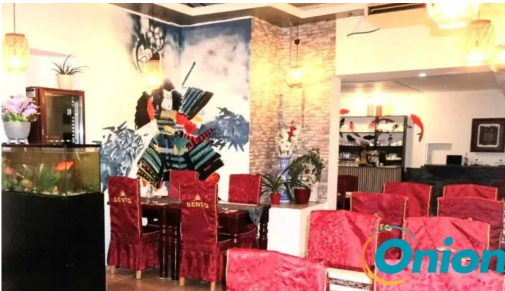
Bento ramen neueste