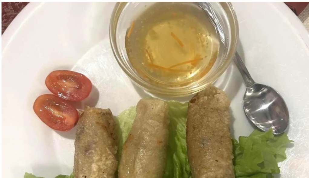
Bento ramen promotioun