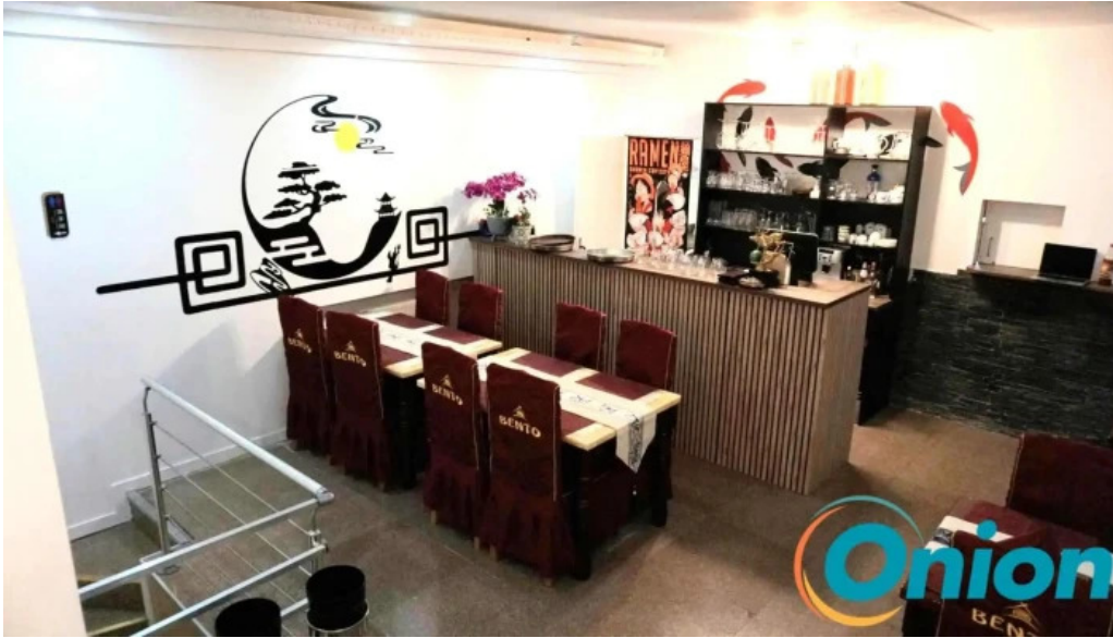
Bento ramen fotoene