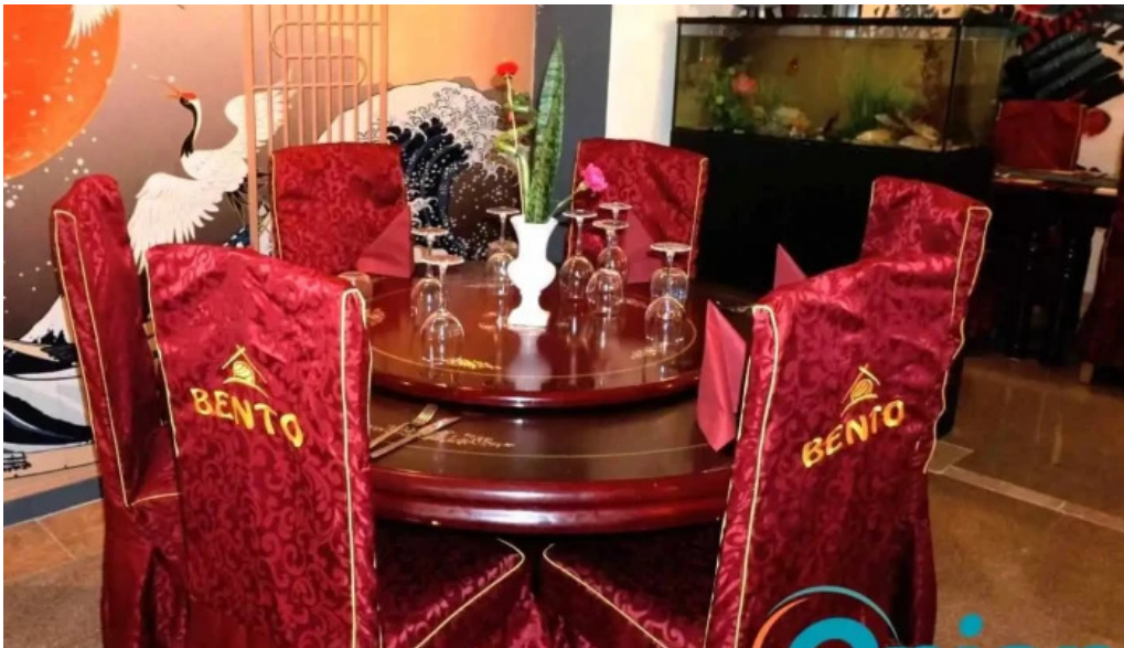
Bento ramen atmosphere