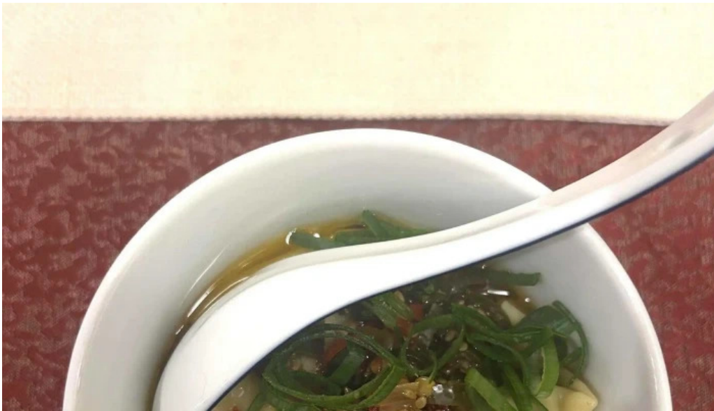
Bento ramen fotoen