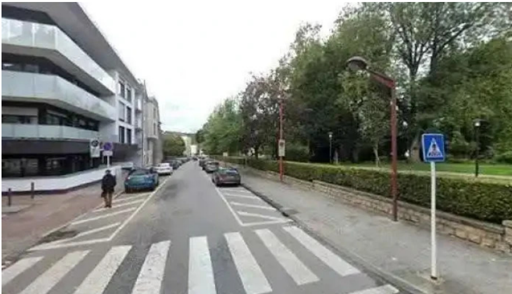
Bento ramen street view 360deg fotos