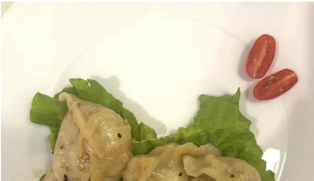
Bento ramen wei do ukommen