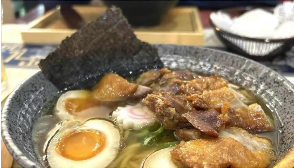
Bento ramen suppe