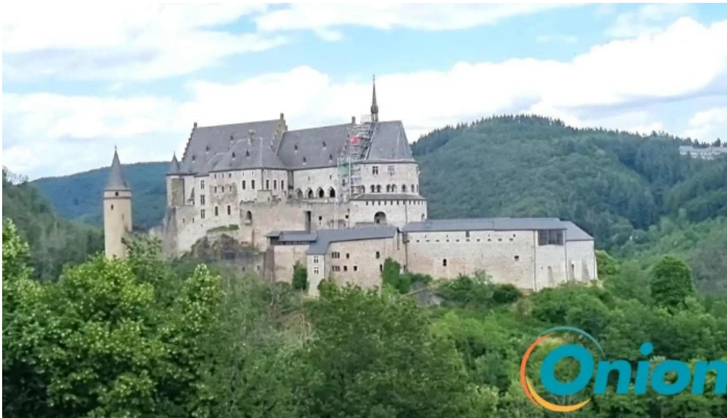
Vianden route de diekirch videos