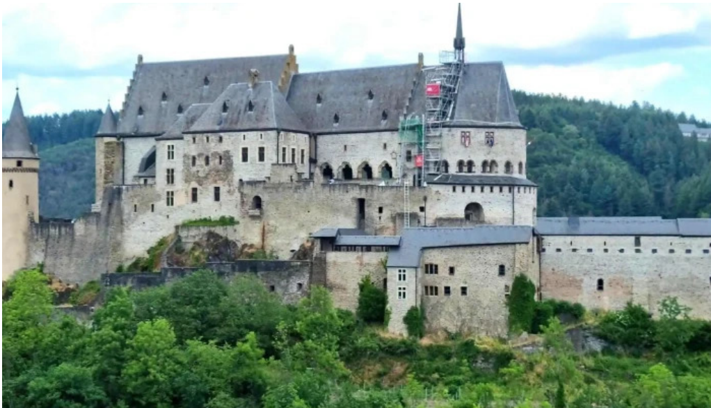
Vianden route de diekirch telefon