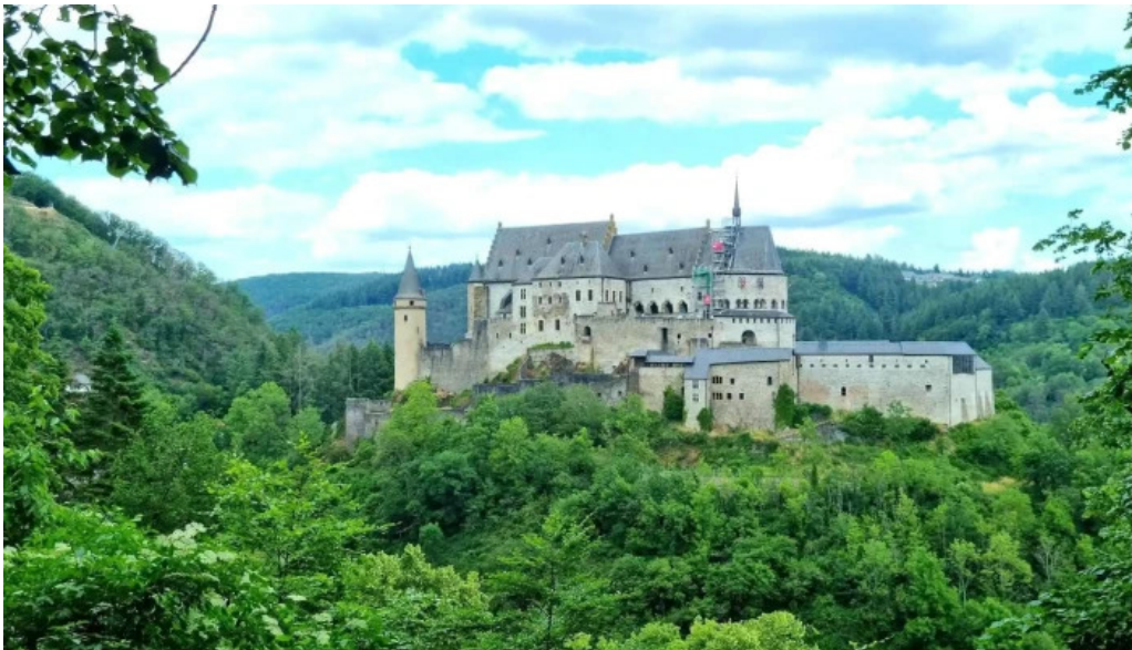
Vianden route de diekirch promotioun