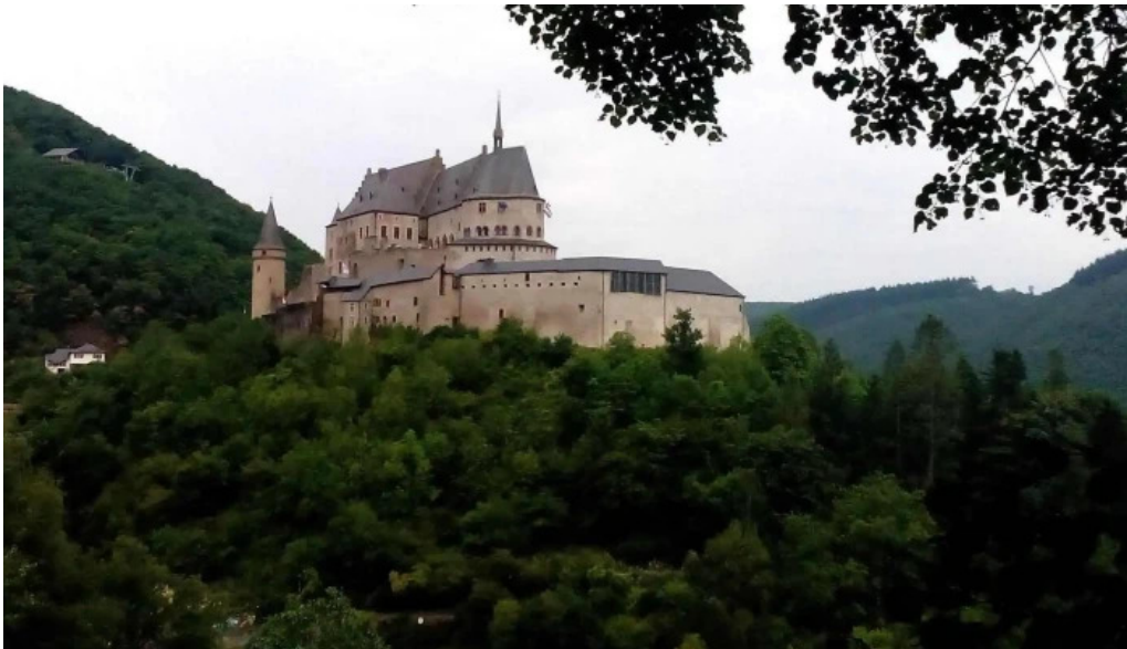
Vianden route de diekirch wei do ukommen