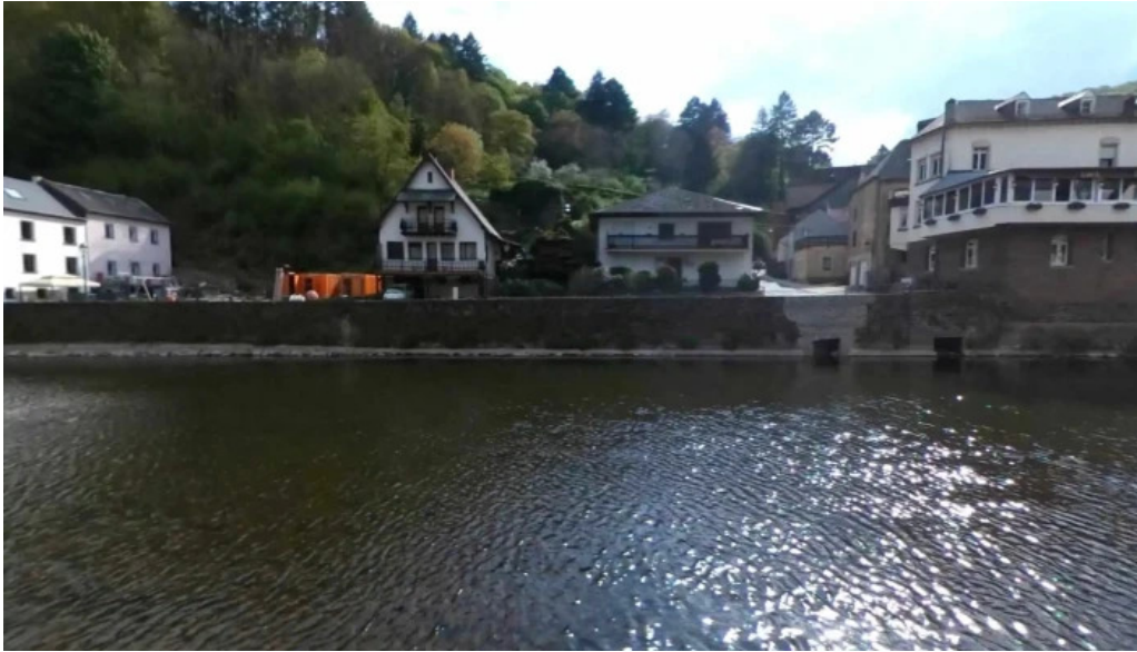
Vianden route de diekirch street view 360deg fotos