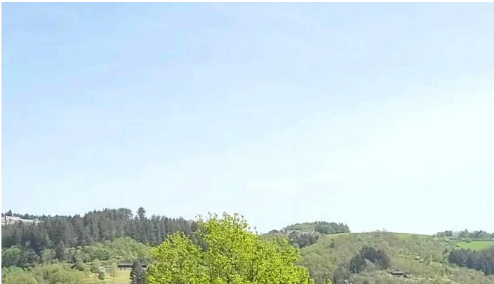
Vianden route de diekirch websait