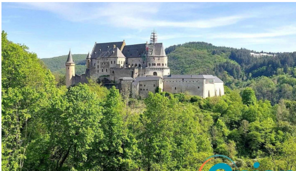
Vianden route de diekirch vianden