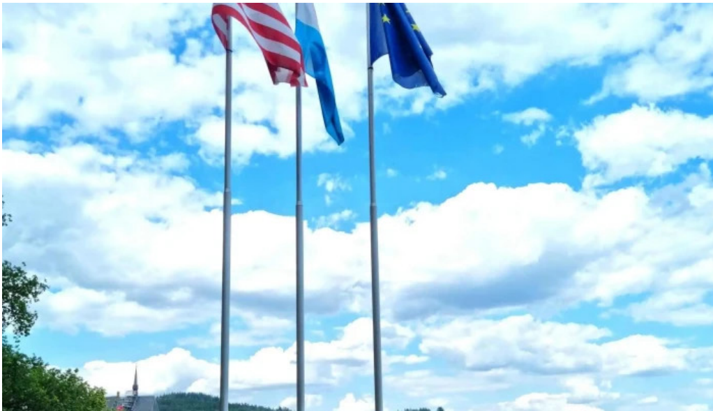
Vianden route de diekirch adress