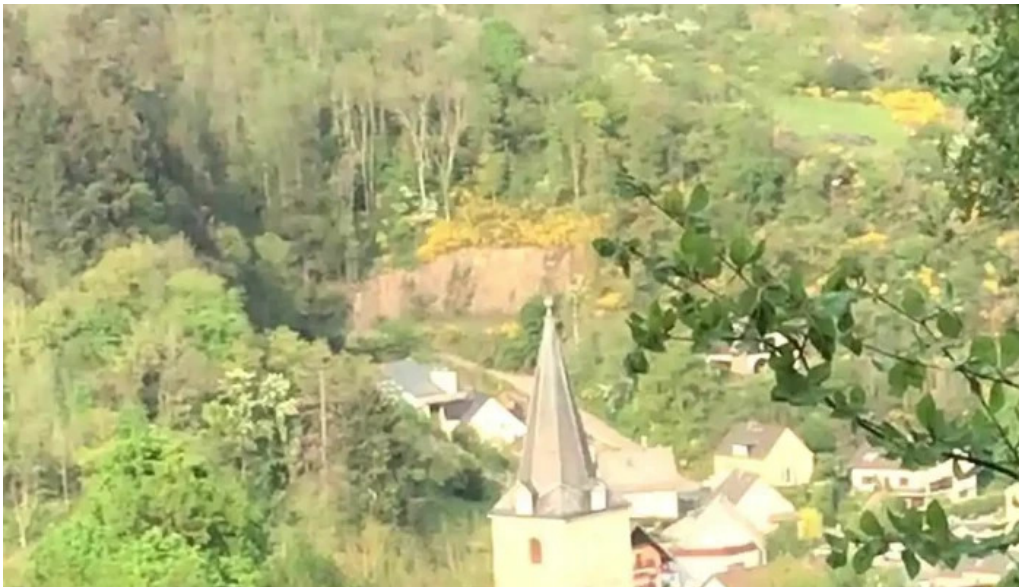
Vianden route de diekirch wald