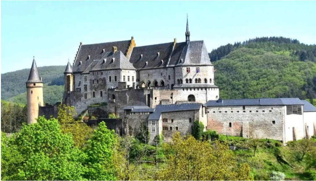
Vianden route de diekirch elo op