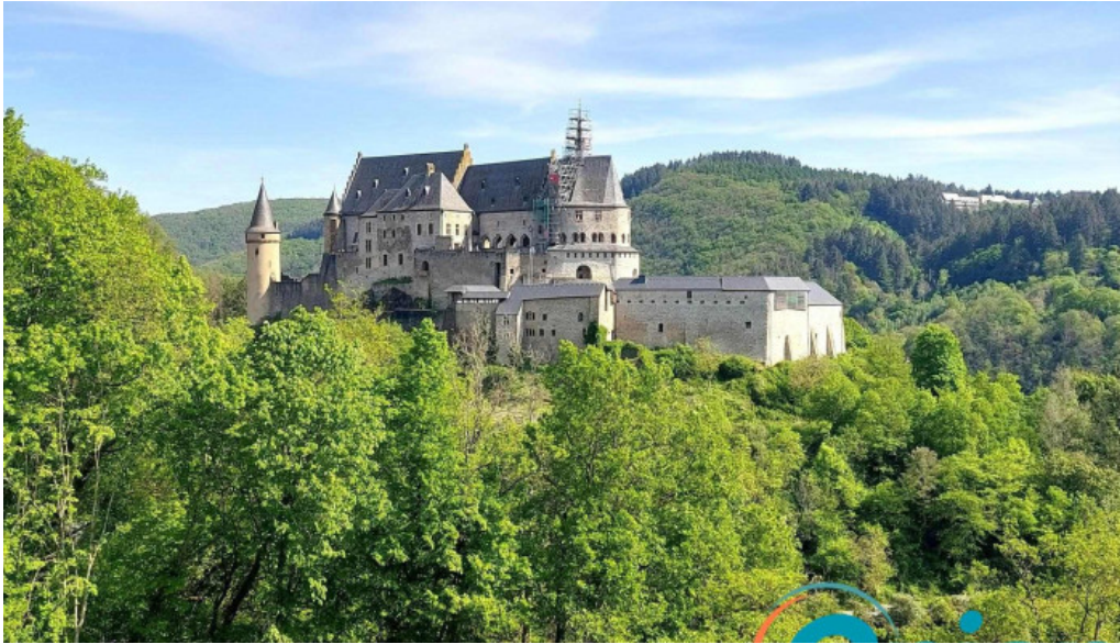
Vianden route de diekirch wei do ukommene