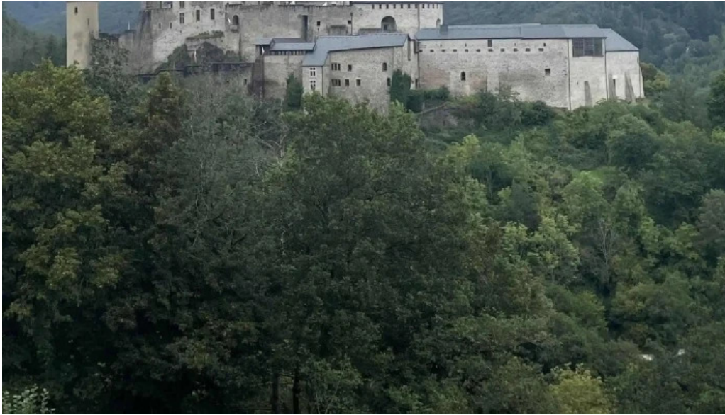
Vianden route de diekirch vianden