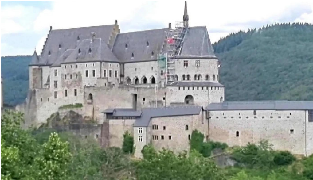
Vianden route de diekirch videoen