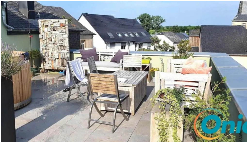
Green breakfast von gasten