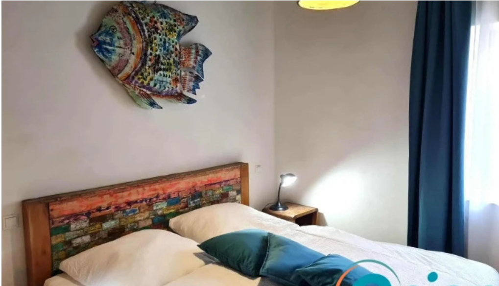
Green breakfast zimmer