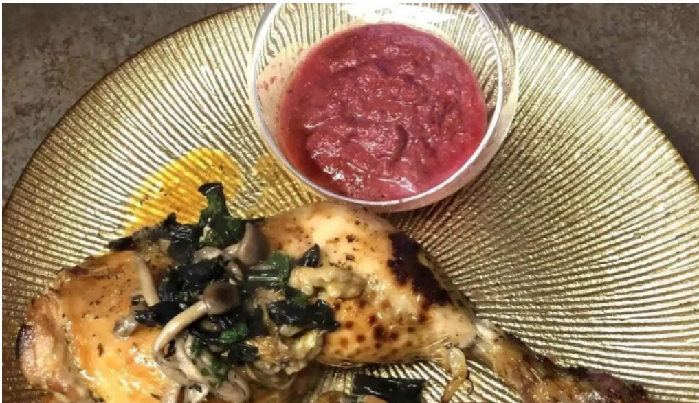
Green breakfast essen und trinken