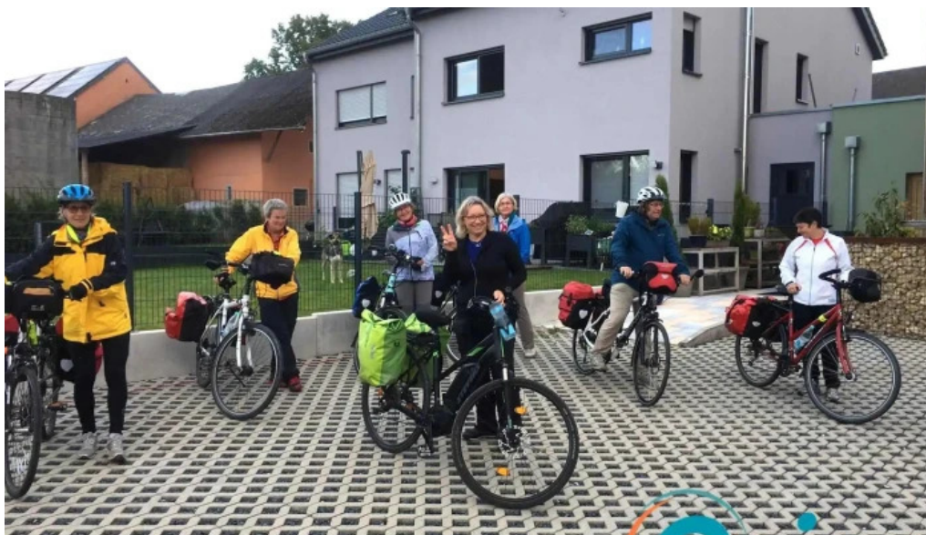
Green breakfast aussenbereich