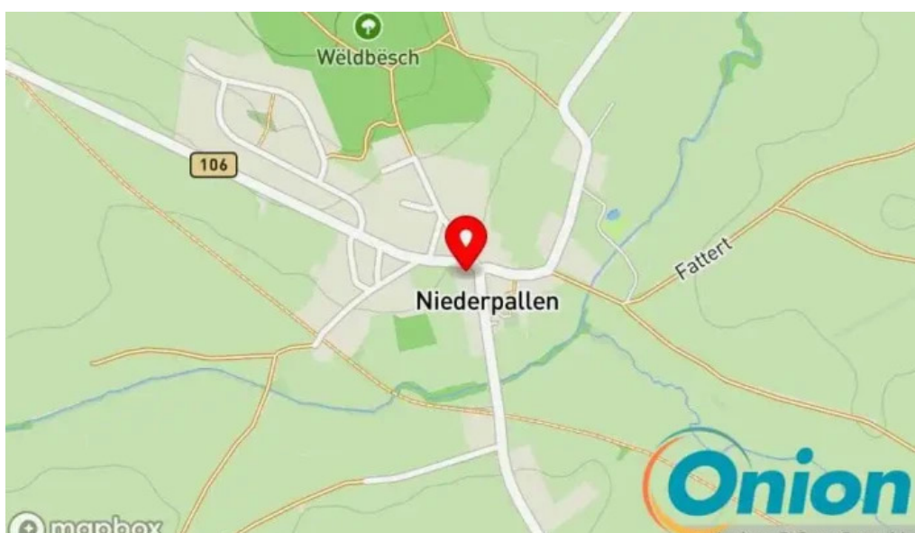
Green breakfast Kaart