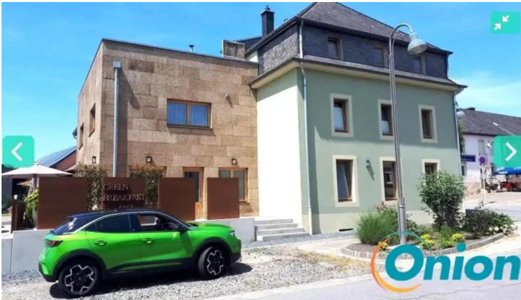
Green breakfast redingen