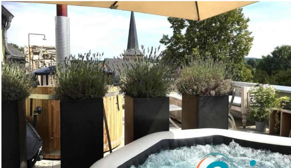
Green breakfast ausstattung