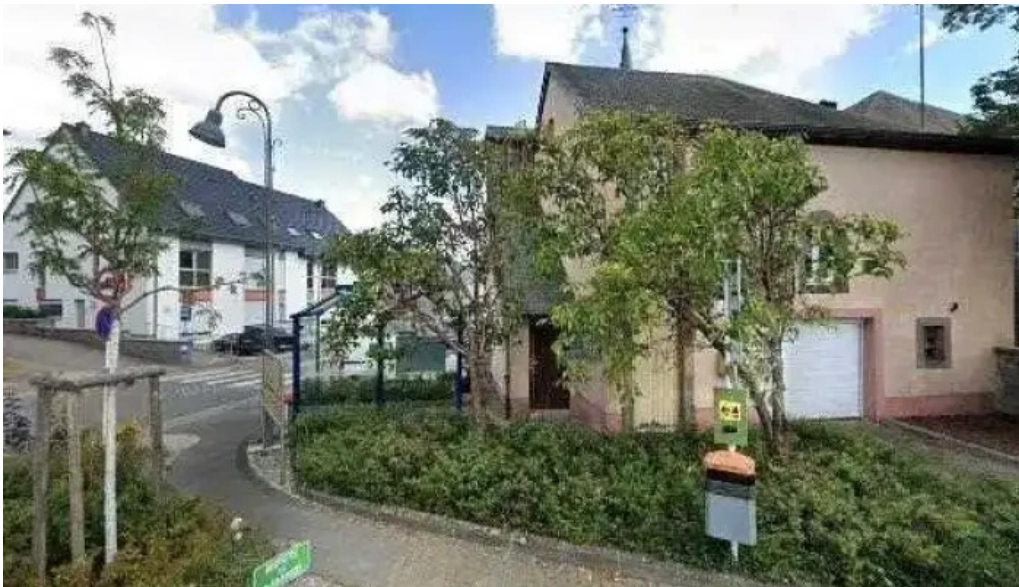
Green breakfast street view 360deg fotos