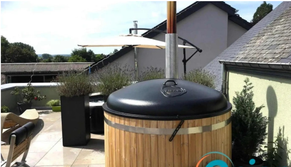
Green breakfast vom inhaber