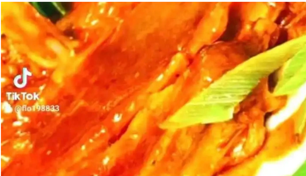
Seller stuff sarl dfrittebuud beim flo vom inhaber