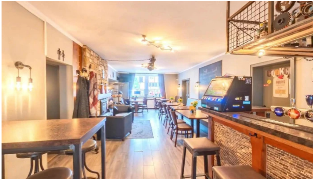
Seller stuff sarl dfrittebuud beim flo street view 360deg fotos