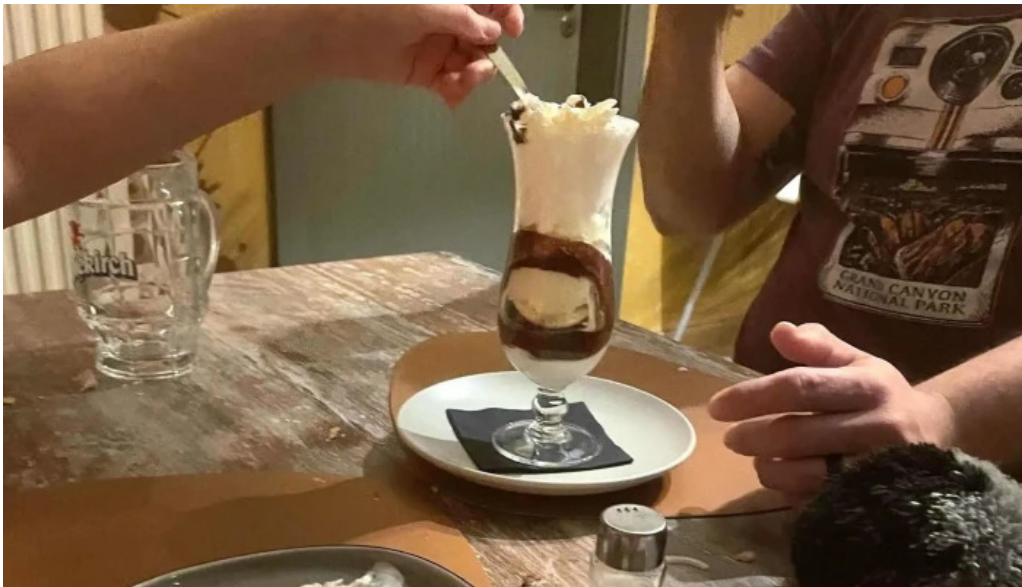
Seller stuf sarl dfrittebuud beim flo bewaertungen