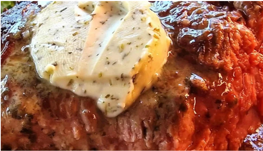
Seller stuff sarl dfrittebuud beim flo stonnenplang