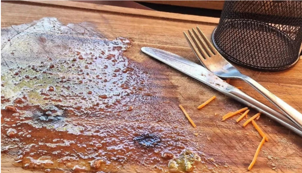
Seller stuff sarl drittebuud beim flo praiser