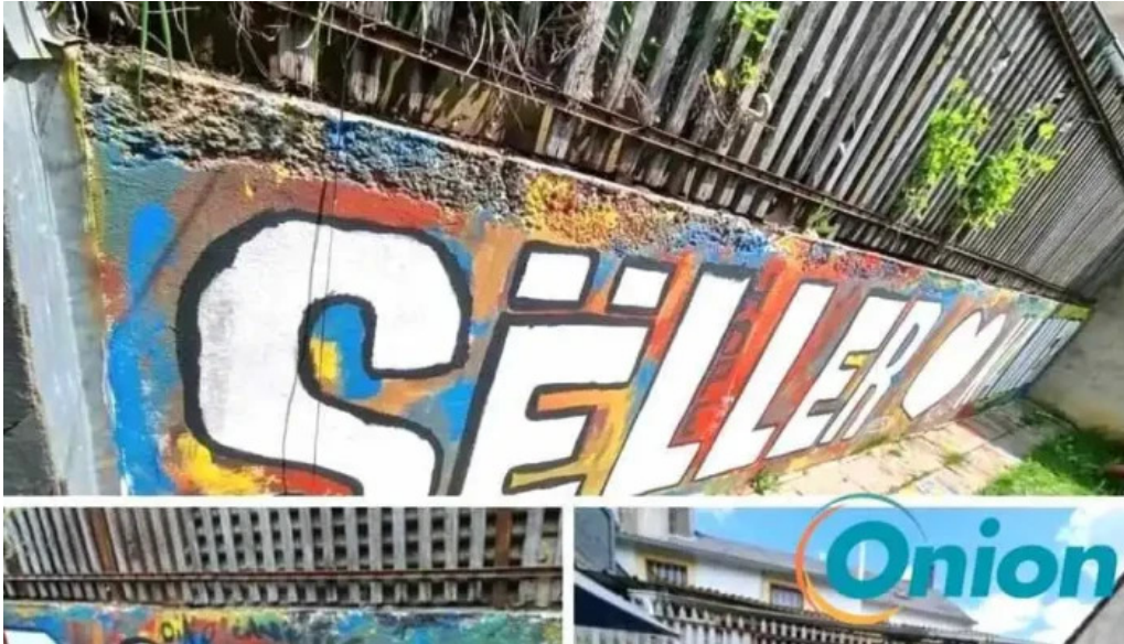
Seller stuff sarl dfrittebuud beim flo wei do ukommene