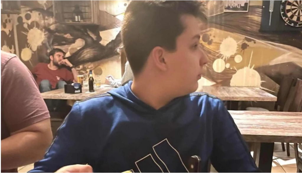
Seller stuf sarl dfrittebuud beim flo geigend