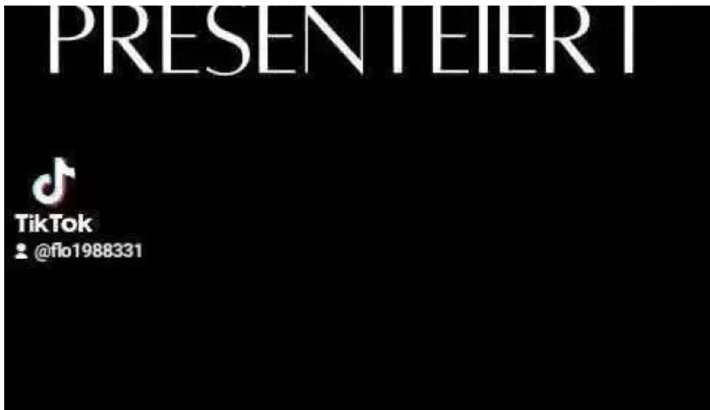
Seller stuff sarl dfrittebuud beim flo videos