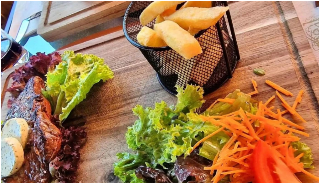
Seller stuff sarl d'frittebuud beim flo adress