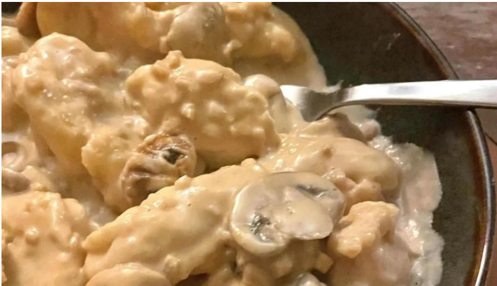
Seller stuff sarl dfrittebuud beim flo saeul