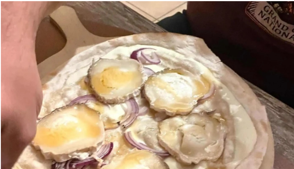
Seller stuff sarl dfrittebuud beim flo wei do ukommen