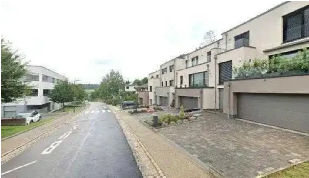
Lorentzweiler rue de blaschette elo ope