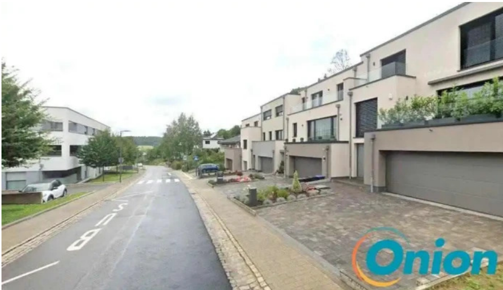
Lorentzweiler rue de blaschette lorentzweiler