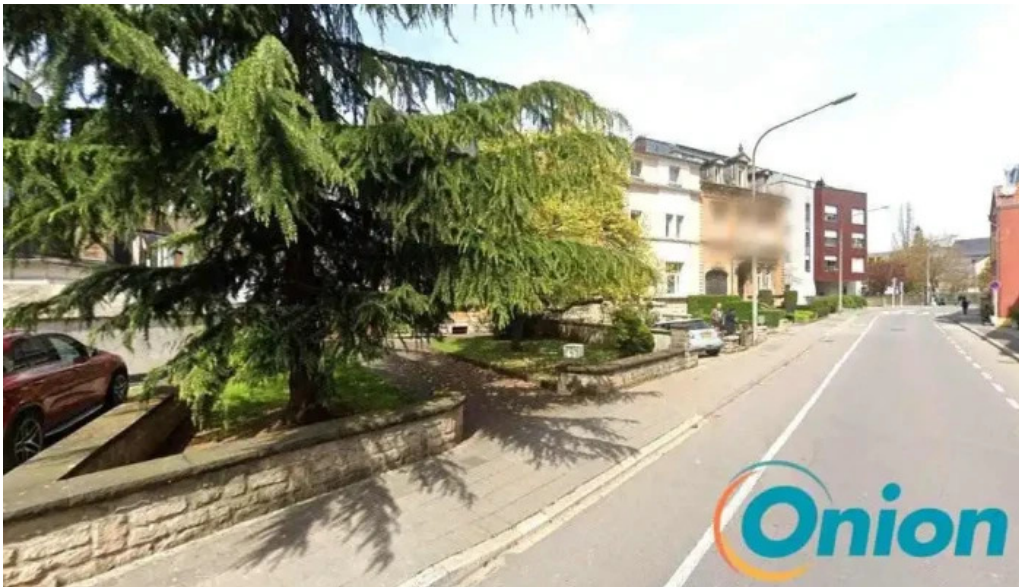
Welt buttek esch an der alzette