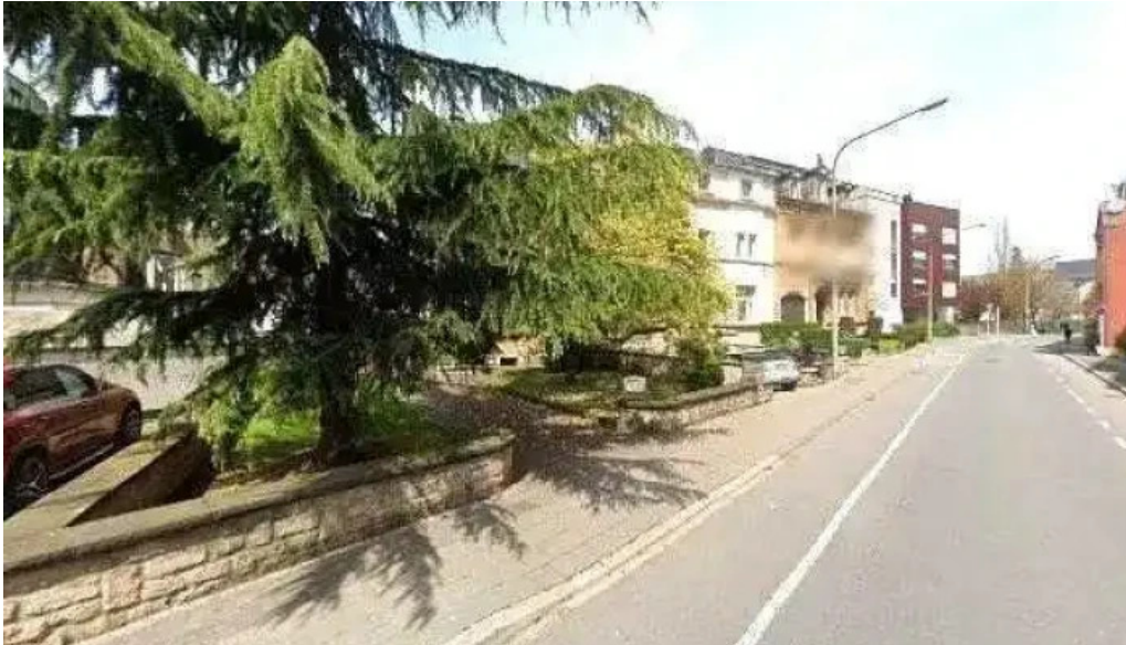
Welt buttek nummere