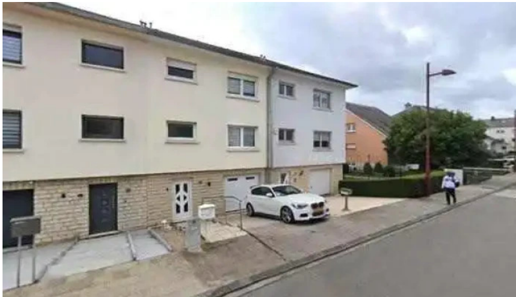
Dt buttek sarl kommentarene