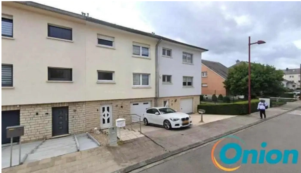
Dt buttek sarl petange