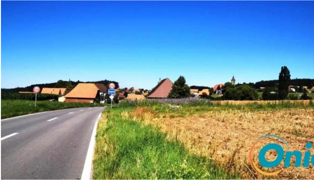
Limpach reckingen mess