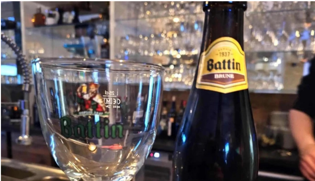
Cafe de la culture fotoen