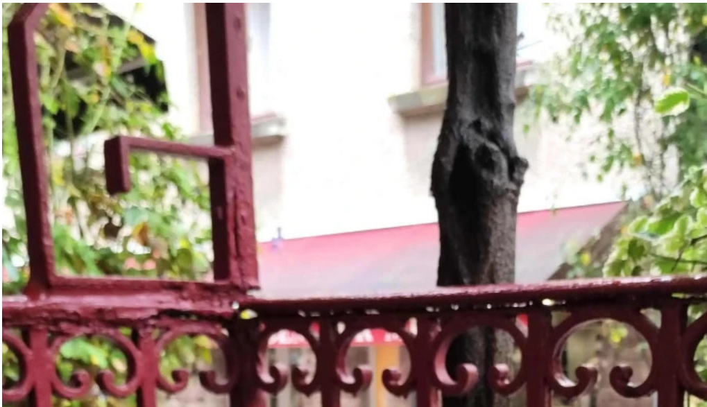
Cafe de la culture instagram