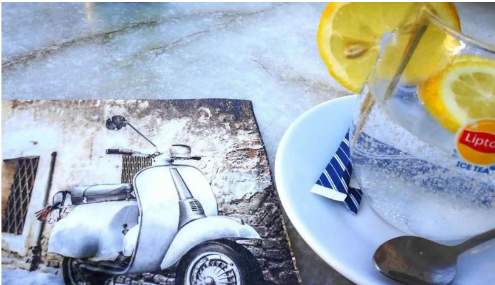
Cafe de la culture nummer