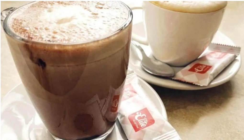
Cafe de la culture fotoene