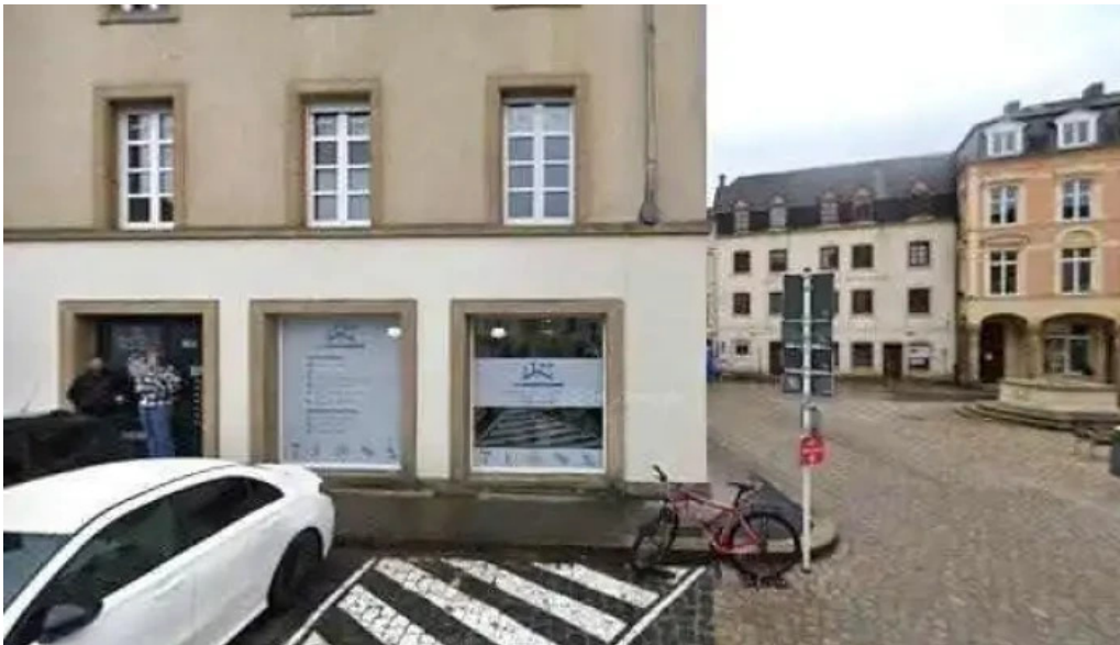
Cafe de la culture street view 360deg fotos