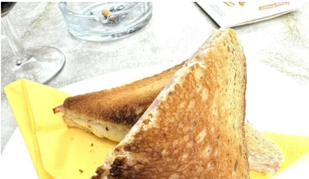
Cafe de la culture remisen