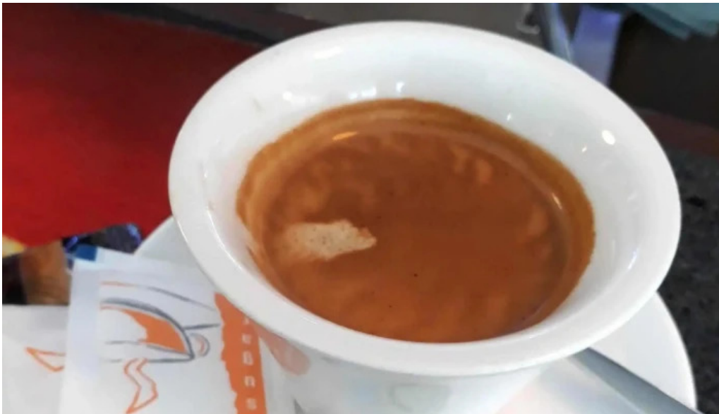
Cafe de la culture echternach