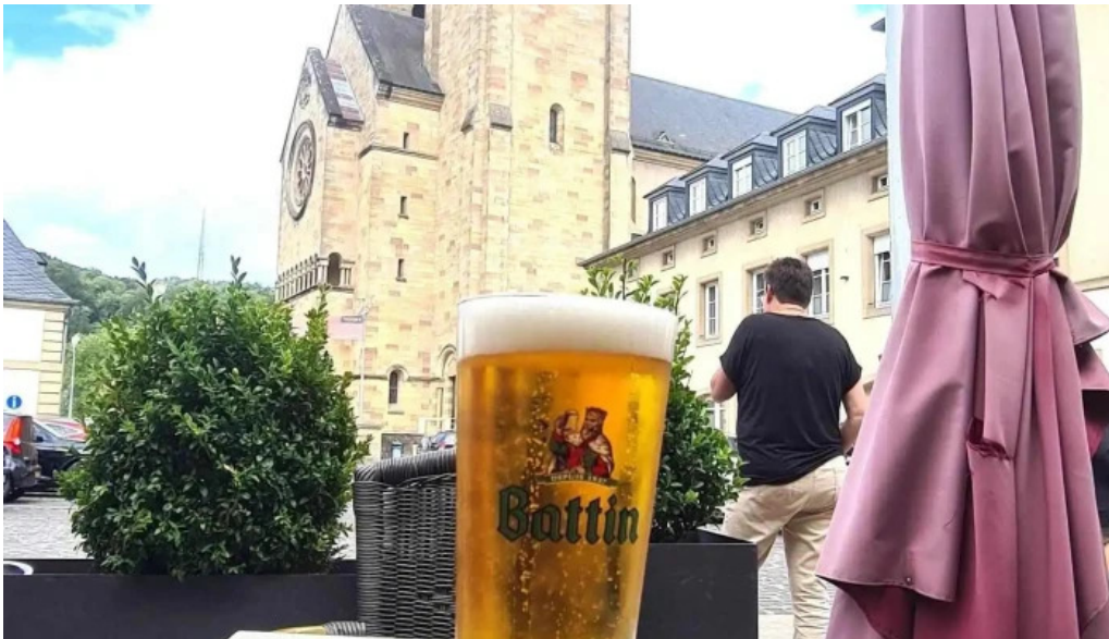
Cafe de la culture essen und trinken