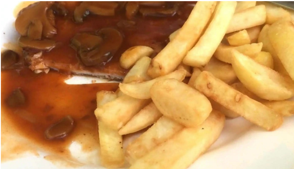
Cafe de la culture adress