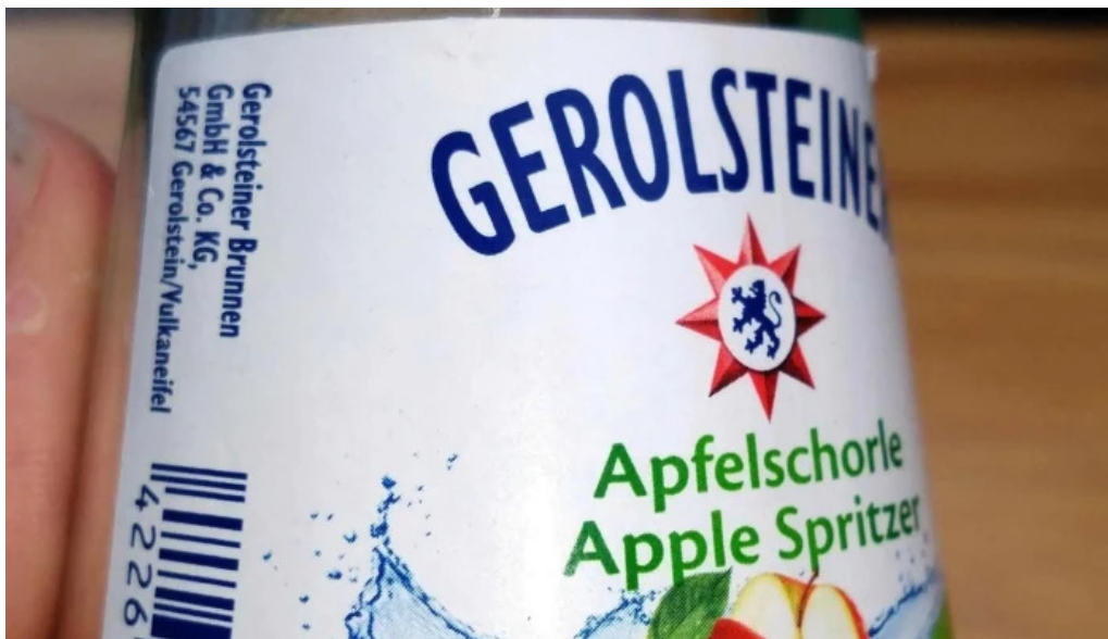
Cafe de la culture websait