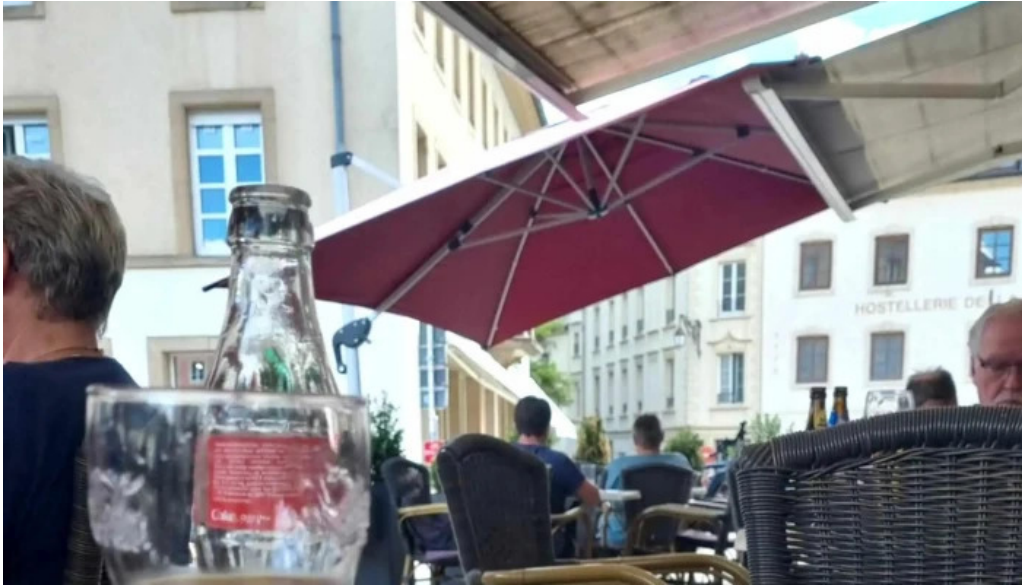
Cafe de la culture bewaertung