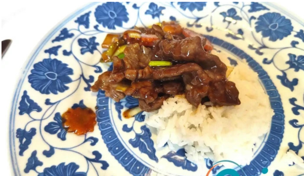
Villa de jade neueste