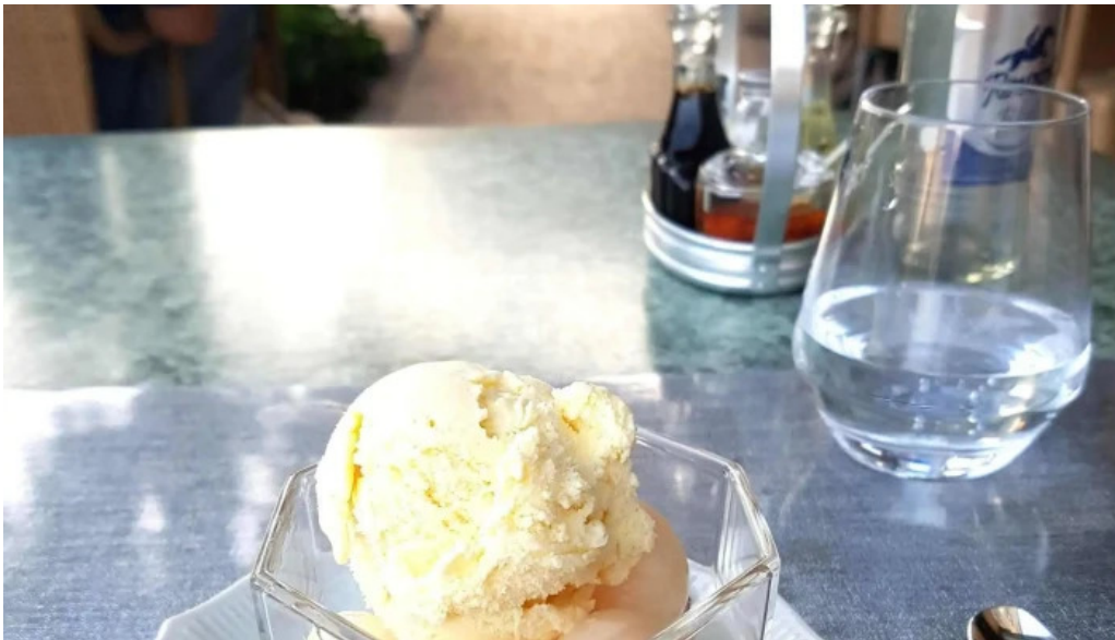
Villa de jade katalog