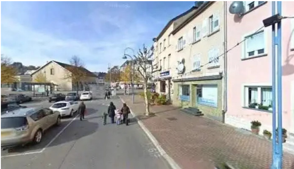
Villa de jade street view 360deg fotos