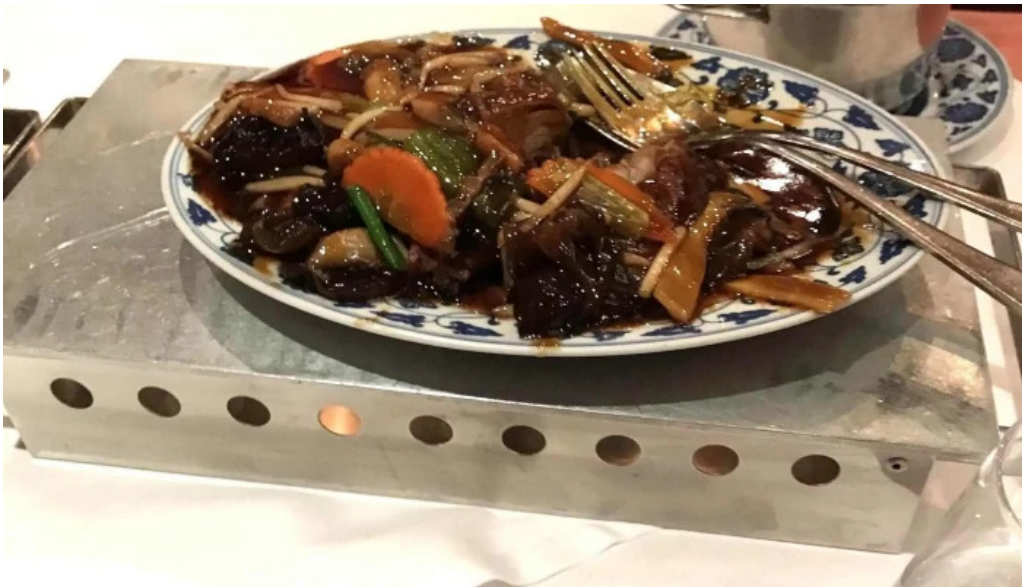
Villa de jade geigend