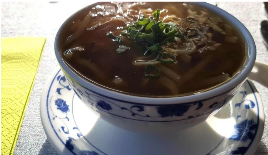
Villa de jade fotoen