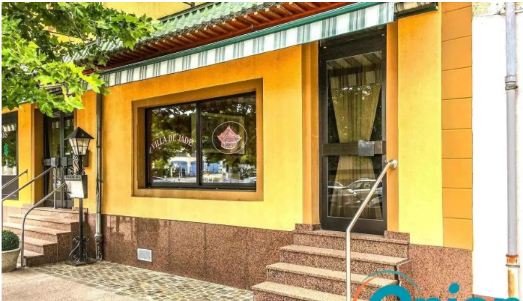
Villa de jade fotoene