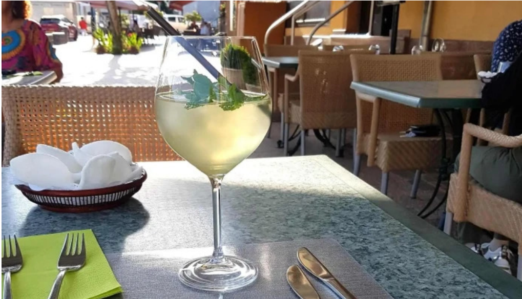
Villa de jade ettelbruck