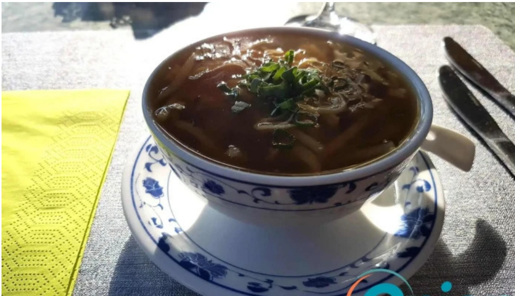
Villa de jade suppe