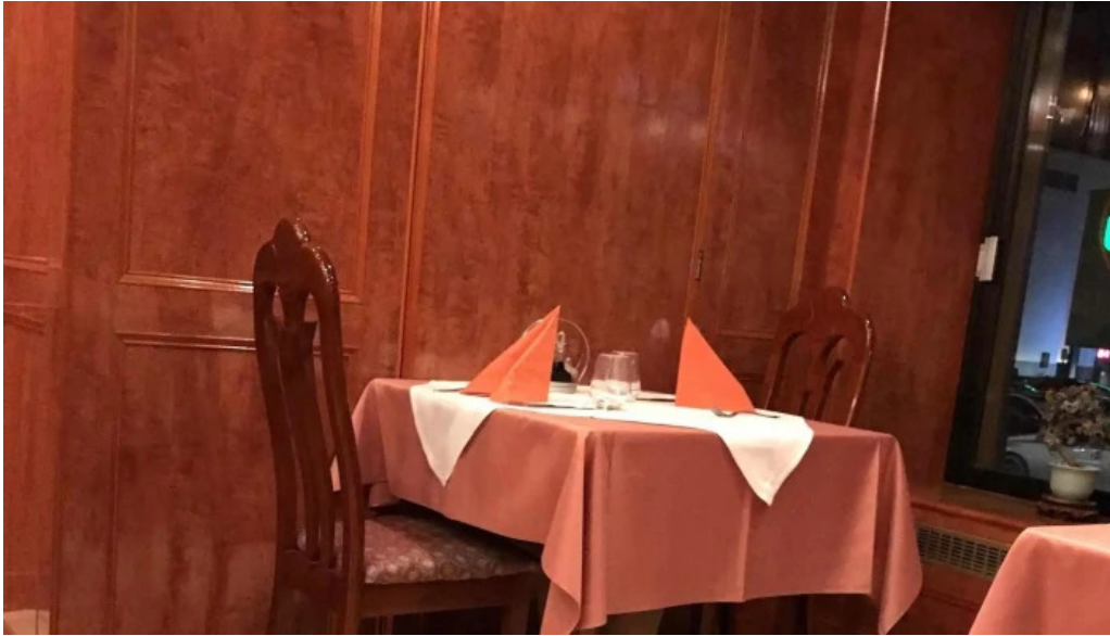
Villa de jade bewaertungen