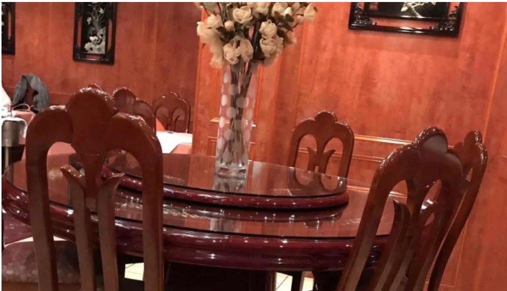
Villa de jade wei do ukommen