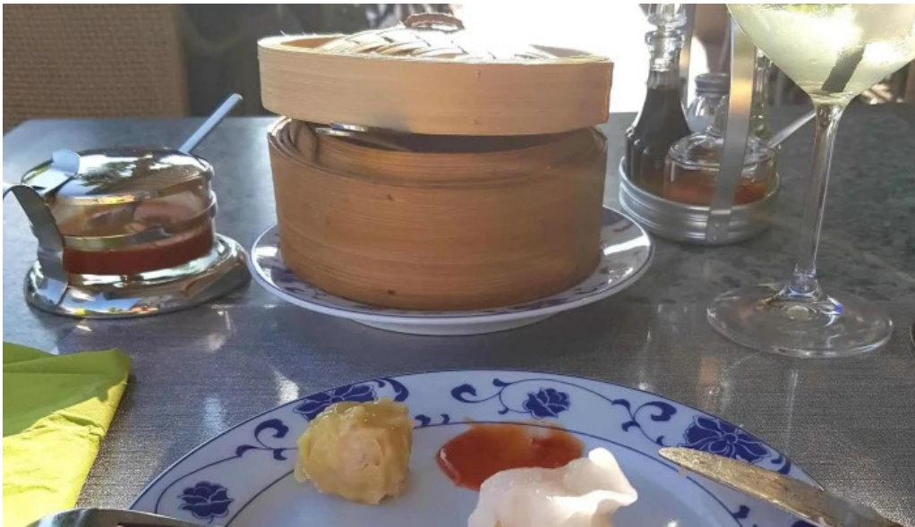
Villa de jade bewaertung