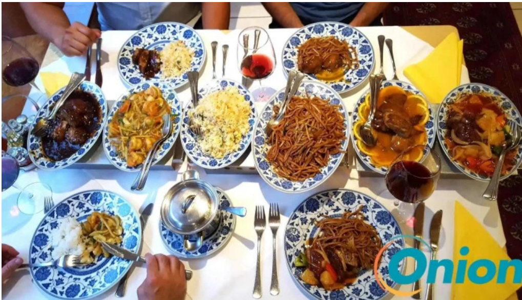
Villa de jade essen und trinken