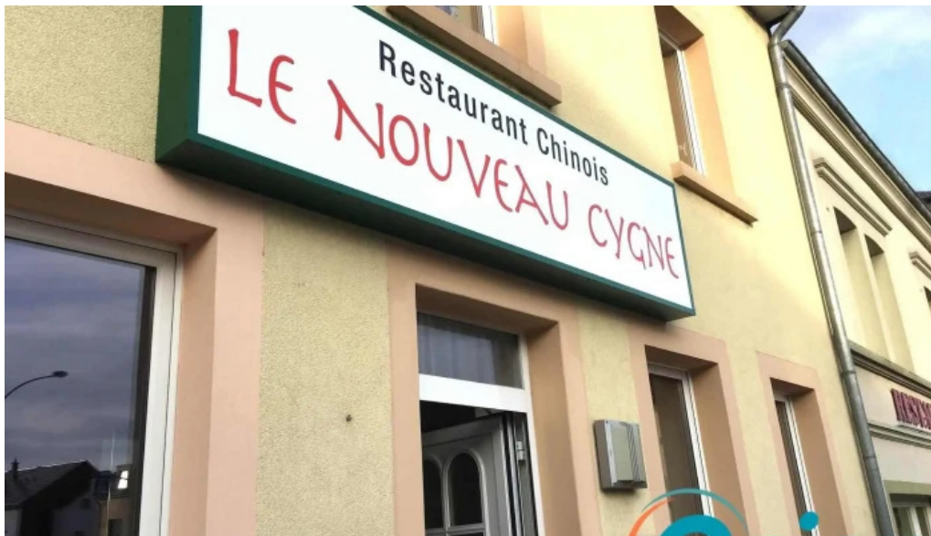
Restaurant donghe bewaertunge