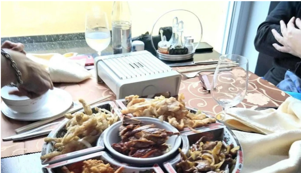
Restaurant donghe fotoen