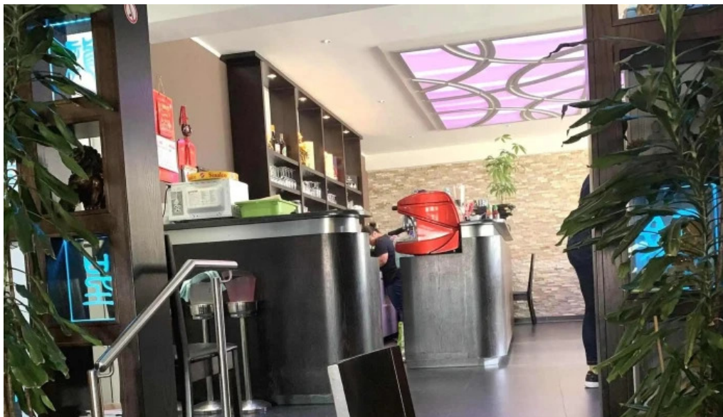
Restaurant donghe nummer