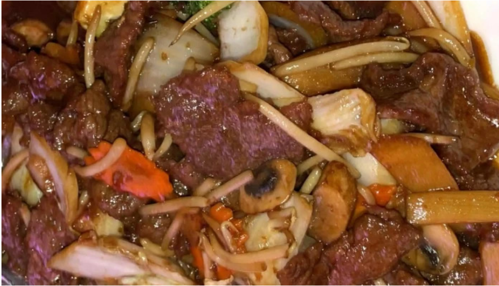
Restaurant donghe feulen