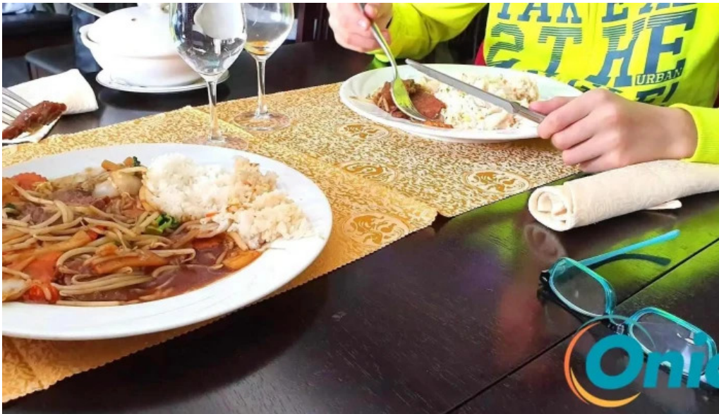
Restaurant donghe nudel