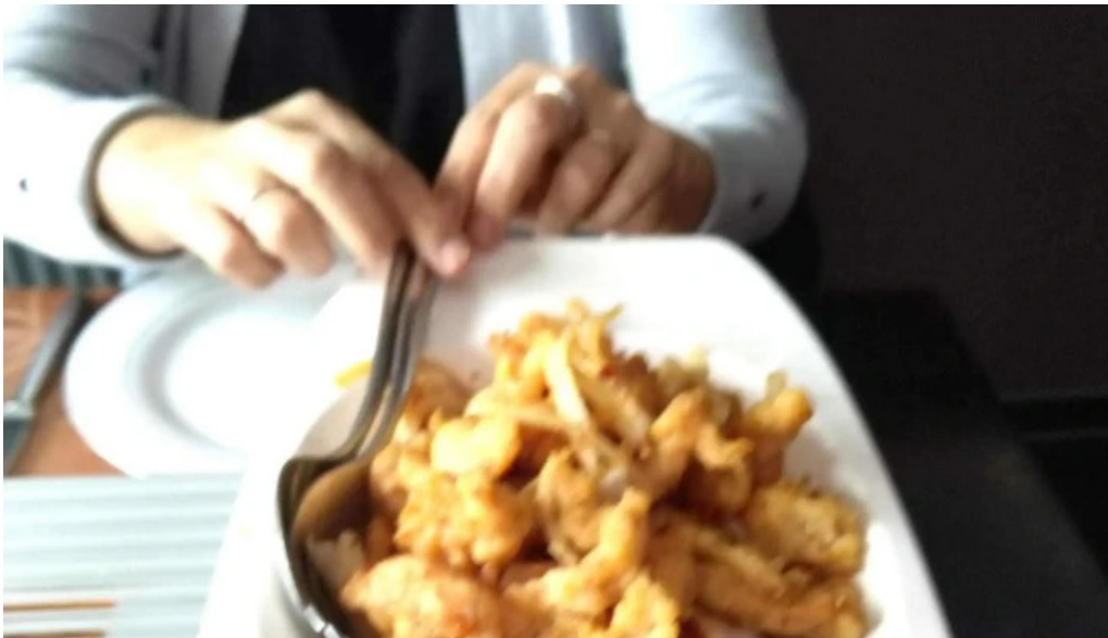
Restaurant donghe no bei mir