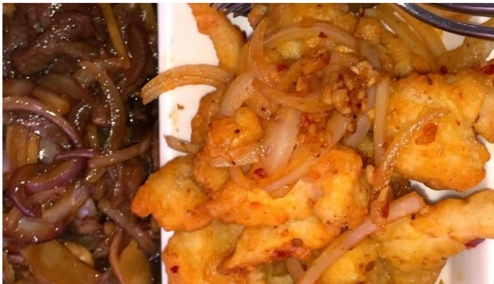
Restaurant donghe bewaertung