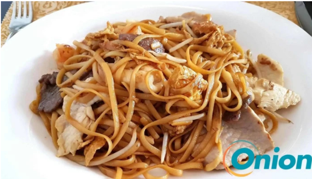
Restaurant donghe essen und trinken