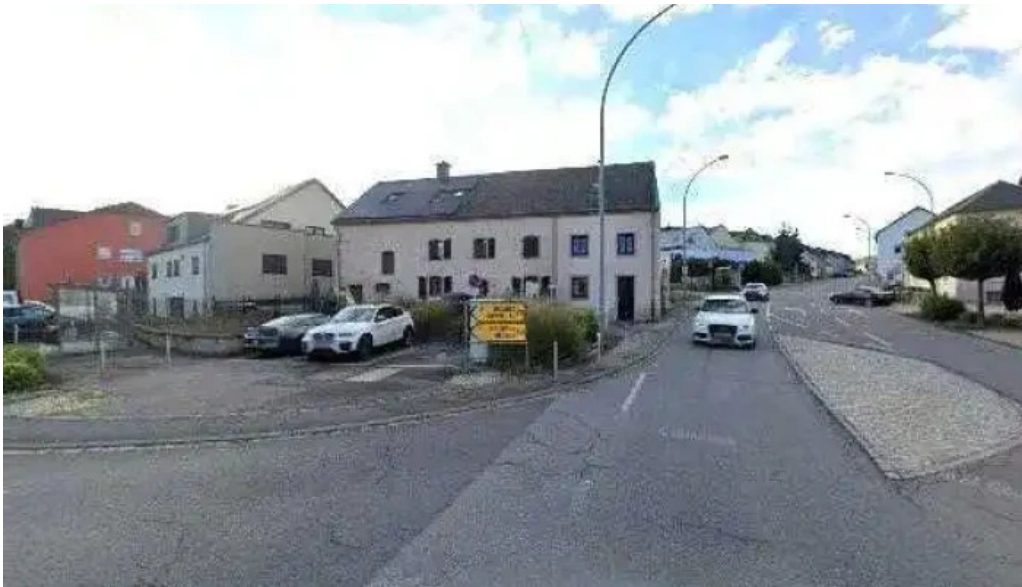
Restaurant donghe street view 360deg fotos