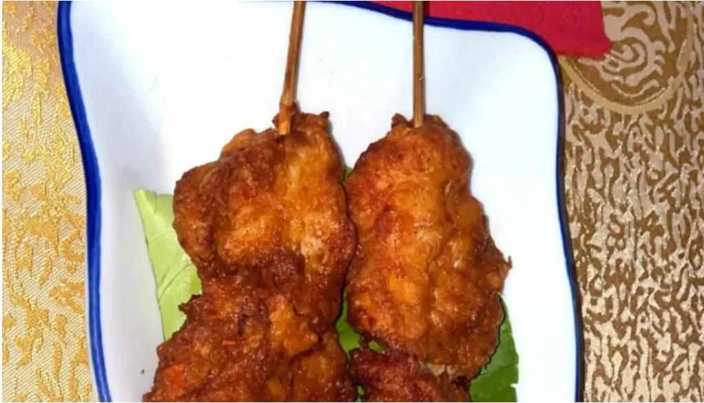
Restaurant donghe videoen