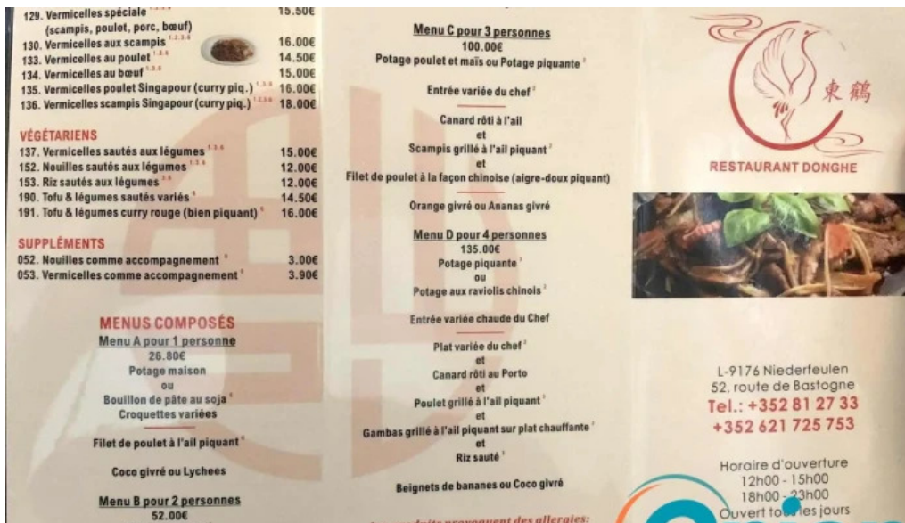
Restaurant donghe speisekarte