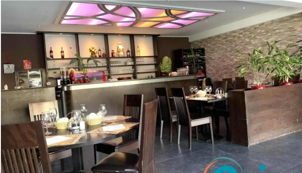
Restaurant donghe atmosphere