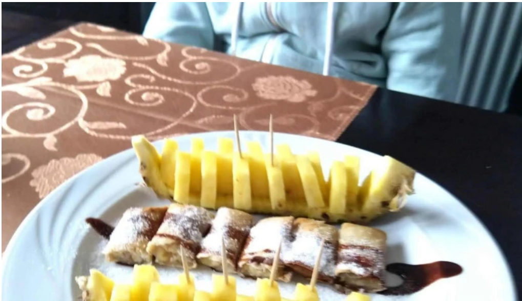
Restaurant donghe kommentaren