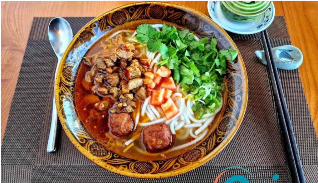
Sanhe essen und trinken