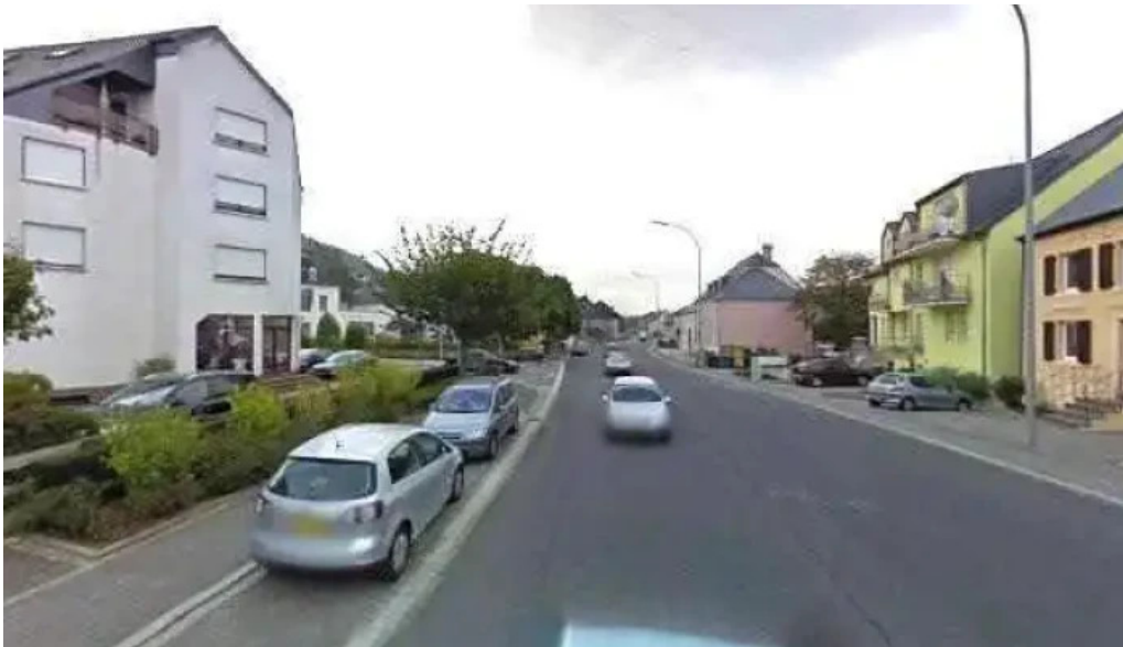
Sanhe street view 360deg fotos