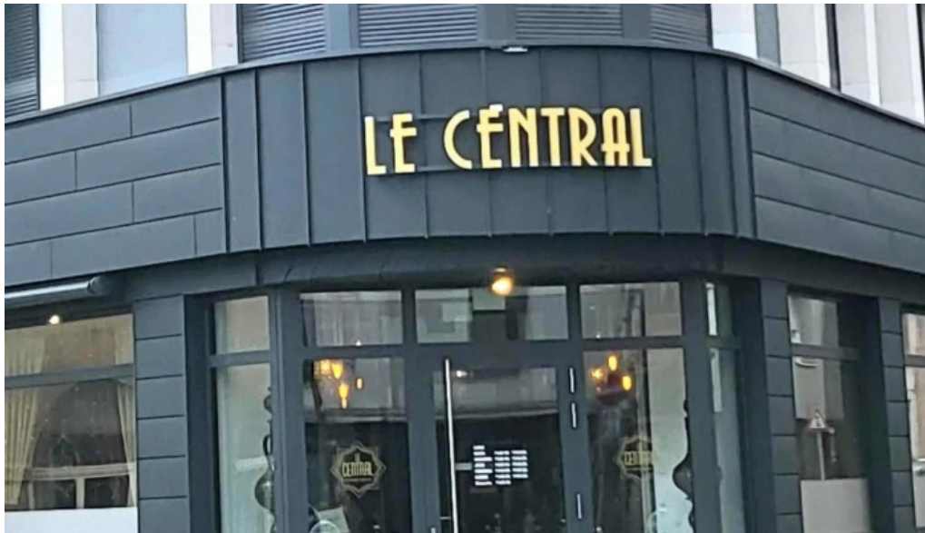
Le central kommentaren