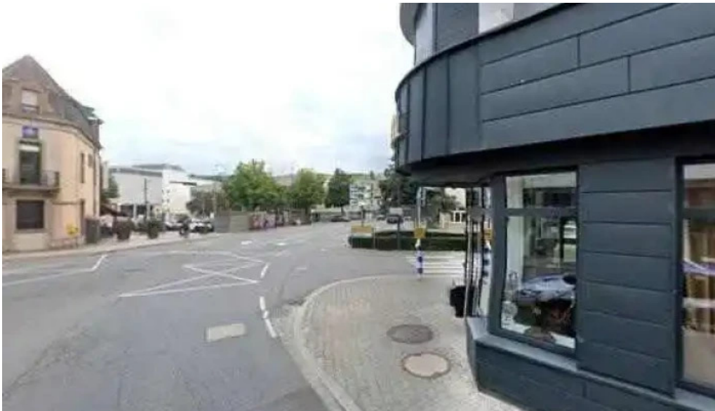
Le central street view 360deg fotos