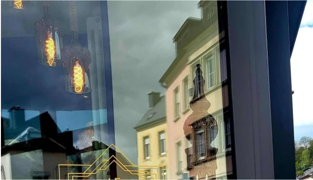
Le central videoen