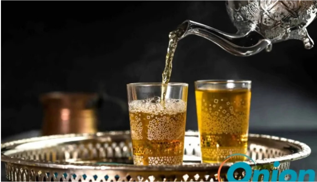
Le central essen und trinken