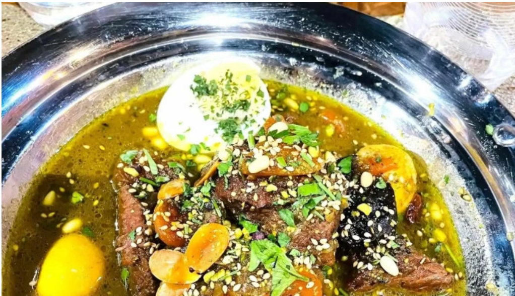
Le central ettelbruck