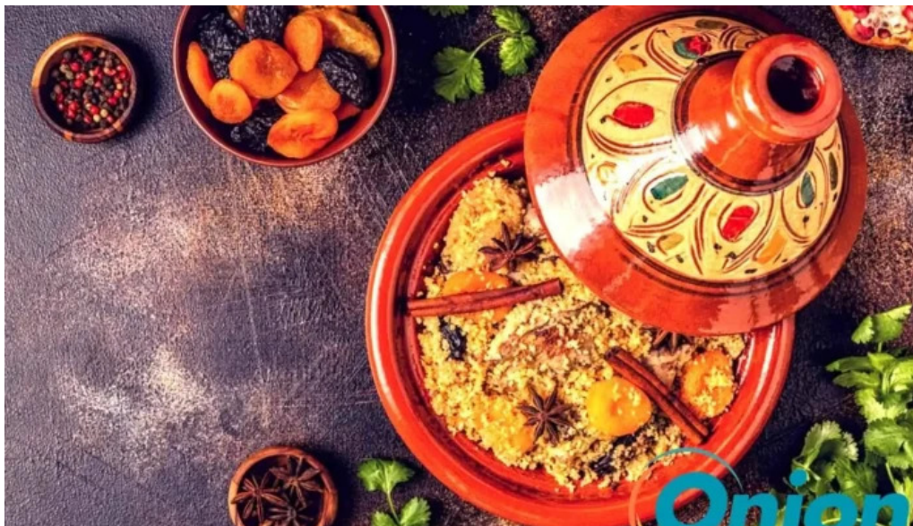
Le central vom inhaber