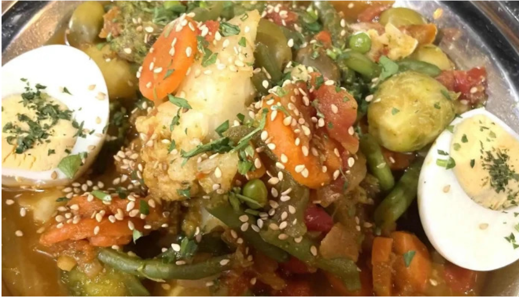
Le central katalog