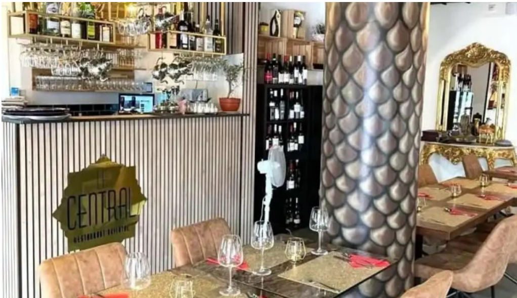
Le central atmosphere