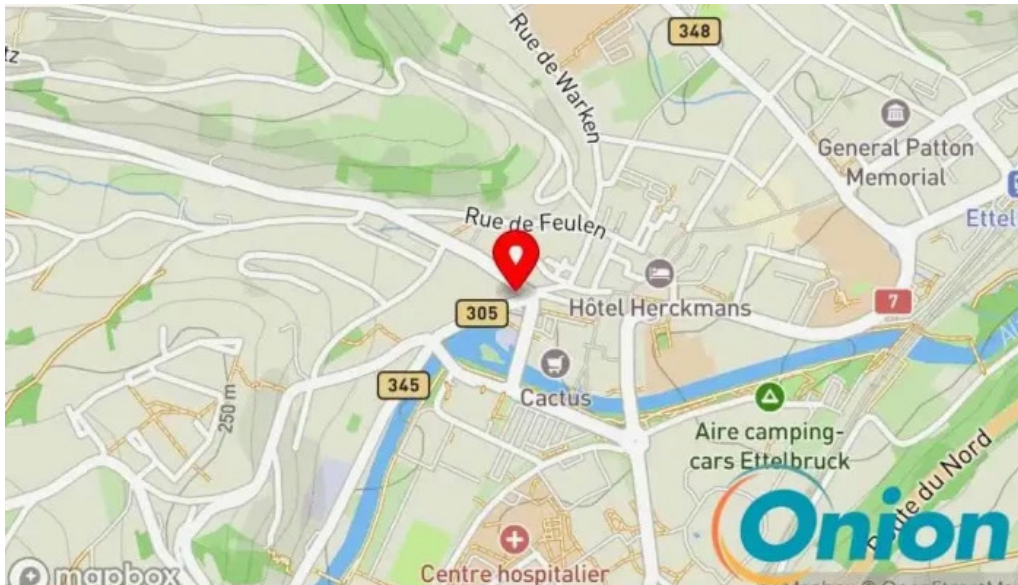
Le central Kaart