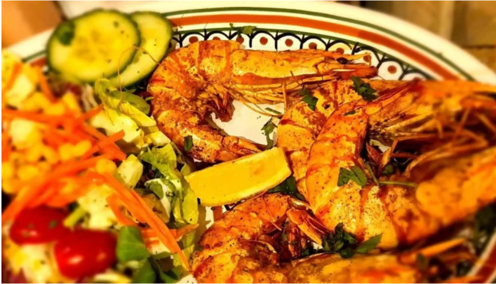
Le central bewaertungen