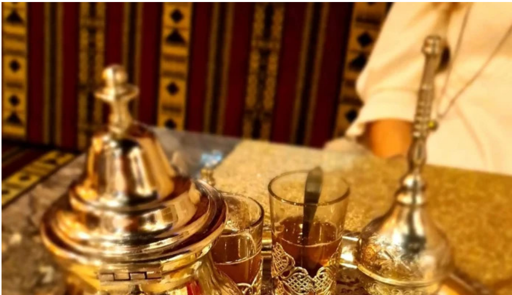
Le central elo op