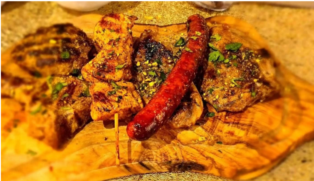
Le central stonnenplang