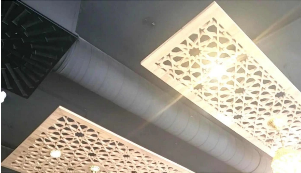
Le central promotioun