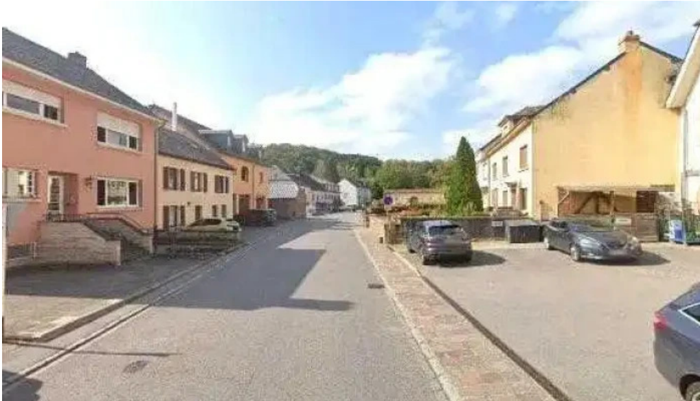
Pall center street view 360deg fotos