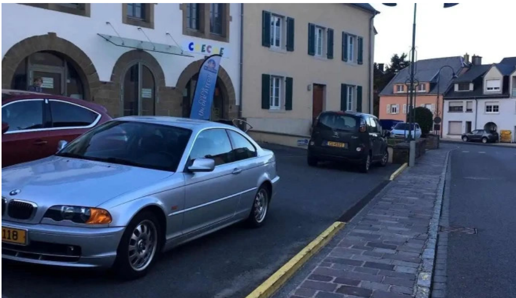
Pall center nummere