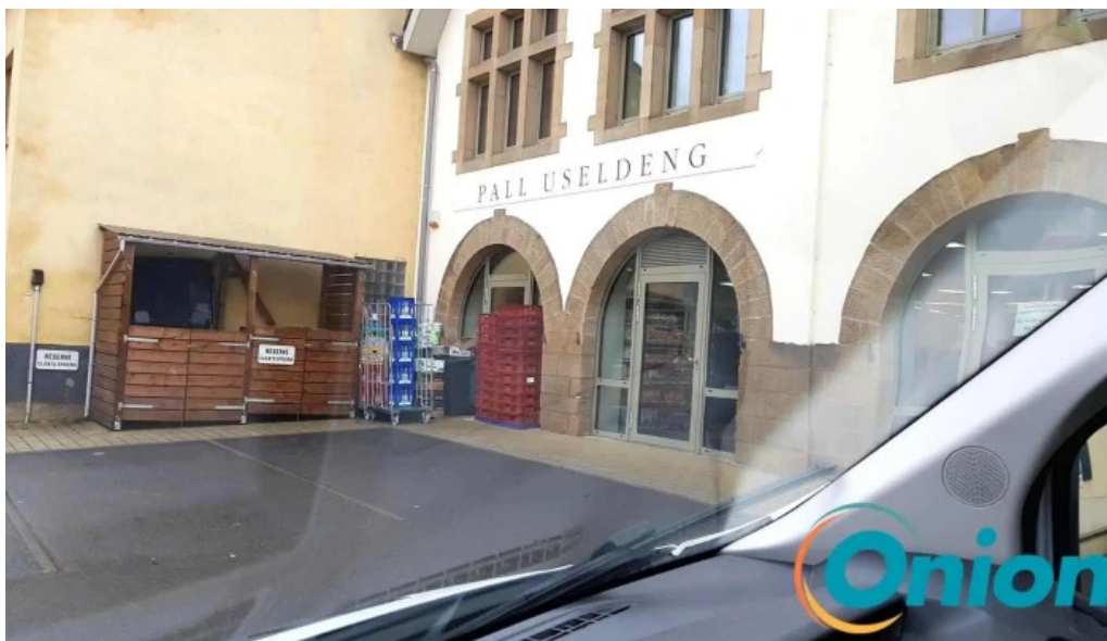
Pall center useldingen