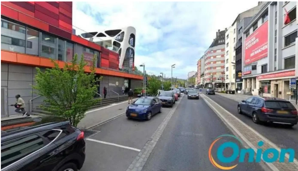
Melting pot esch an der alzette