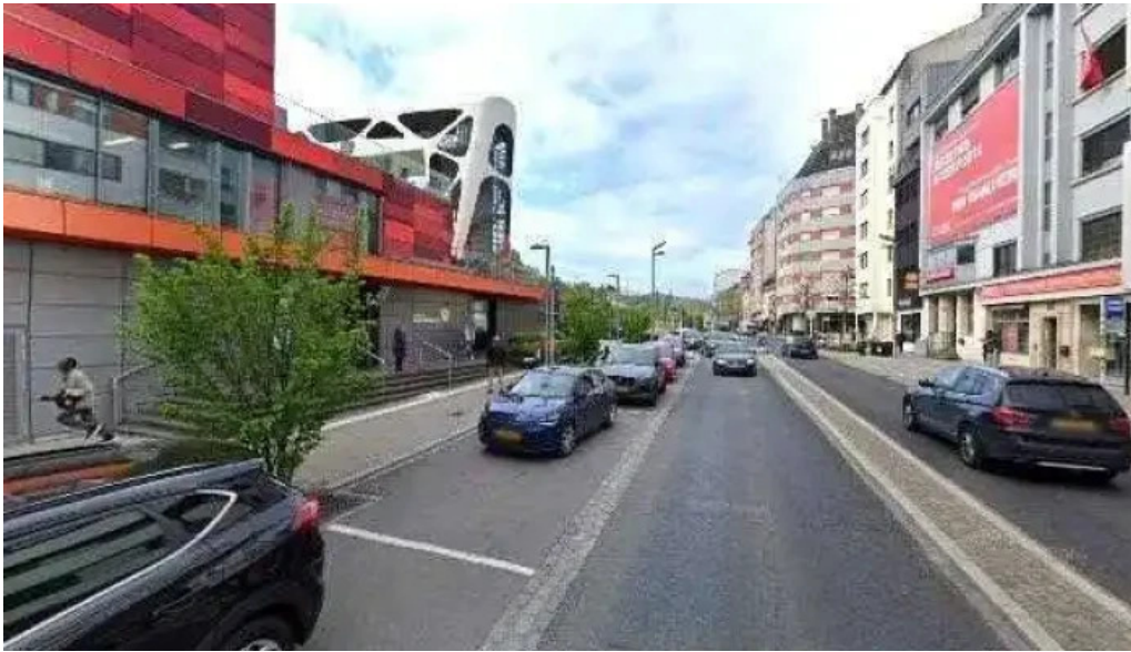
Melting pot videoene