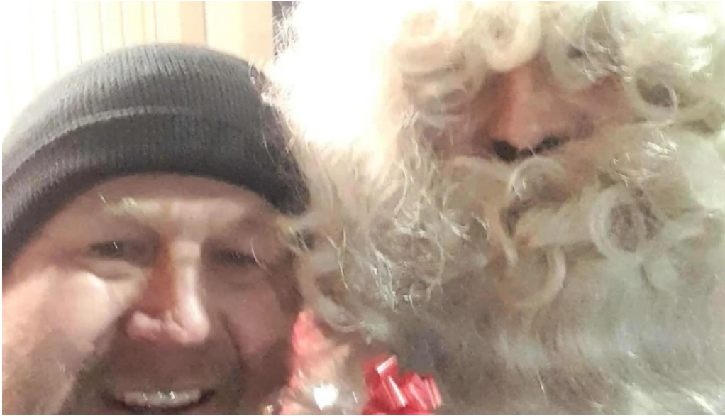
Union remich bous bous