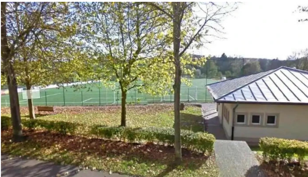
Union remich bous vom inhaber