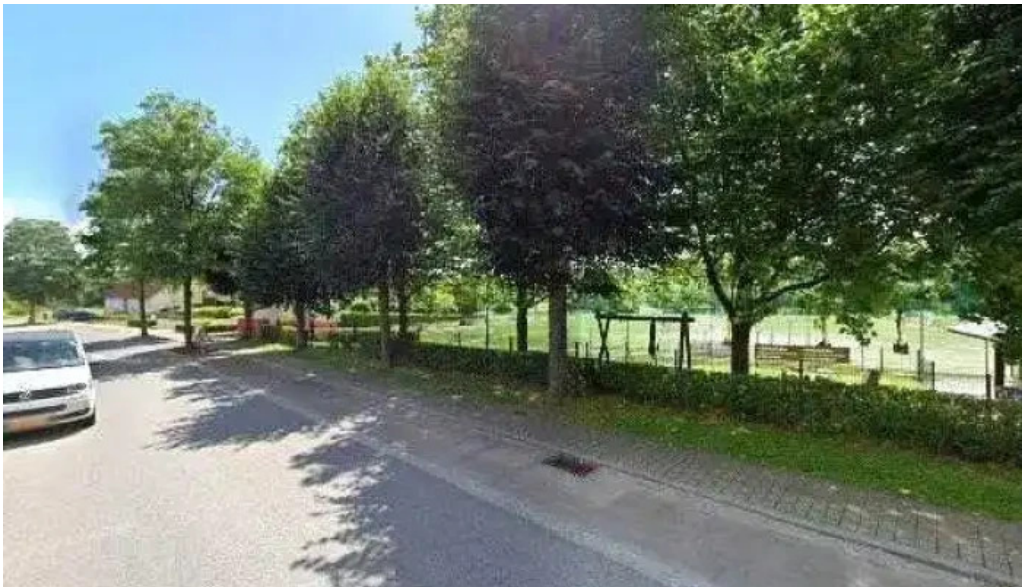
Union remich bous bewaertungene