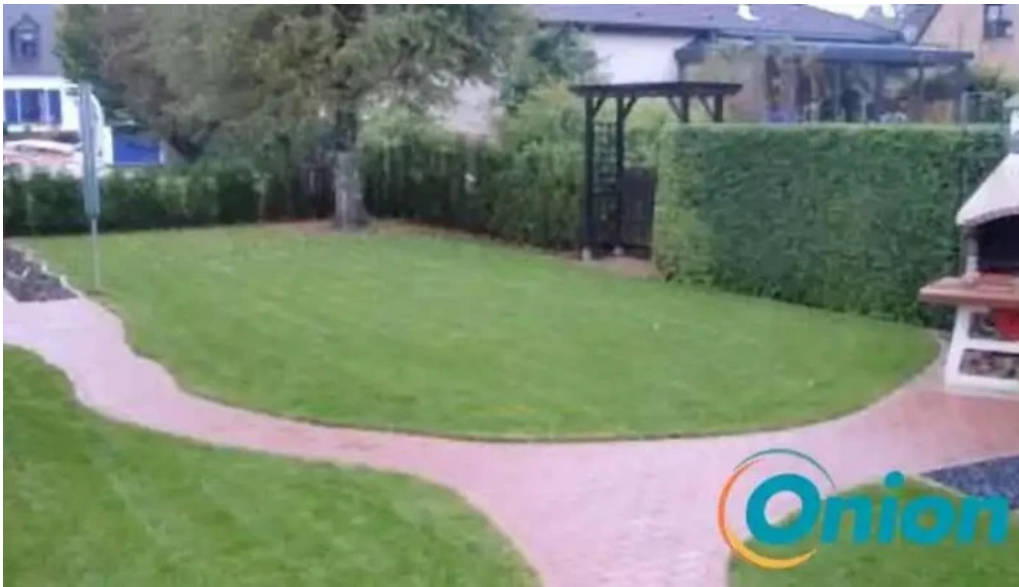
De grengre jeannot jeannot lacour fotoene