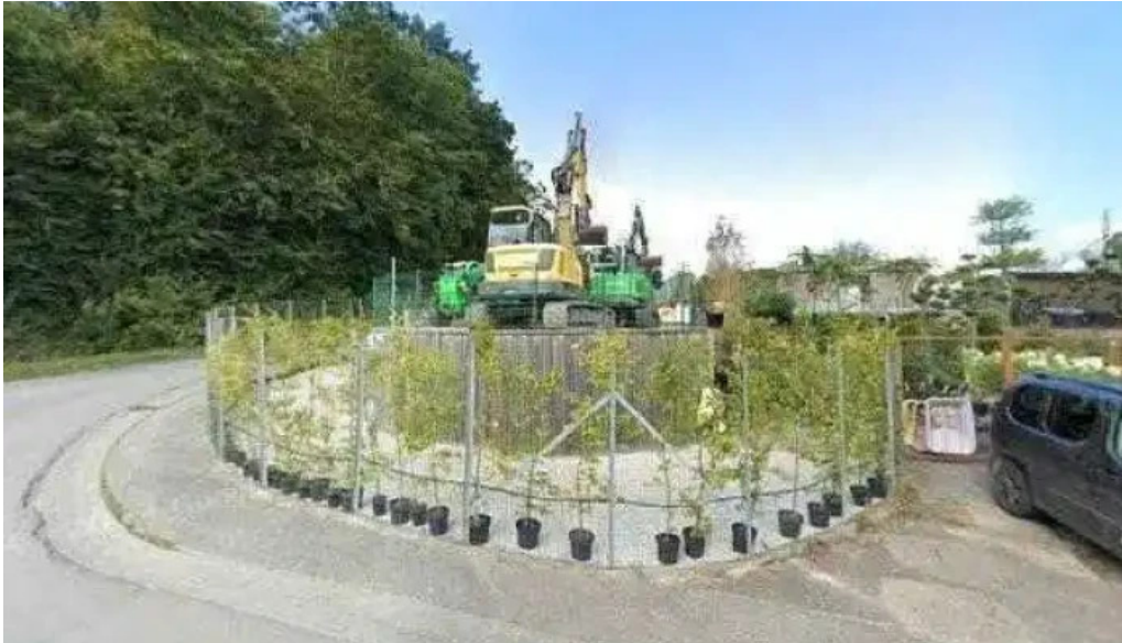
De grengre jeannot jeannot lacour street view 360deg fotos