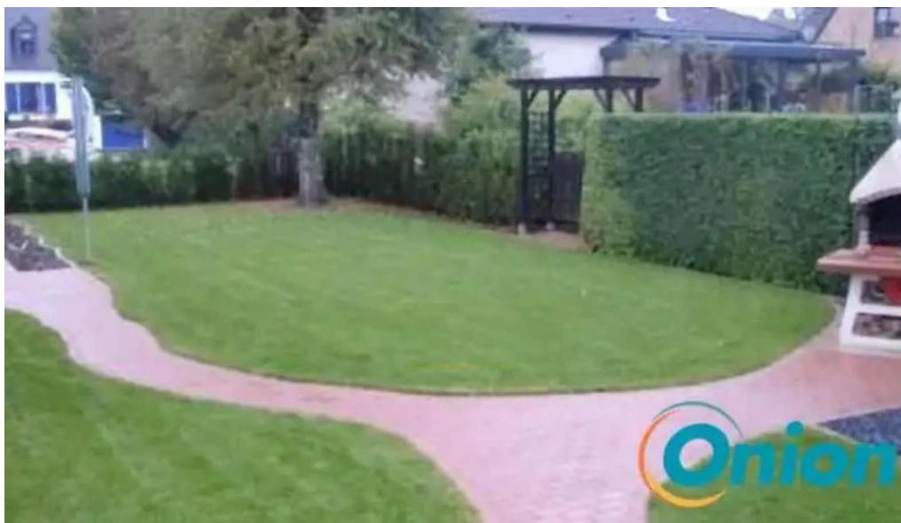
De grengje jeannot jeannot lacour redingen