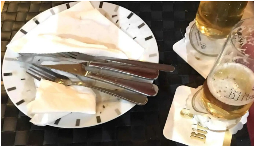
Cafe bit beim dokter websait