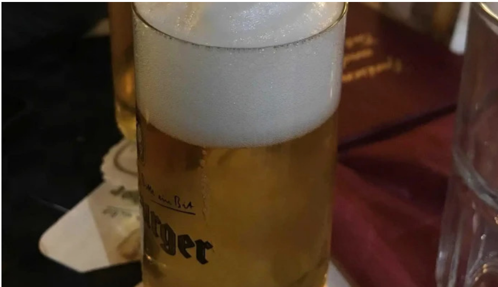
Cafe bit beim dokter promotioun