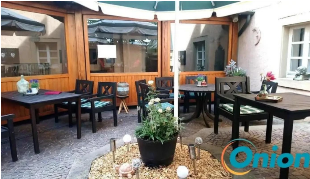
Cafe bit beim dokter atmosphere