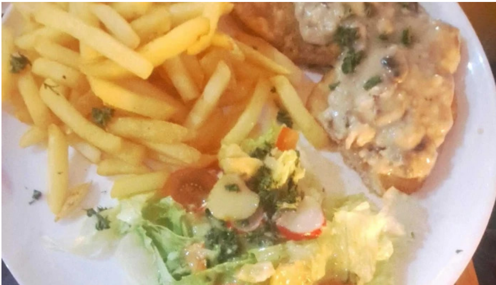
Cafe bit beim dokter location