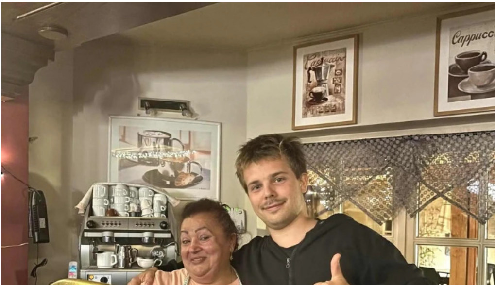
Cafe bit beim dokter adress