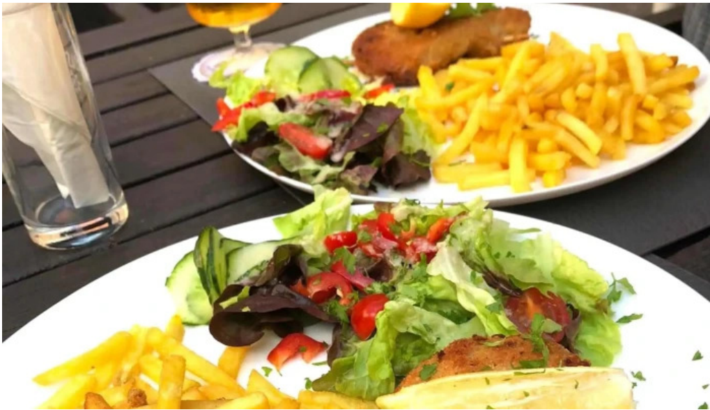
Cafe bit beim doktor echternach