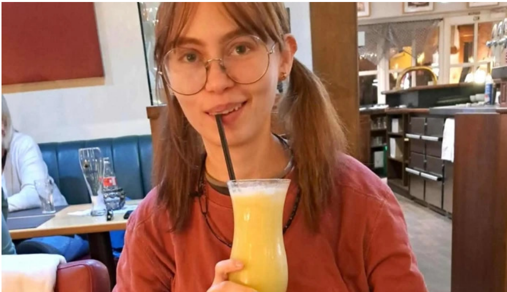
Cafe bit beim dokter kommentaren