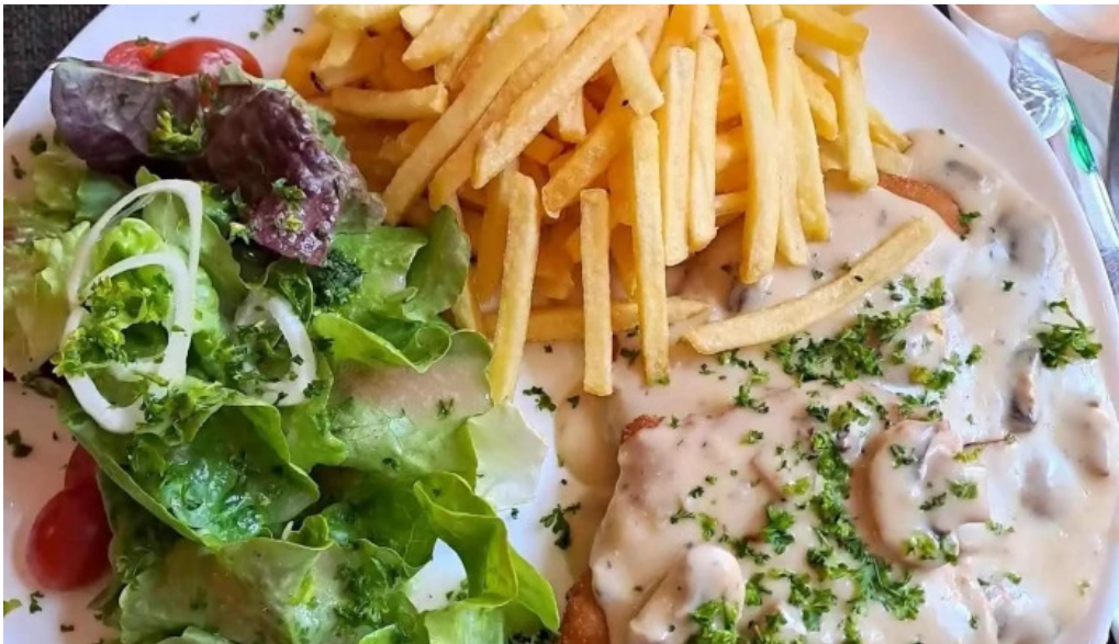
Cafe bit beim dokter essen und trinken