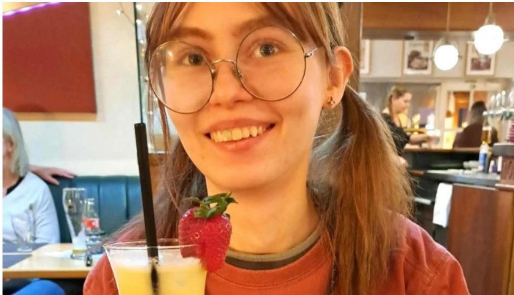
Cafe bit beim dokter elo op