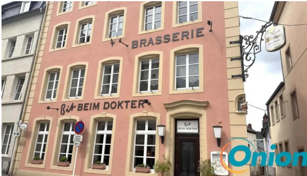
Cafe bit beim dokter elo ope