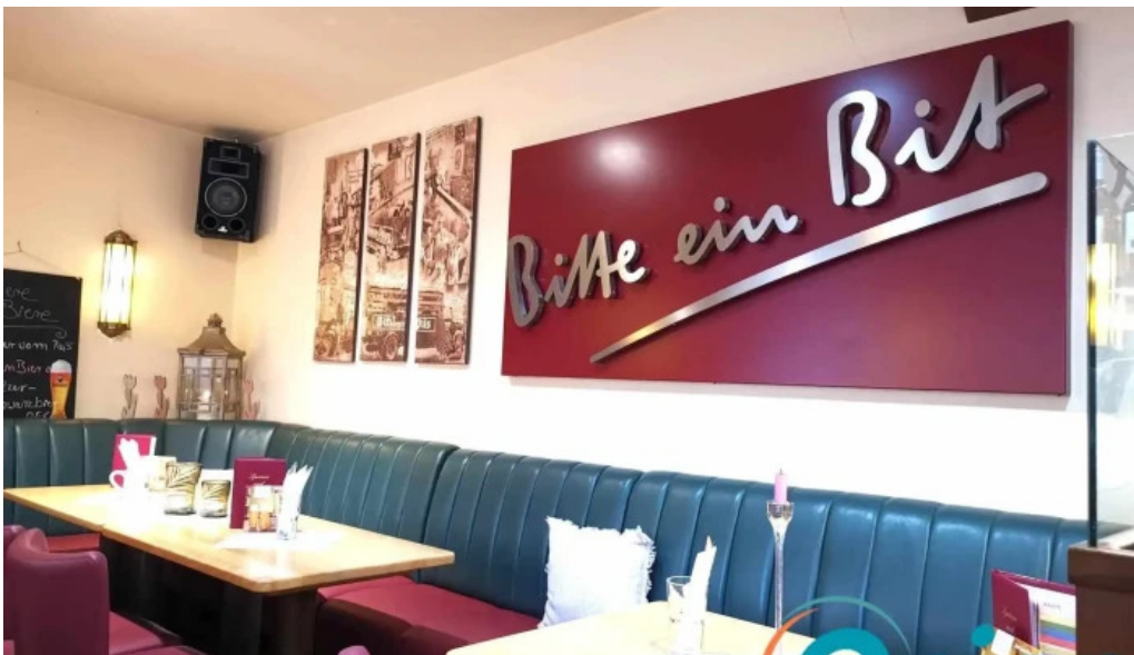
Cafe bit beim doktor bar