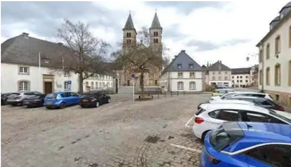
Cafe bit beim dokter street view 360deg fotos