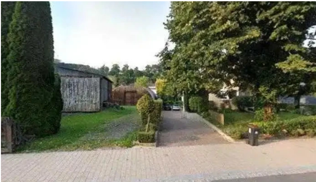
Vichten elo ope