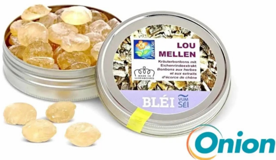
Blei vum sei atelier winseler