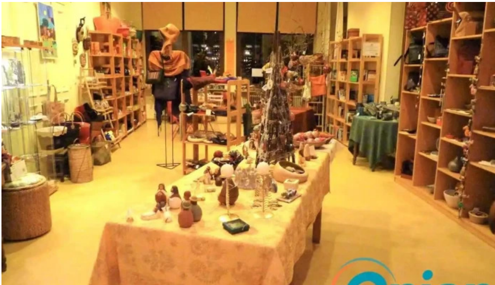
Weltbuttek boutique du monde bettembourg