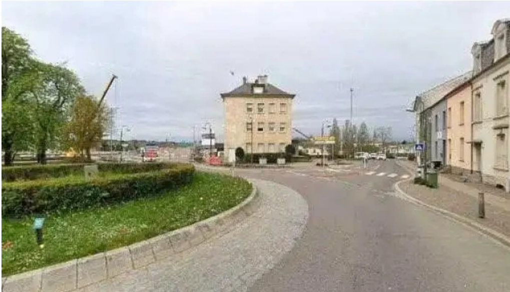
Weltbuttek boutique du monde street view 360deg fotos