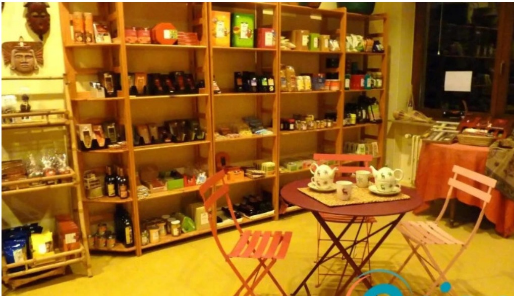
Weltbuttek boutique du monde innenansichten