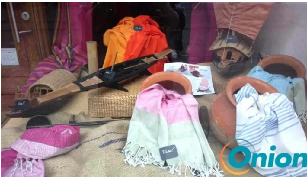
Weltbuttek boutique du monde vom inhaber