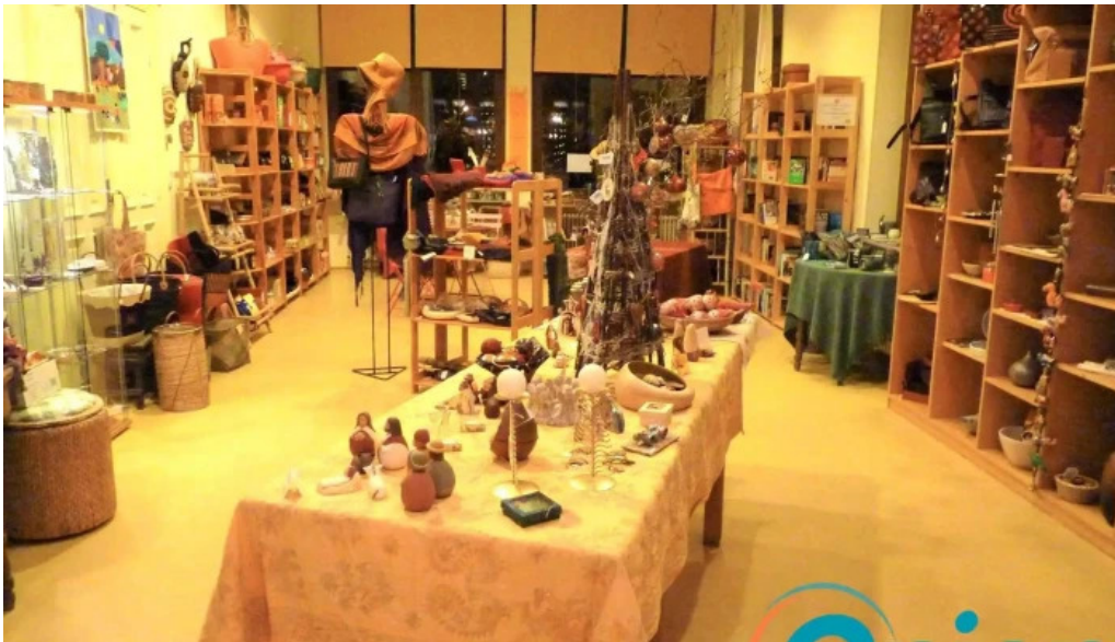
Weltbuttek boutique du monde geigende