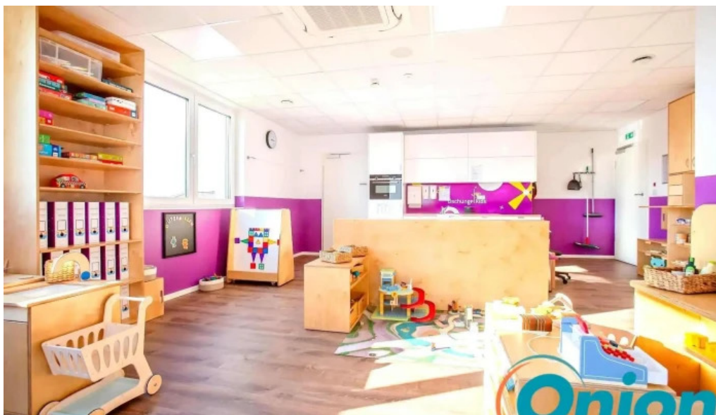
Creche butzemillen vom inhaber