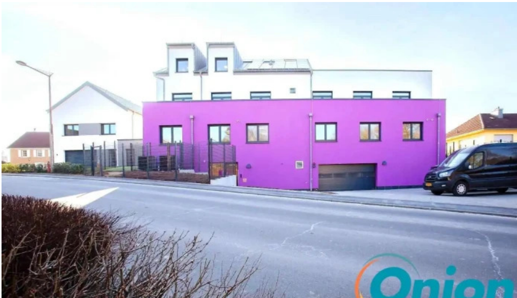
Creche butzemillen bitten