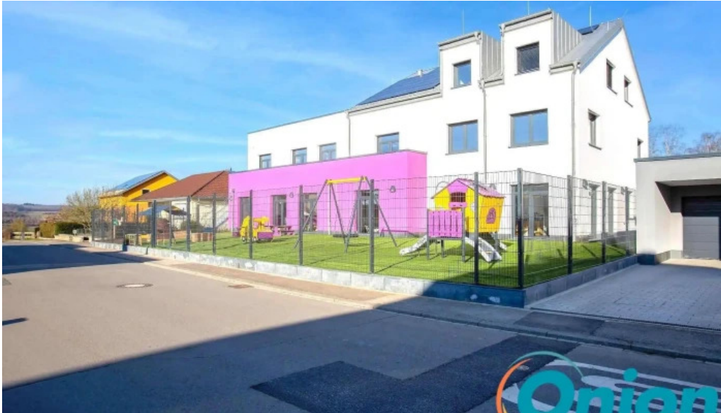
Creche butzemillen neueste