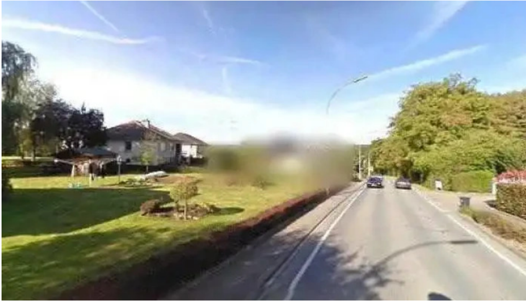
Creche butzemillen street view 360deg fotos