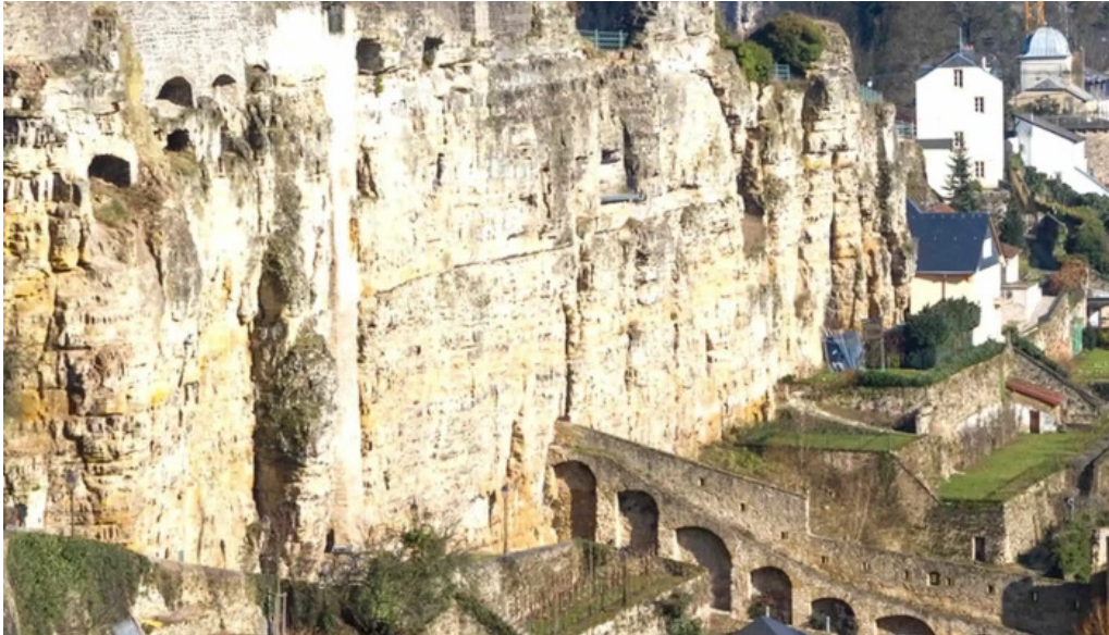
Rocher du bock fotoen