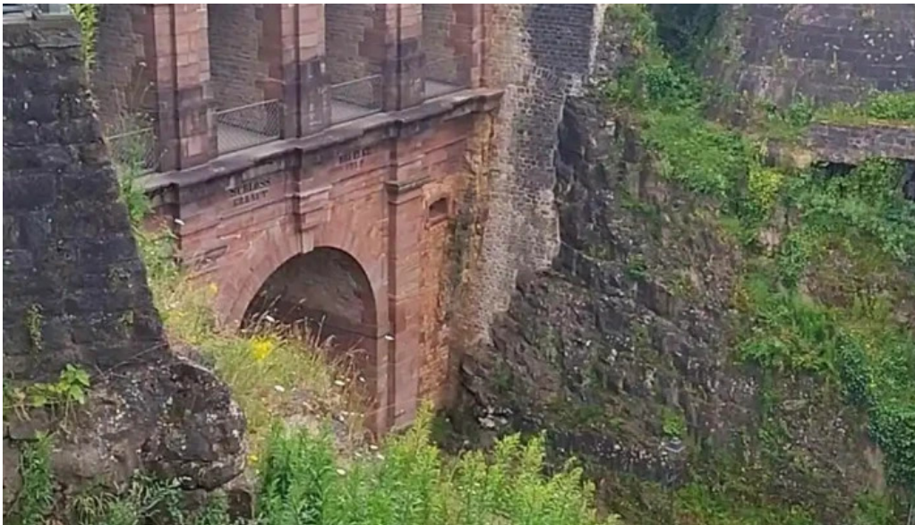
Rocher du bock videos