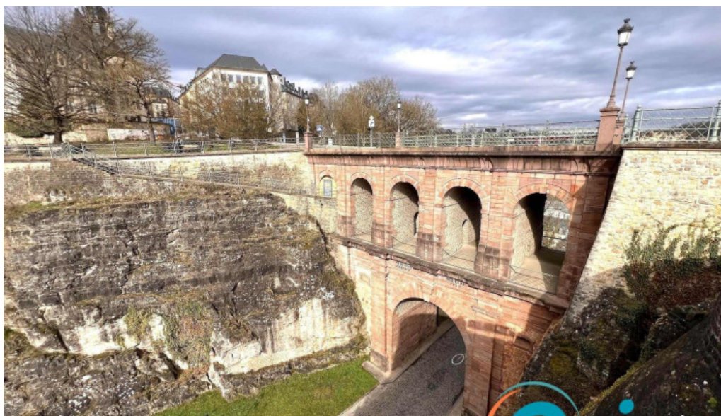
Rocher du bock wei do ukommene