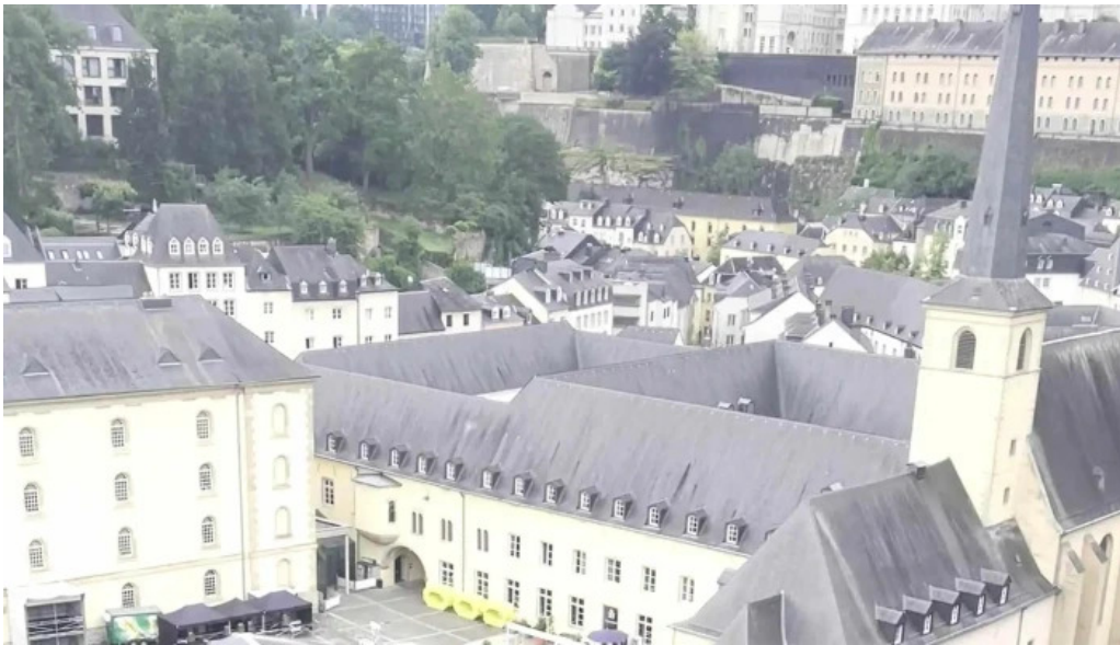
Rocher du bock promotioun