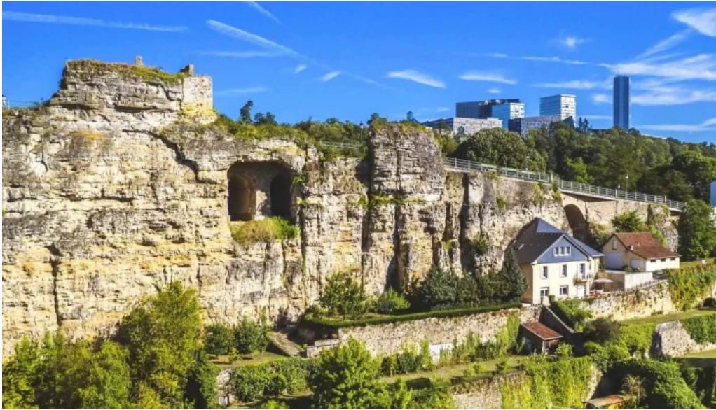
Rocher du bock location