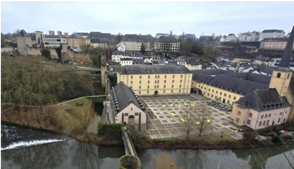
Rocher du bock luxemburg