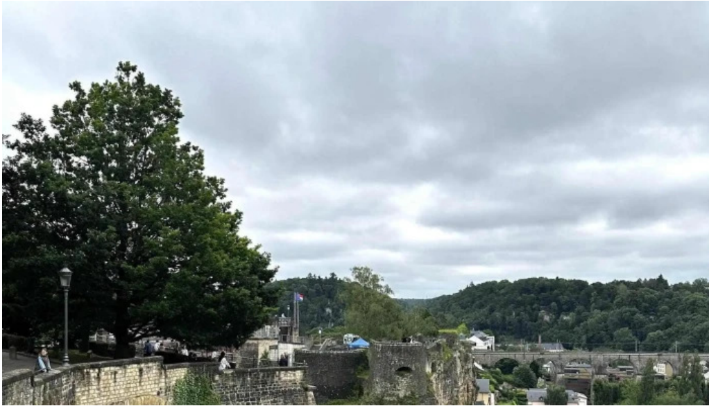
Rocher du bock telefon