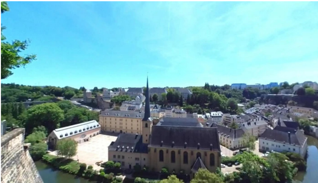
Rocher du bock street view 360deg fotos