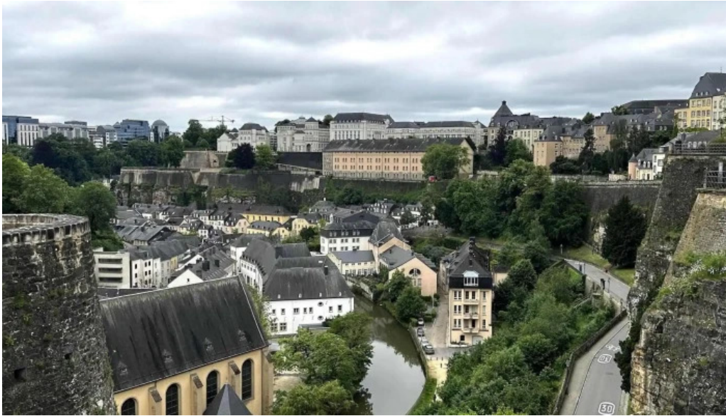
Rocher du bock wei do ukommen