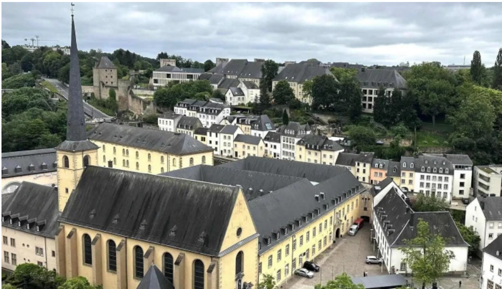
Rocher du bock katalog