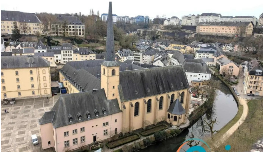
Rocher du bock neueste