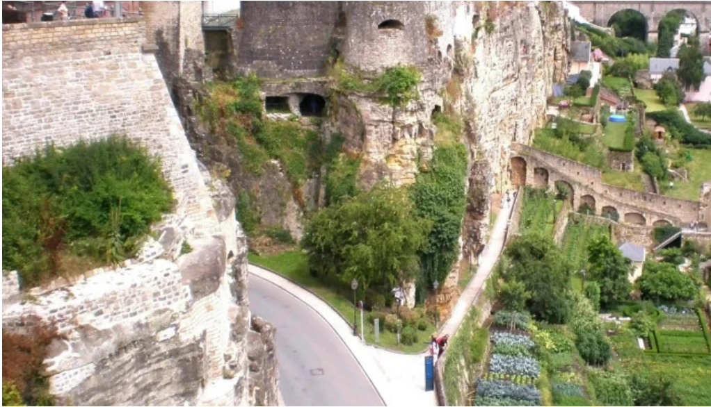
Rocher du bock remisen