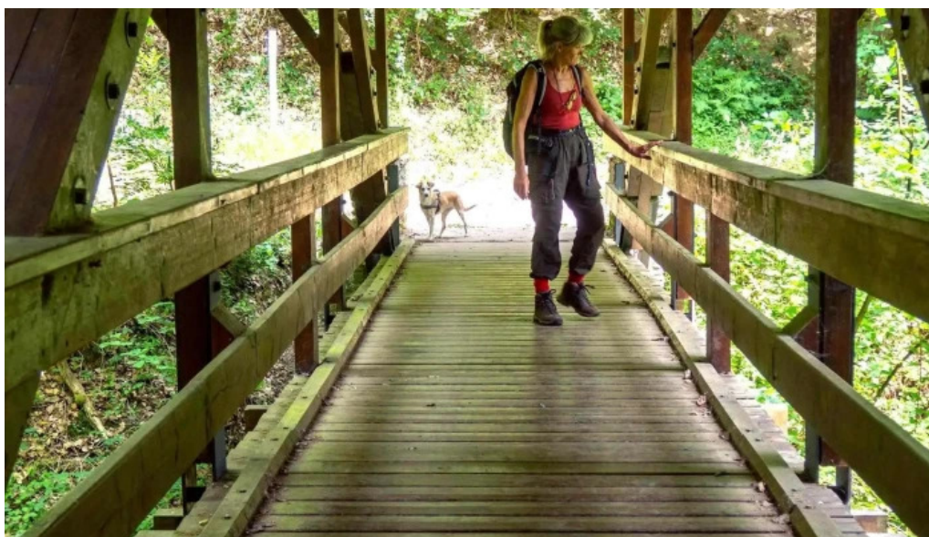
Holzbrücke bosterbaach vianden