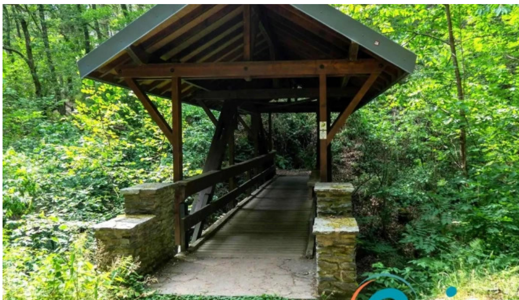
Holzbrücke bosterbaach geigende