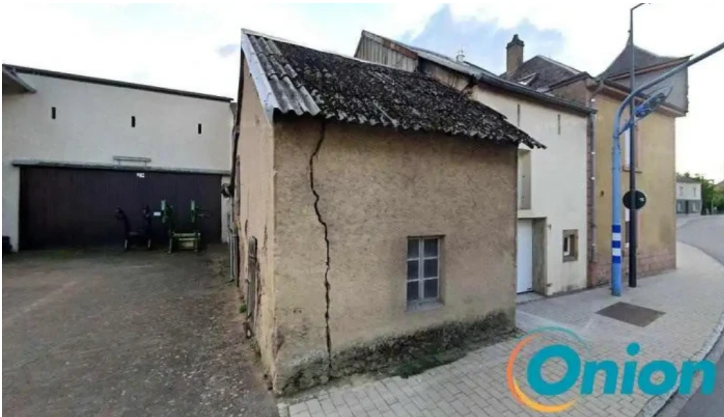
Auberge mathgen vichten