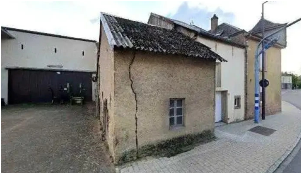
Auberge mathgen stonnenplange