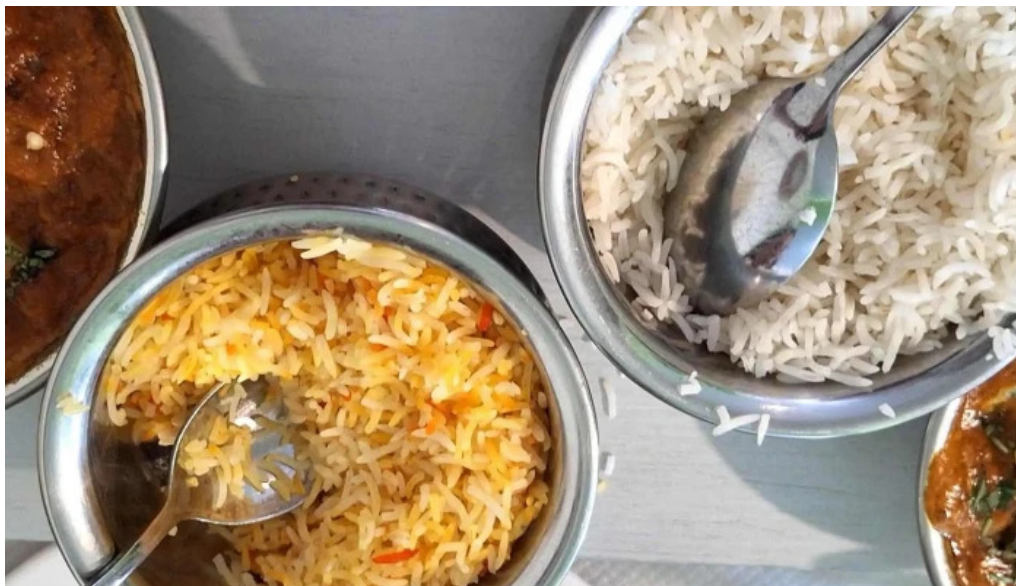
Annapurna 4 rodange promotioun