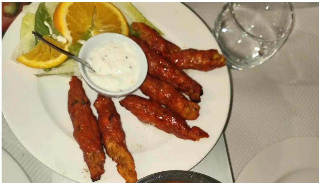
Annapurna 4 rodange wou