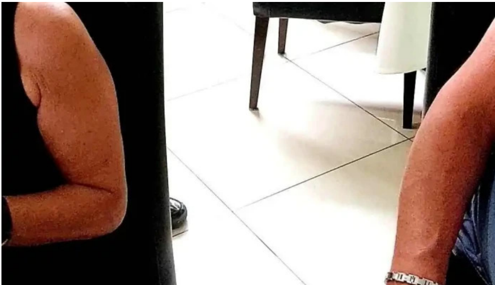
Annapurna 4 rodange videos