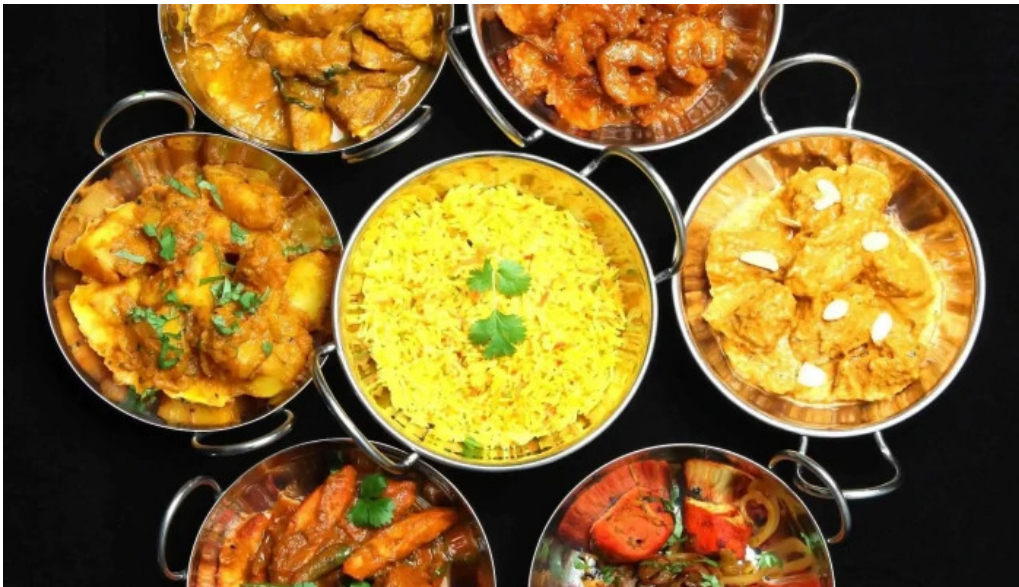
Annapurna 4 rodange essen und trinken