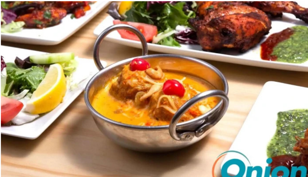
Annapurna 4 rodange vom inhaber