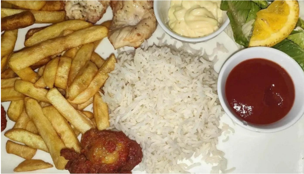
Annapurna 4 rodange petingen