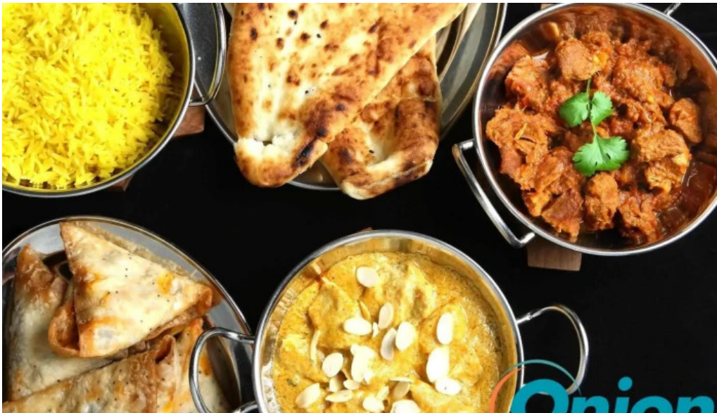
Annapurna 4 rodange curry