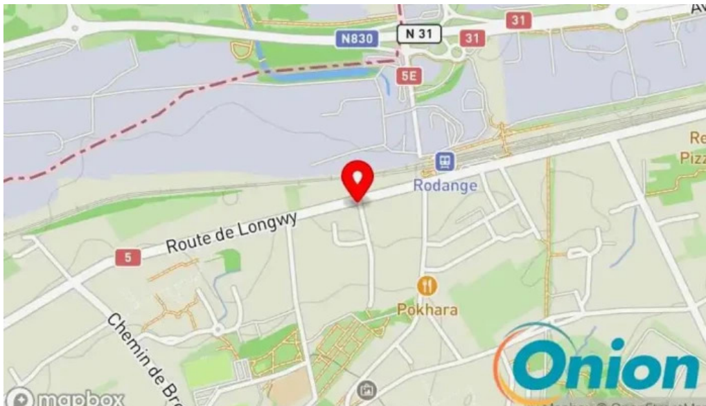
Annapurna 4 rodange Kaart