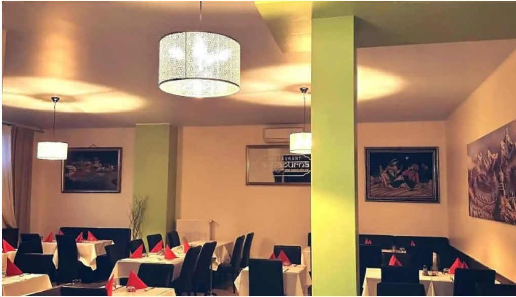
Annapurna 4 rodange atmosphere