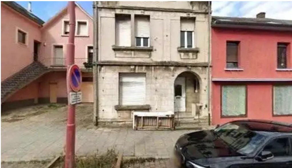
Annapurna 4 rodange street view 360deg fotos