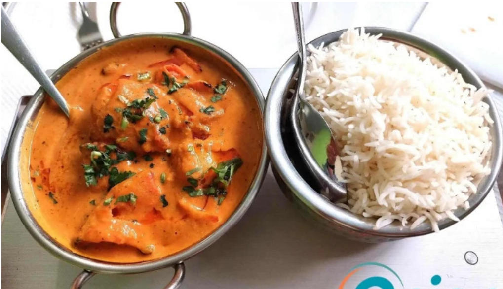
Annapurna 4 rodange chicken tikka masala