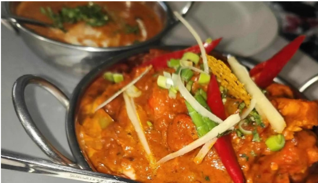
Annapurna 4 rodange adress