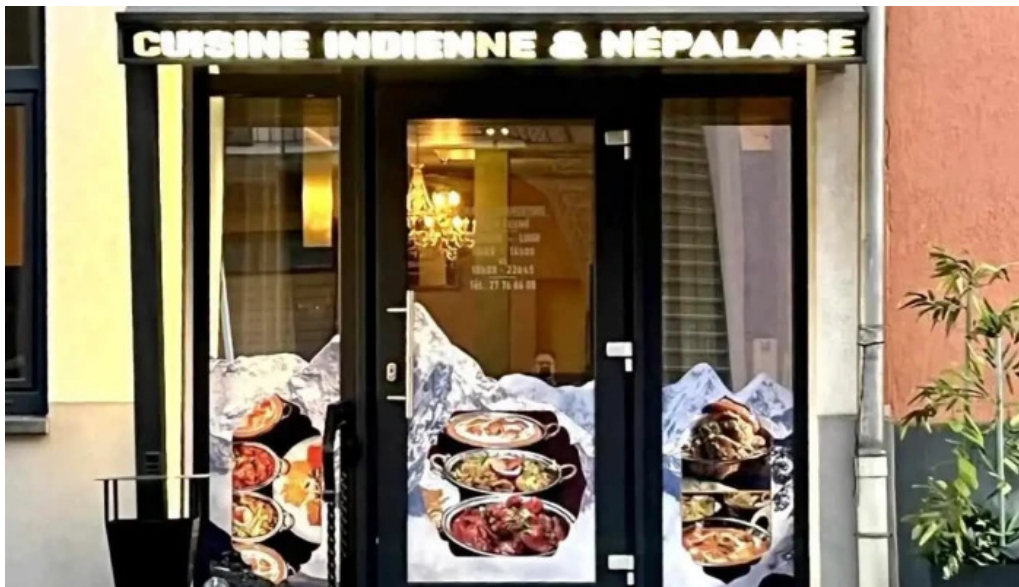
Annapurna 4 rodange woue