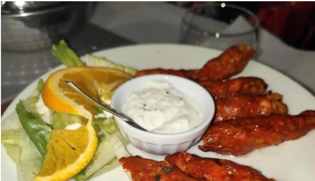
Annapurna 4 rodange bewaertung