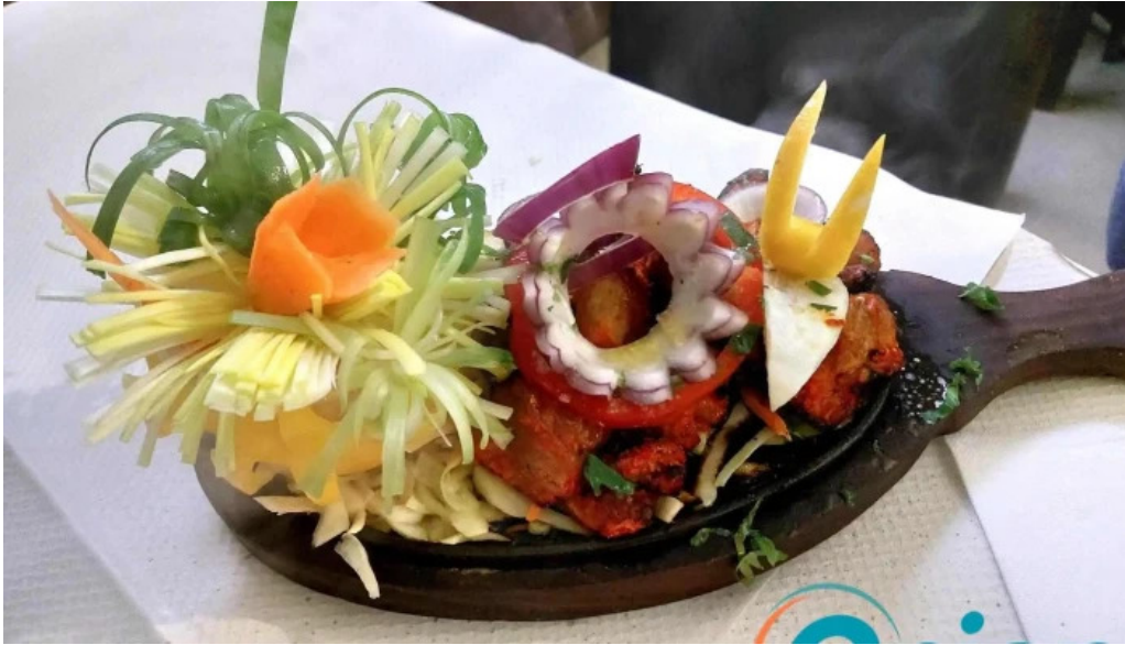
Annapurna 4 rodange tandoori huhn