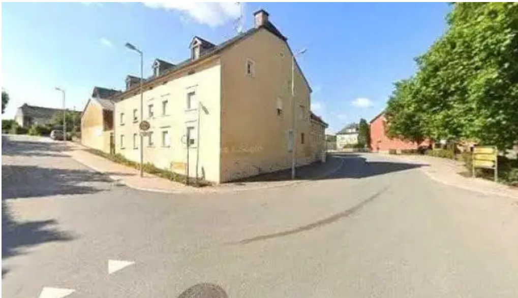
Folschette elo ope