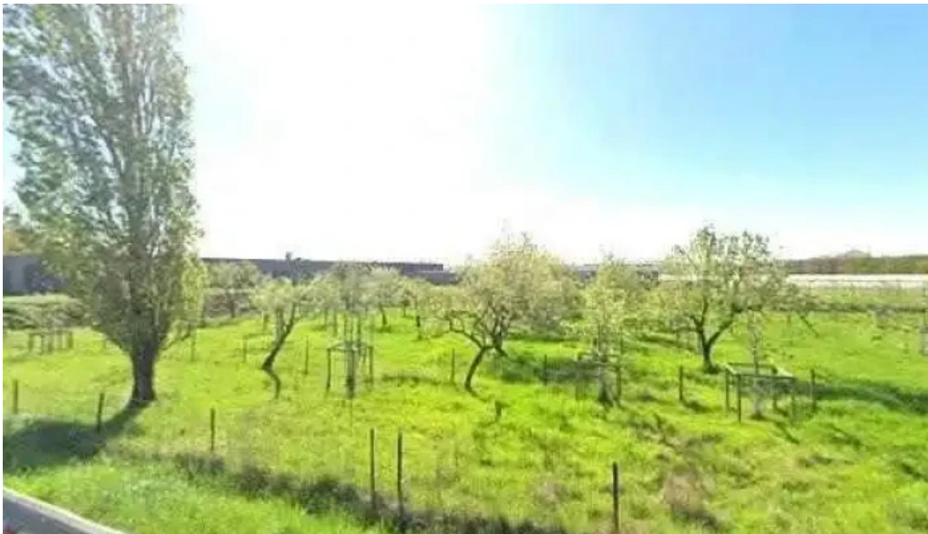
Apemh lampecher buttek street view 360deg fotos