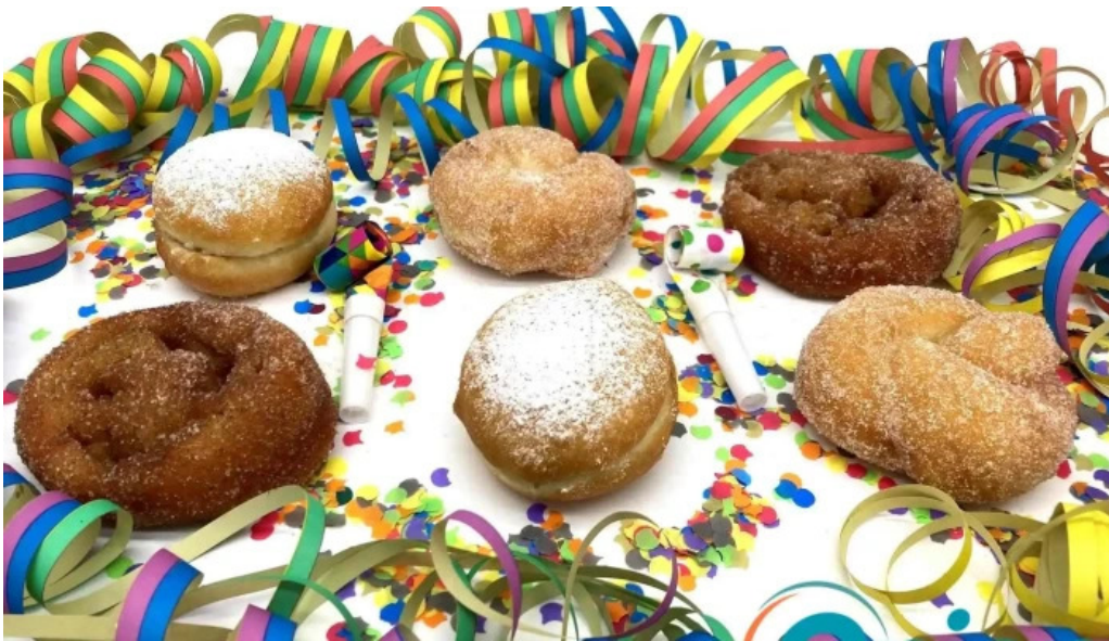
Apemh lampecher buttek woue