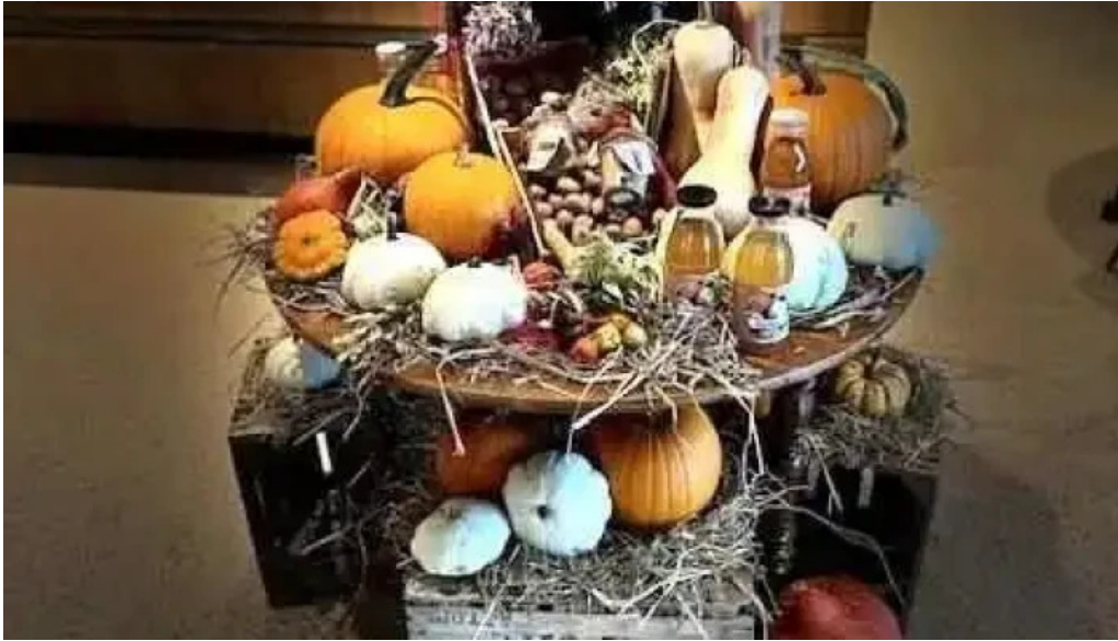
Apemh lampecher buttek reckingen mess