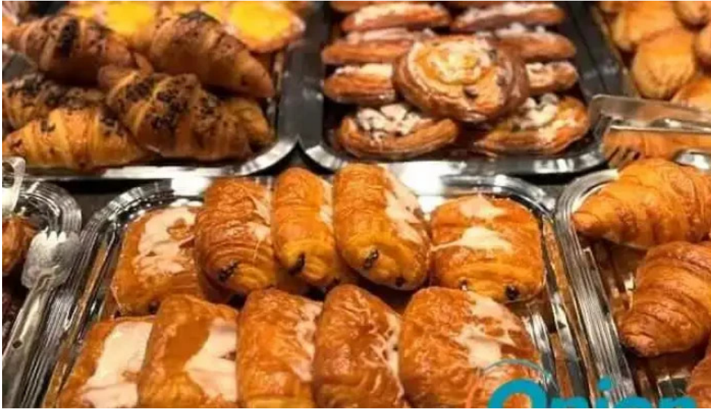
Apemh lampecher buttek vom inhaber