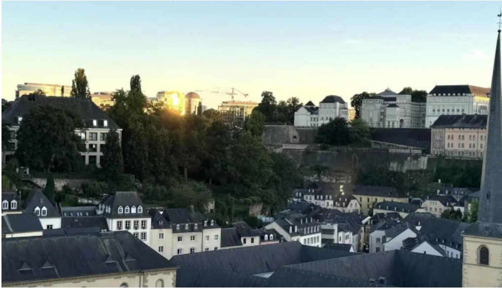
Bockfels luxembourg city promotioun