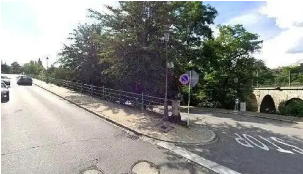
Bockfels luxembourg city street view 360deg fotos