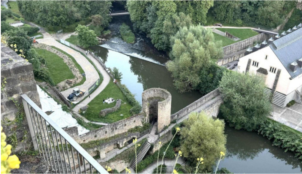
Bockfels luxembourg city telefon