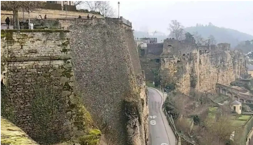
Bockfels luxembourg city videos