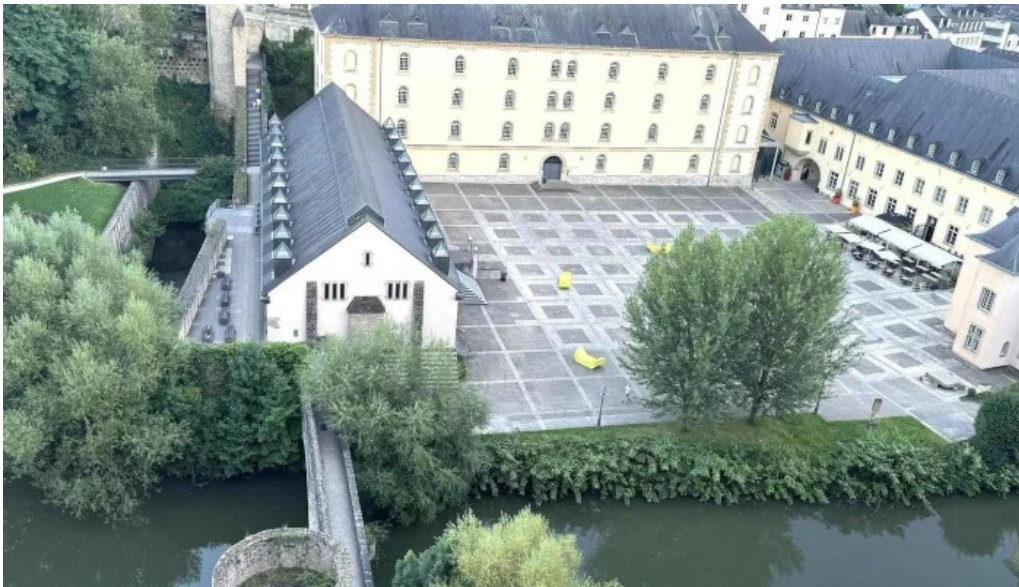
Bockfels luxembourg city stonnenplang