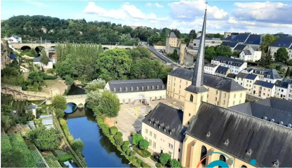
Bockfels luxembourg city stonnenplange