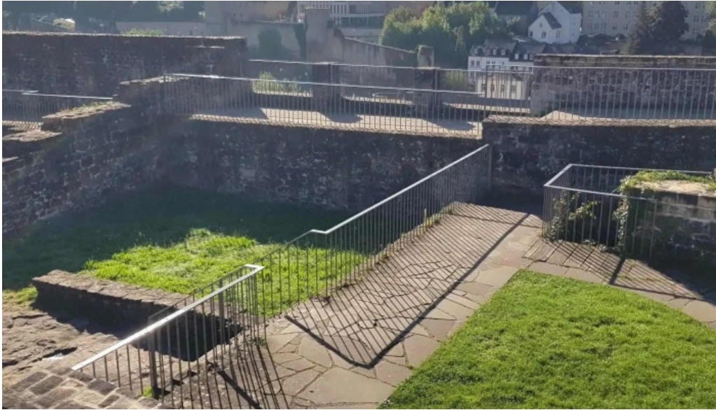
Bockfels luxembourg city wou