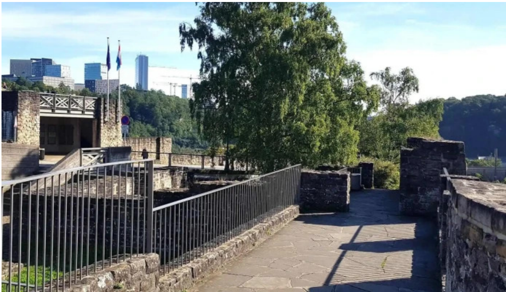
Bockfels luxembourg city nummer