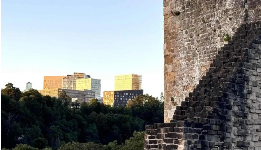
Bockfels luxembourg city luxemburg