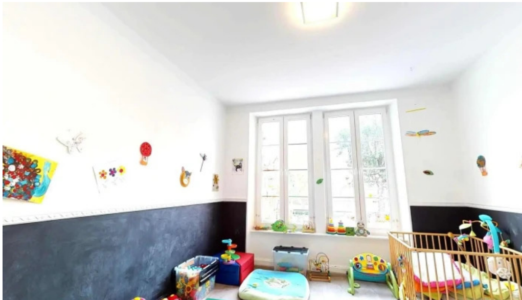
Les explorateurs du bonheur street view 360deg fotos