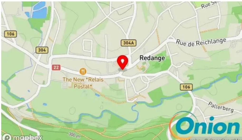
Les explorateurs du bonheur Kaart