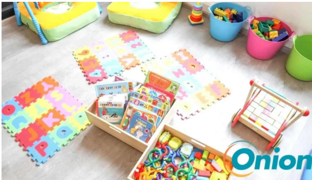
Les explorateurs du bonheur redingen