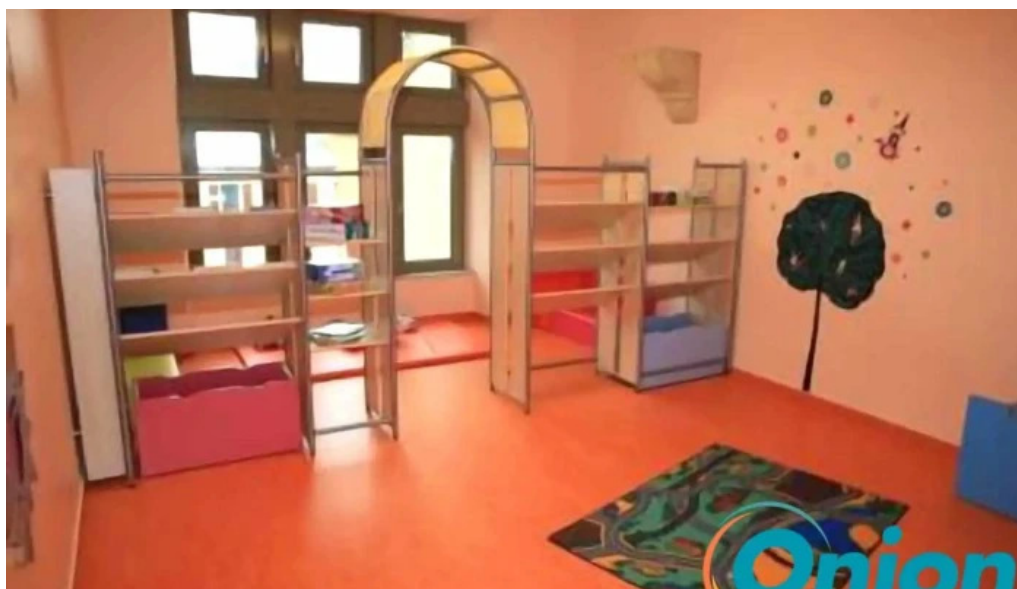
Creche un der atert vom inhaber