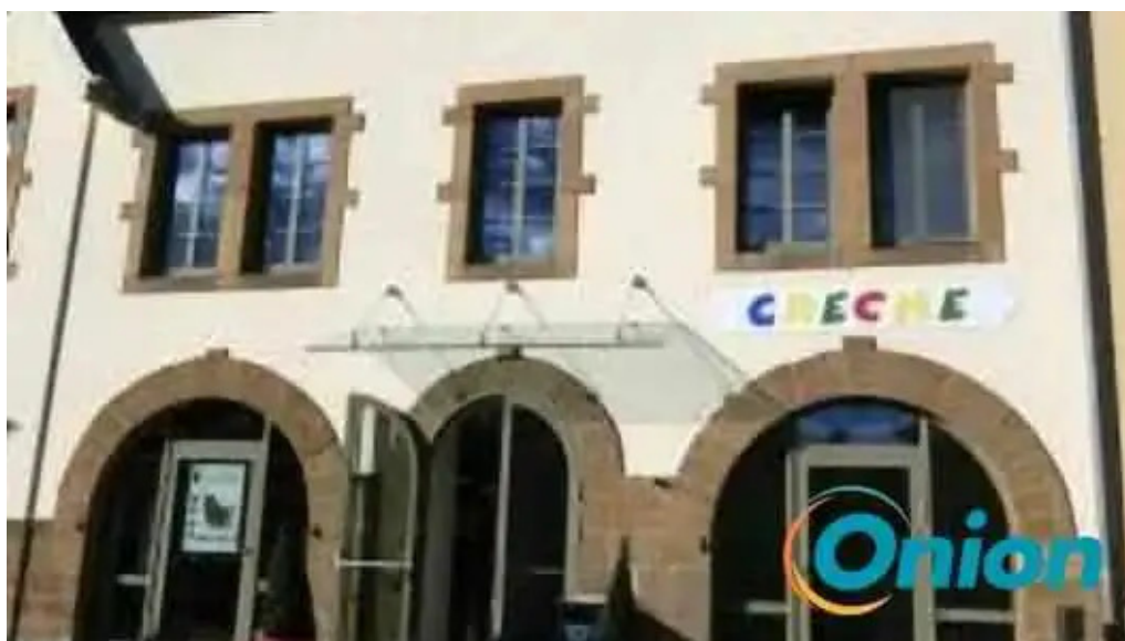
Creche un der atert useldingen