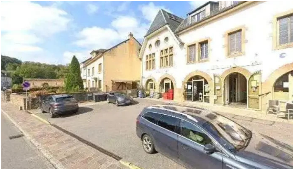
Creche un der atert street view 360deg fotos