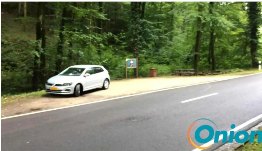
Gemengebesch hiefenech loschbur videos