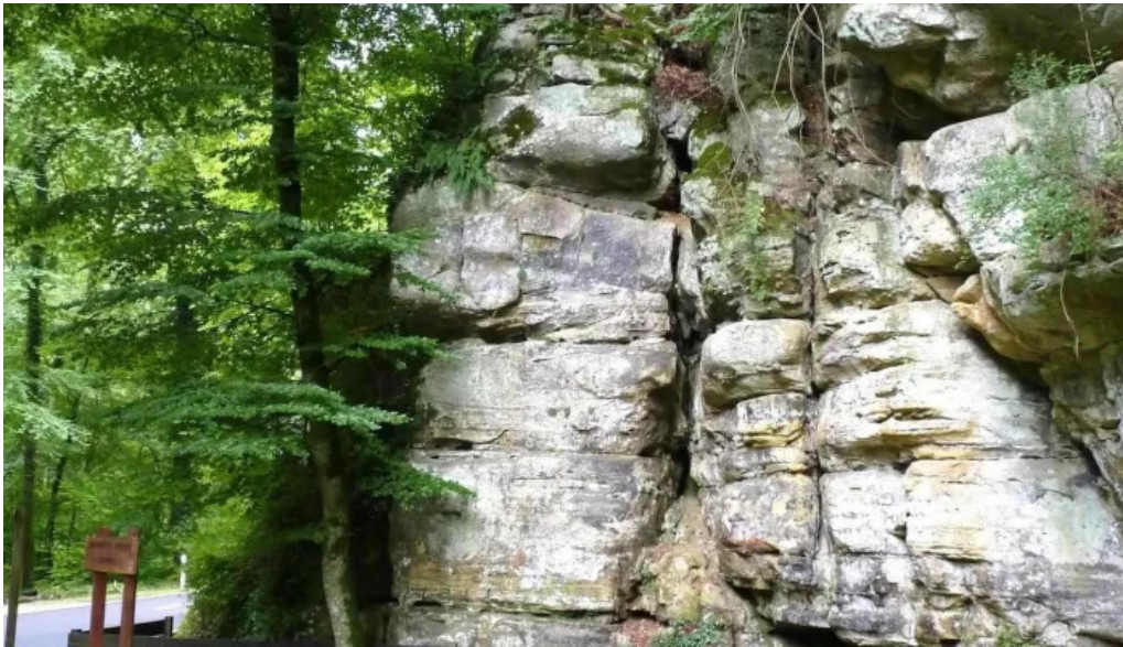
Gemengebesch hiefenech loschbur wei do ukommene