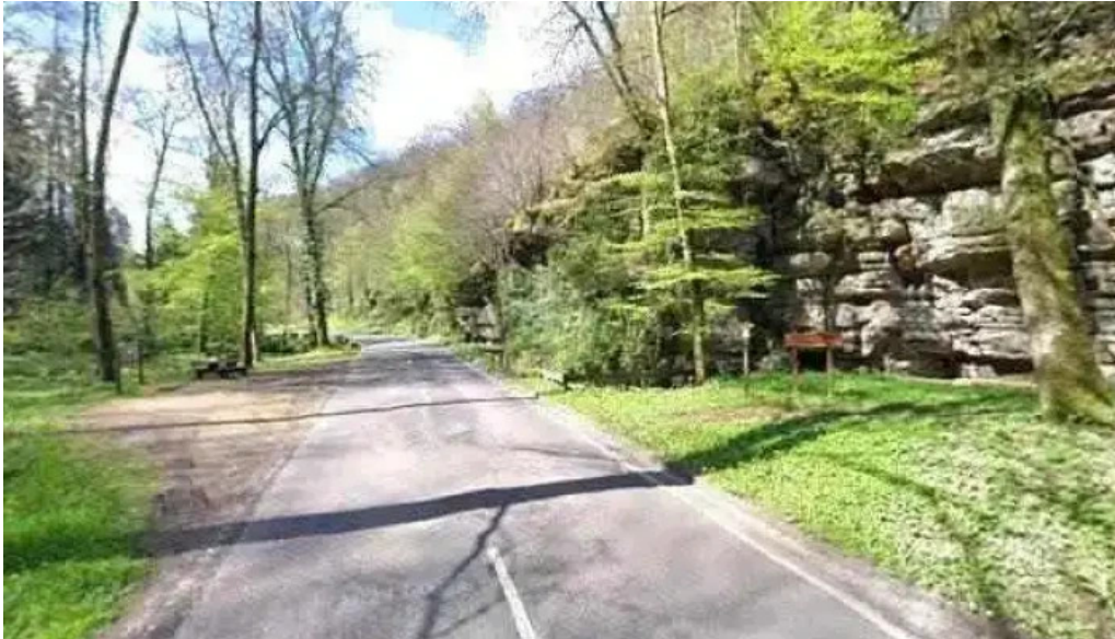
Gemengebesch hiefenech loschbur street view 360deg fotos