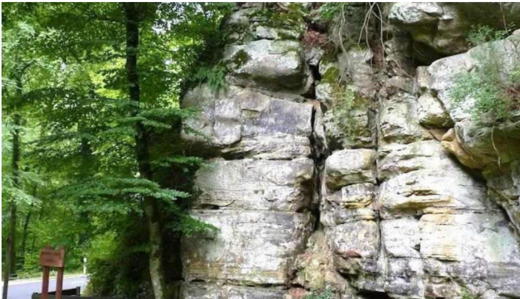
Gemengebesch hiefenech loschbur heffingen