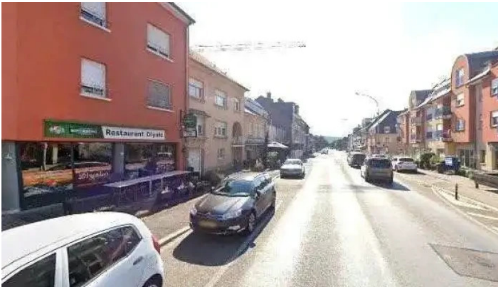
Diyalo restaurant street view 360deg fotos