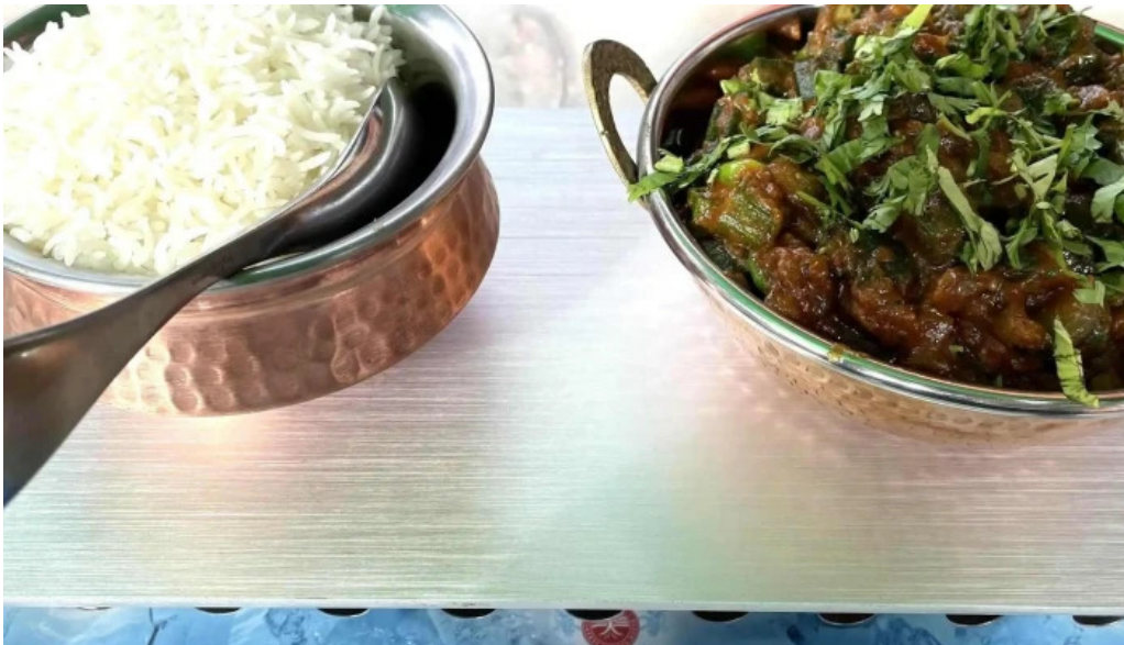
Diyalo restaurant adress