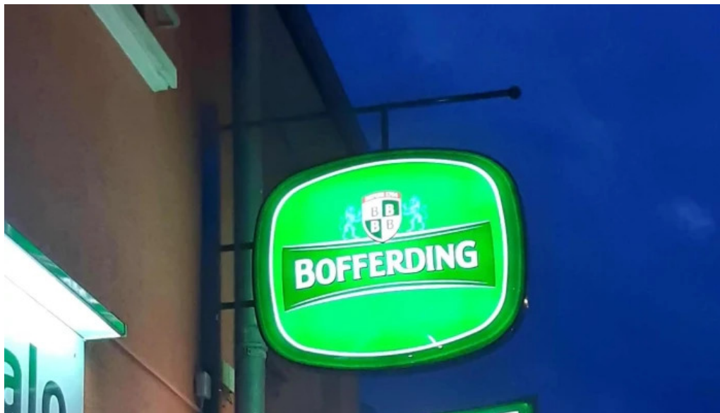
Diyalo restaurant remisen