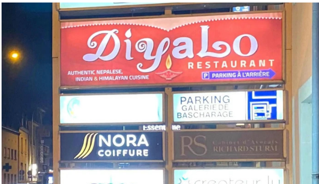
Diyalo restaurant vom inhaber