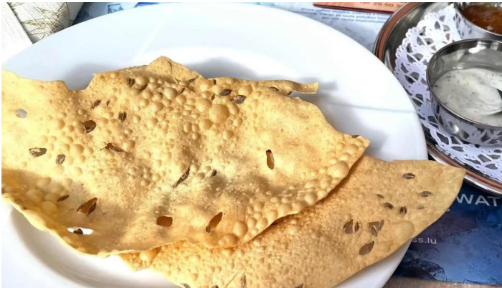
Diyalo restaurant elo op