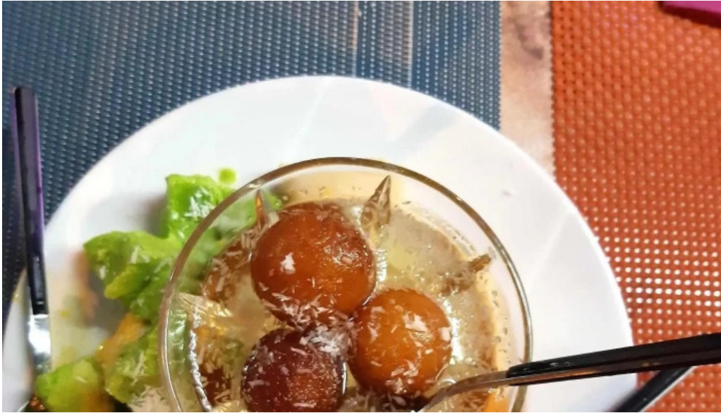
Diyalo restaurant bewaertung