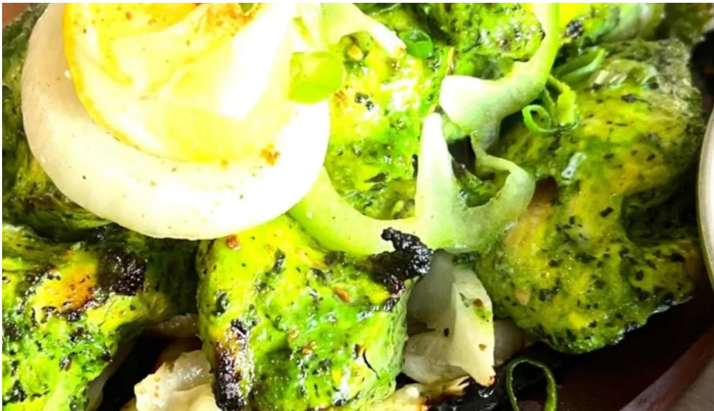
Diyalo restaurant kaerjeng