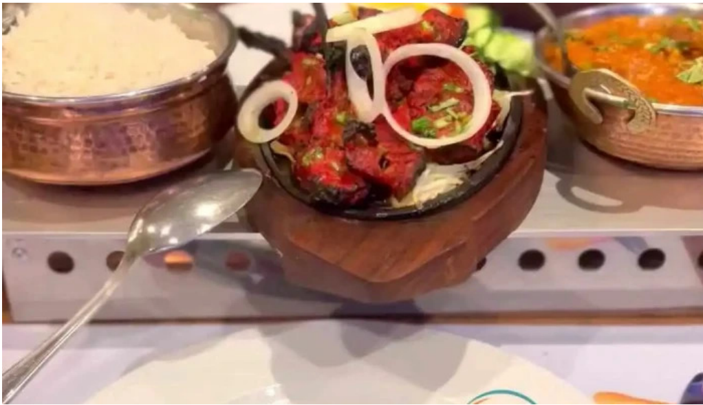
Diyalo restaurant videos