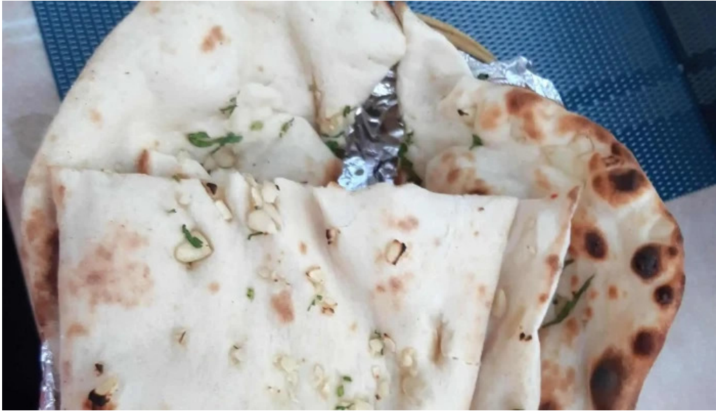
Diyalo restaurant fotoen