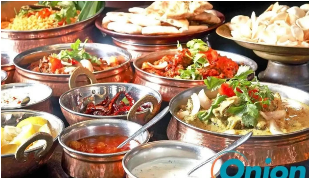
Diyalo restaurant elo ope