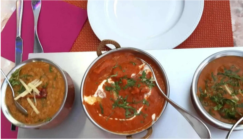
Diyalo restaurant kommentaren