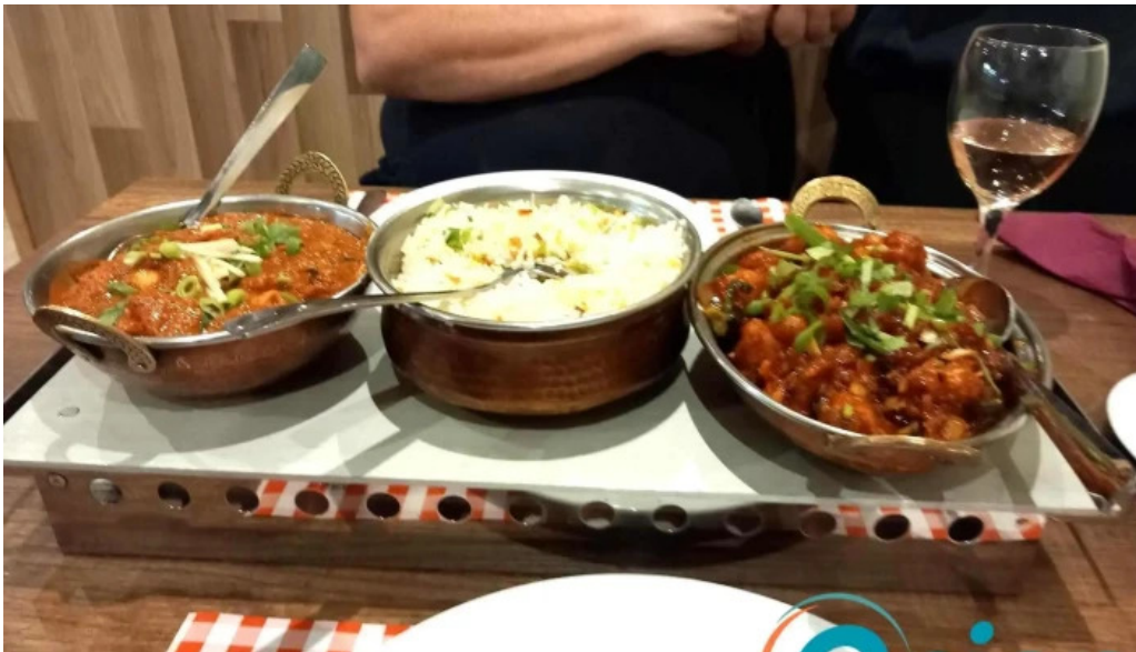
Diyalo restaurant curry