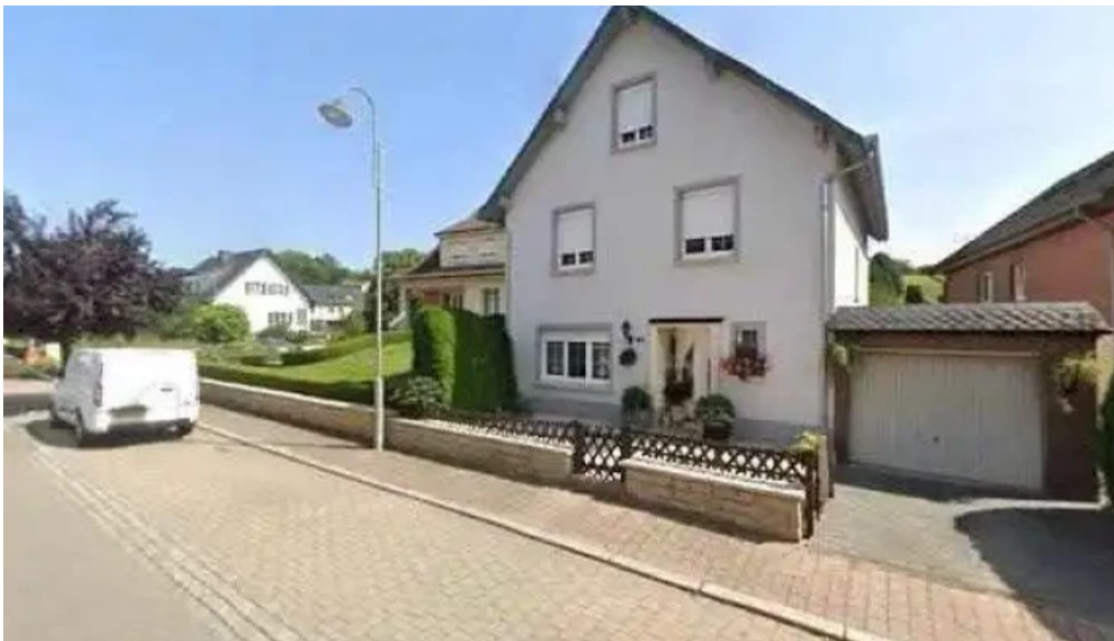
Cafe Barros street view 360deg fotos