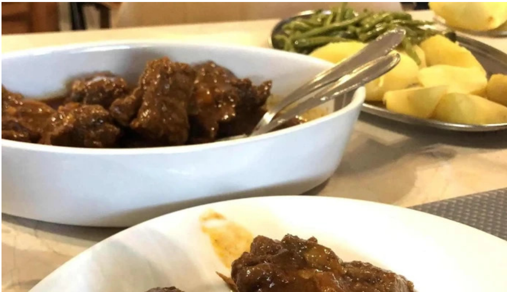
Cafe barros erpeldingen