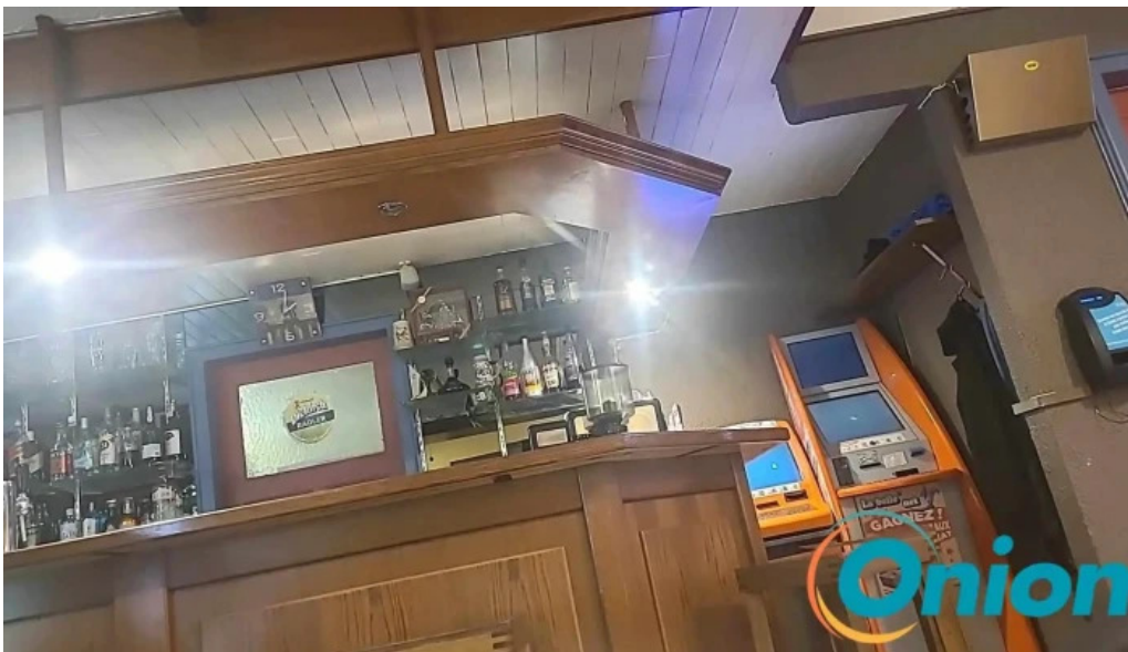
Cafe barros atmosphere