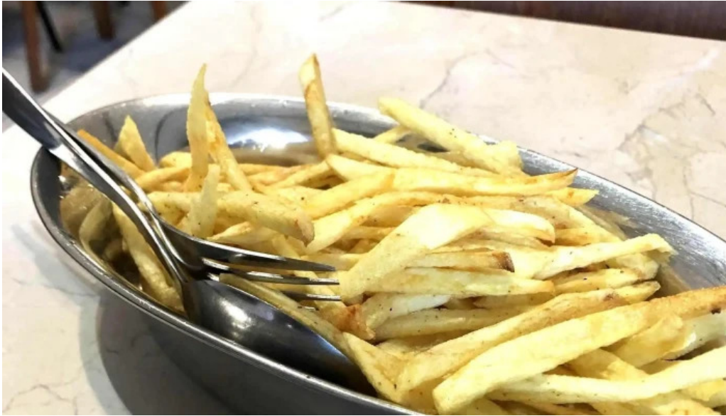
Cafe barros instagram