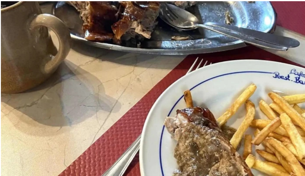
Cafe barros instagrame