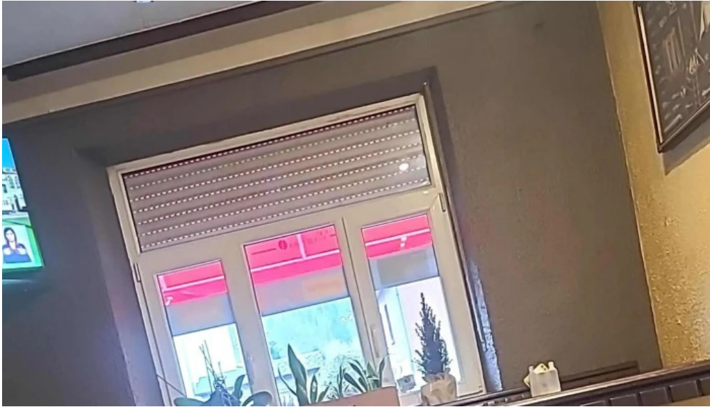
Cafe barros katalog