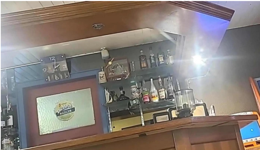
Cafe barros no bei mir