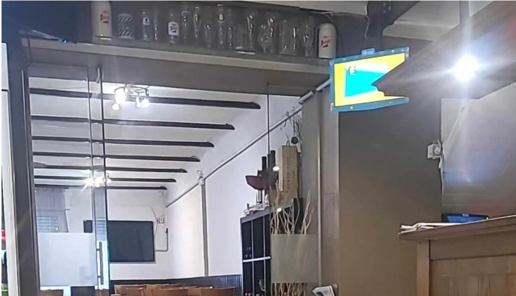
Cafe Barros address