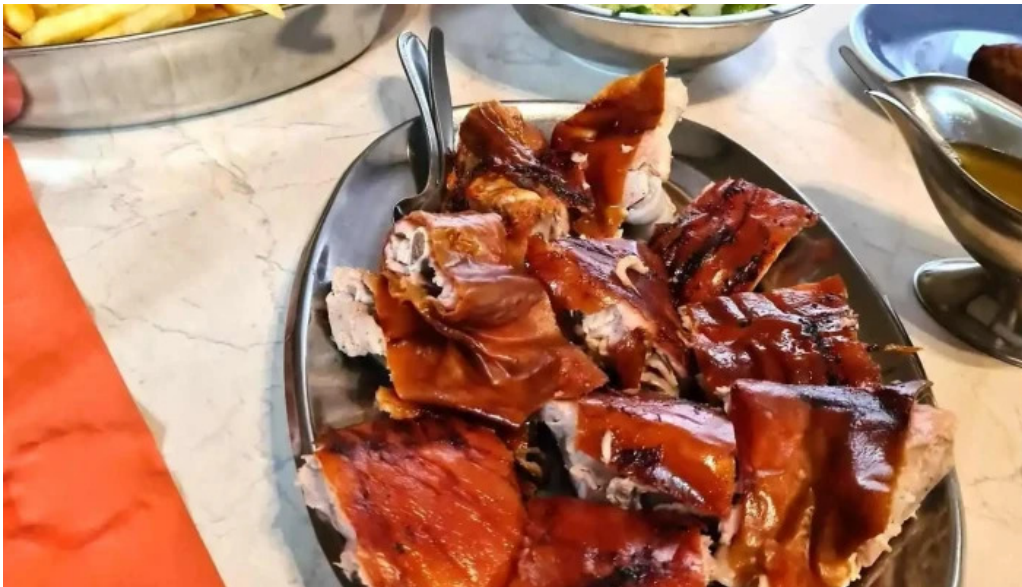
Cafe barros essen und trinken