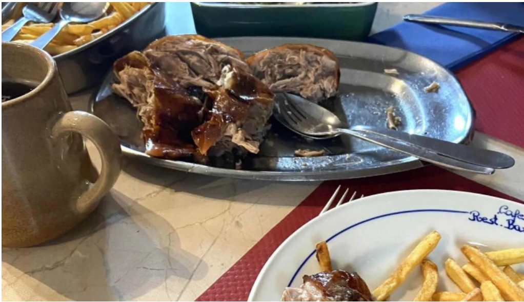
Cafe barros stonnenplang