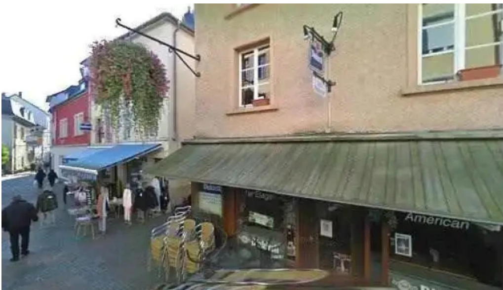
Patati patata diekirch street view 360deg fotos