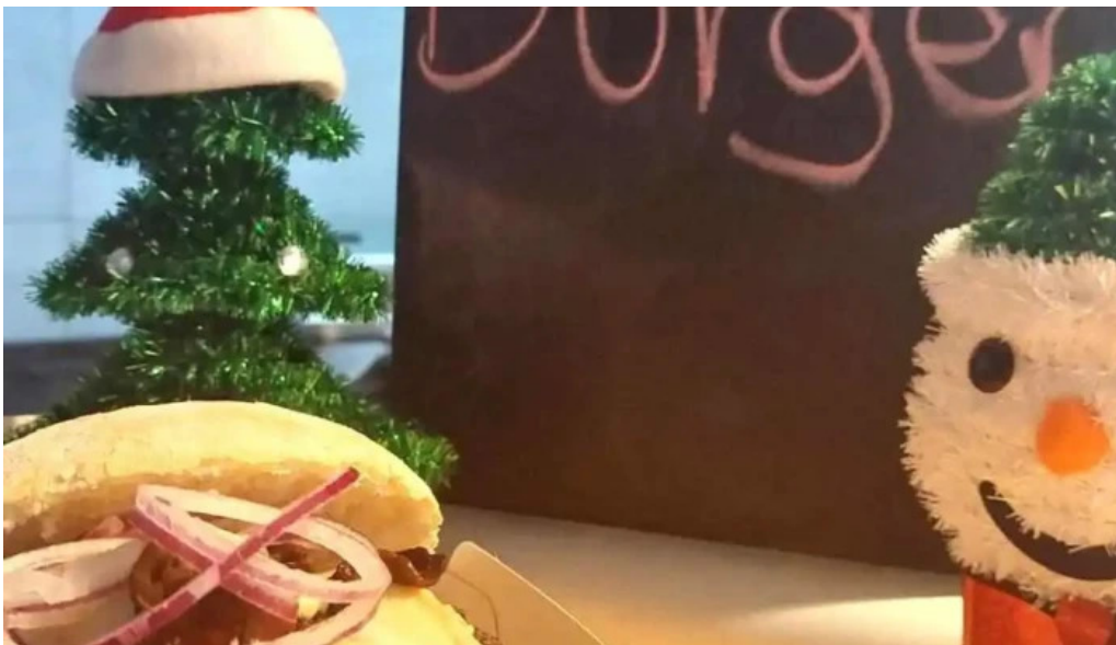
Patati patata diekirch neueste