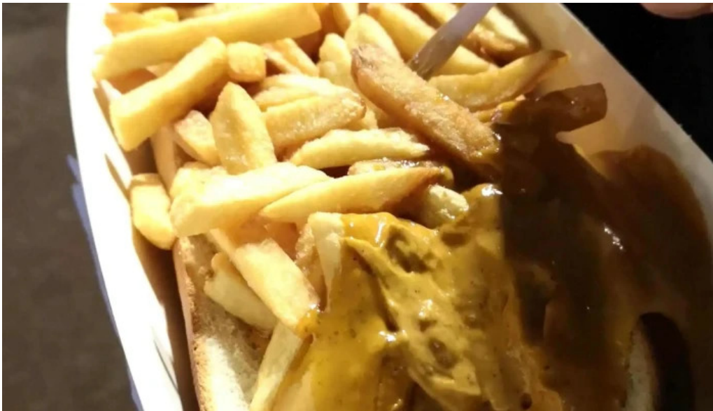
Patati patata diekirch instagram