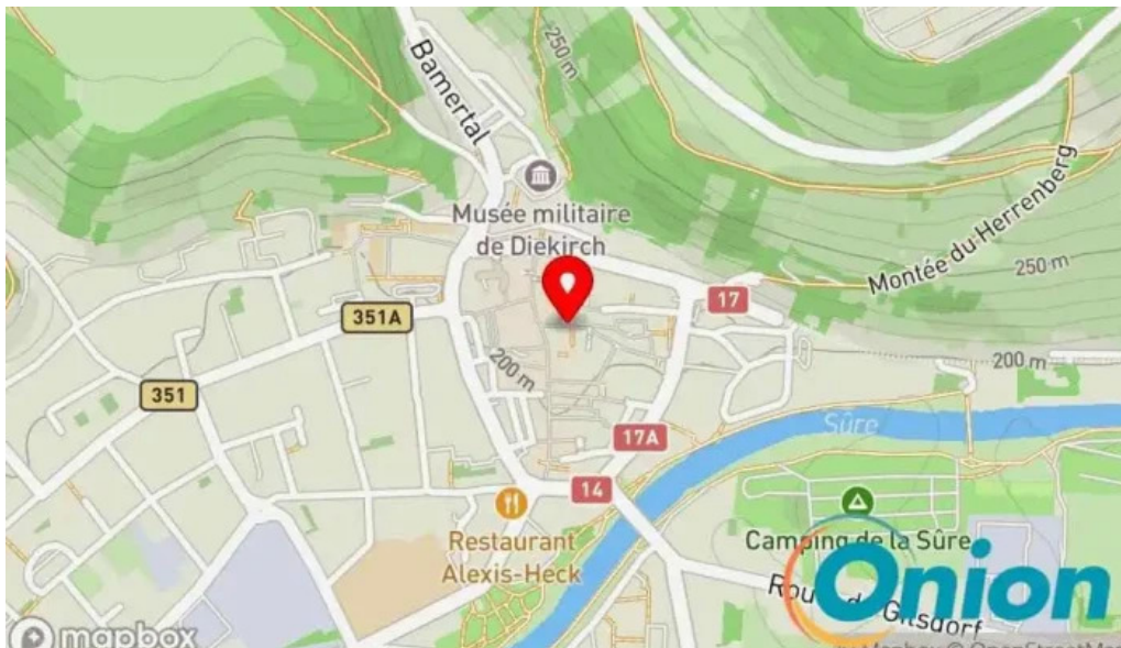
Patati patata diekirch Kaart