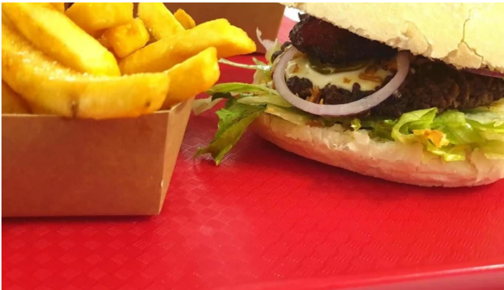
Patati patata diekirch videoen