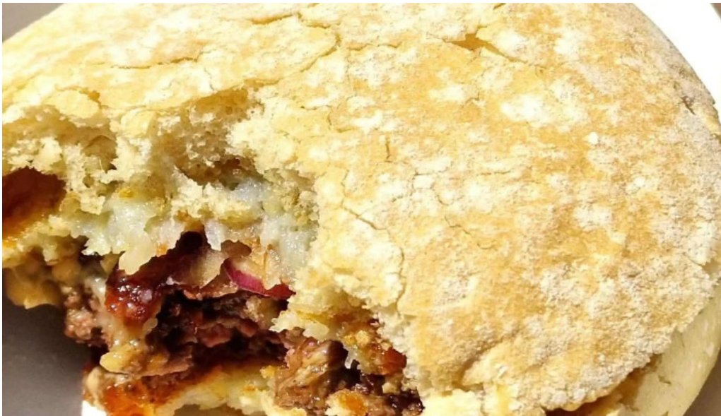
Patati patata diekirch bewaertungen