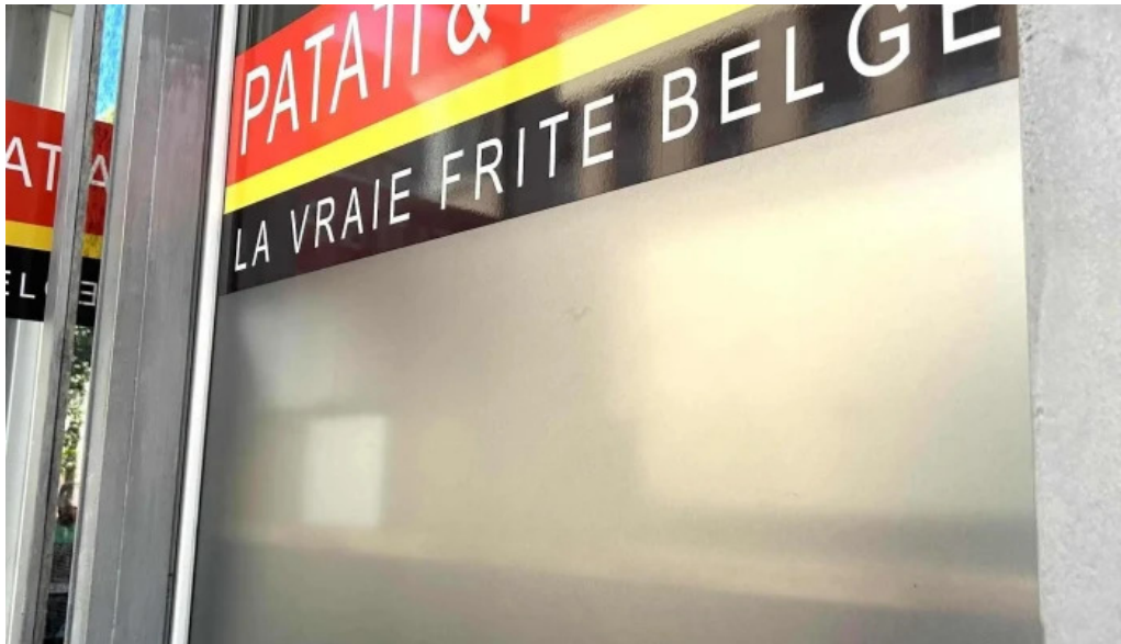
Patati patata diekirch diekirch