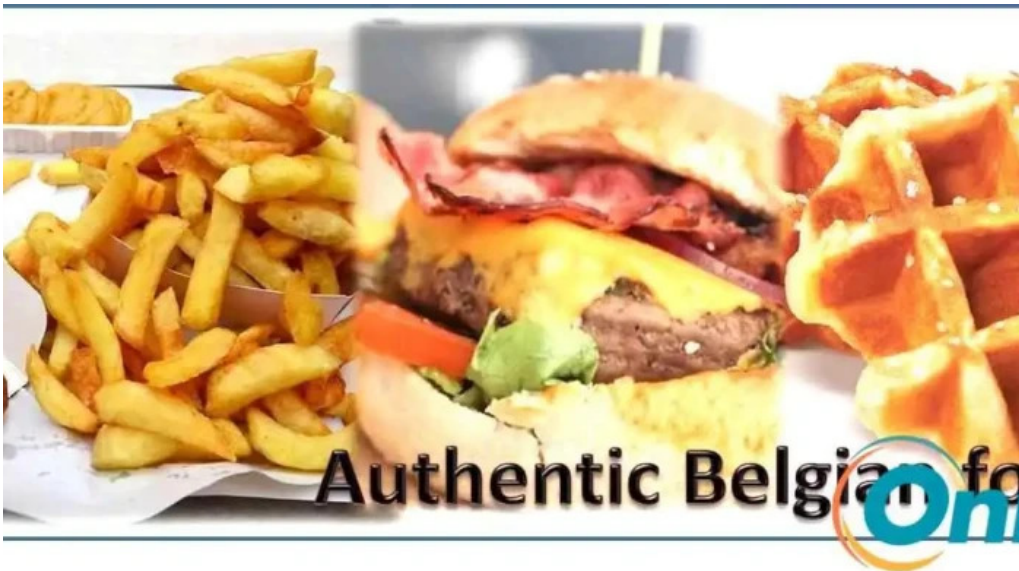
Patati patata diekirch essen und trinken