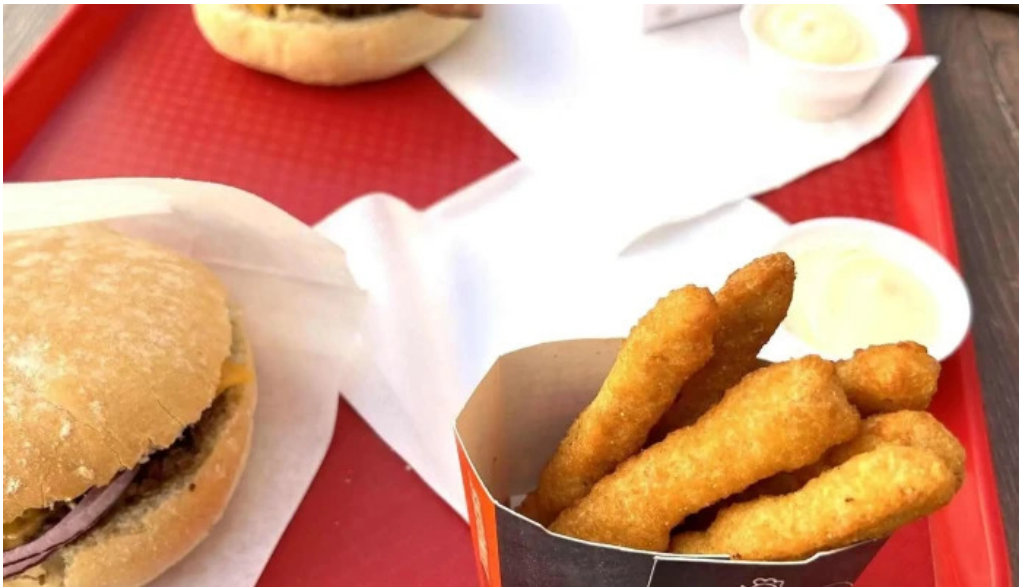
Patati patata diekirch remisen