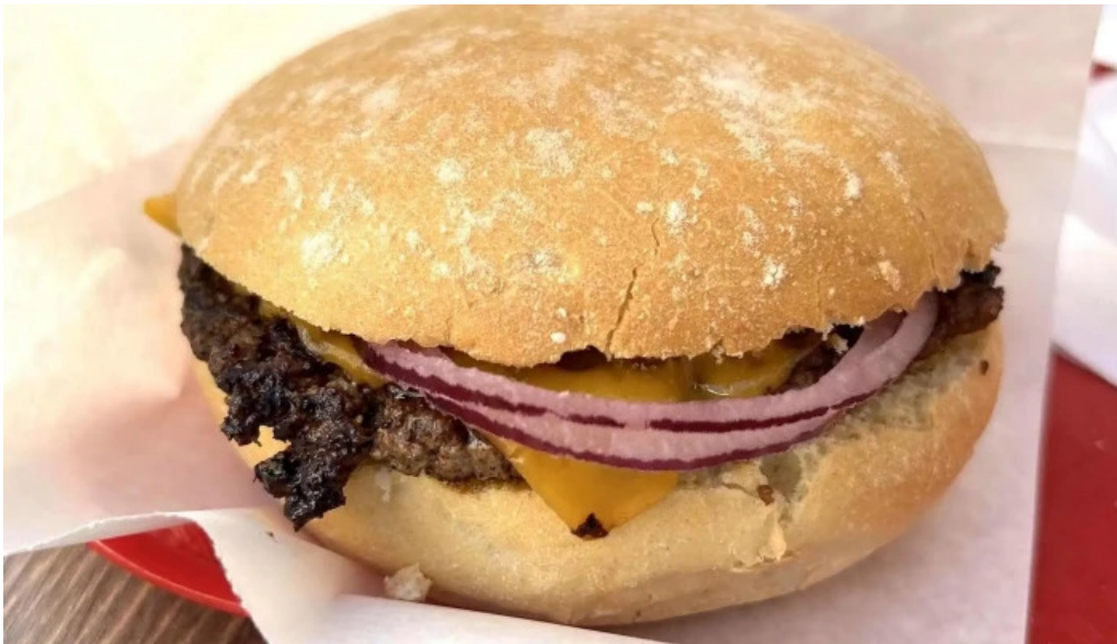
Patati patata diekirch no bei mir