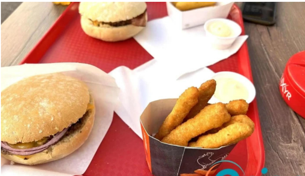
Patati patata diekirch pommes frites