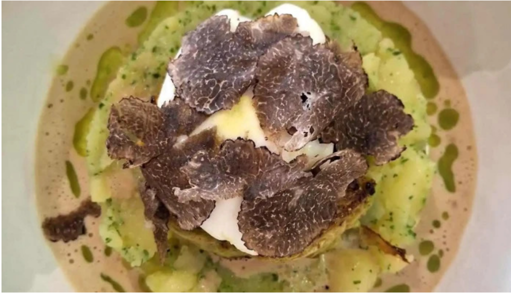
La grappe dor neueste