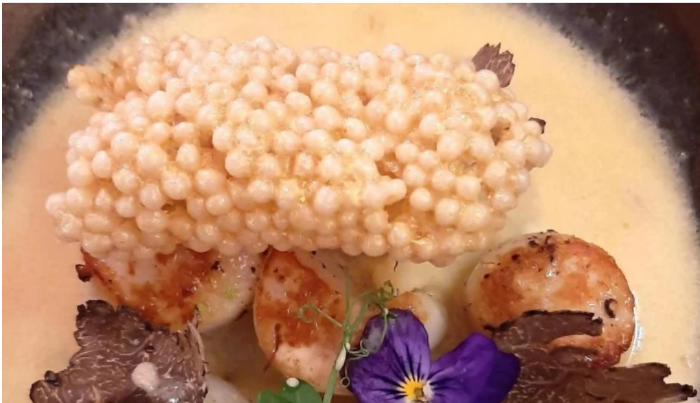
La grappe dor echter nach