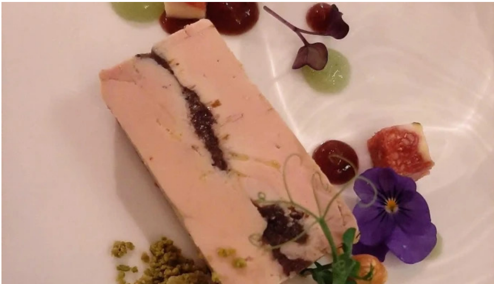
La grappe dor telefon