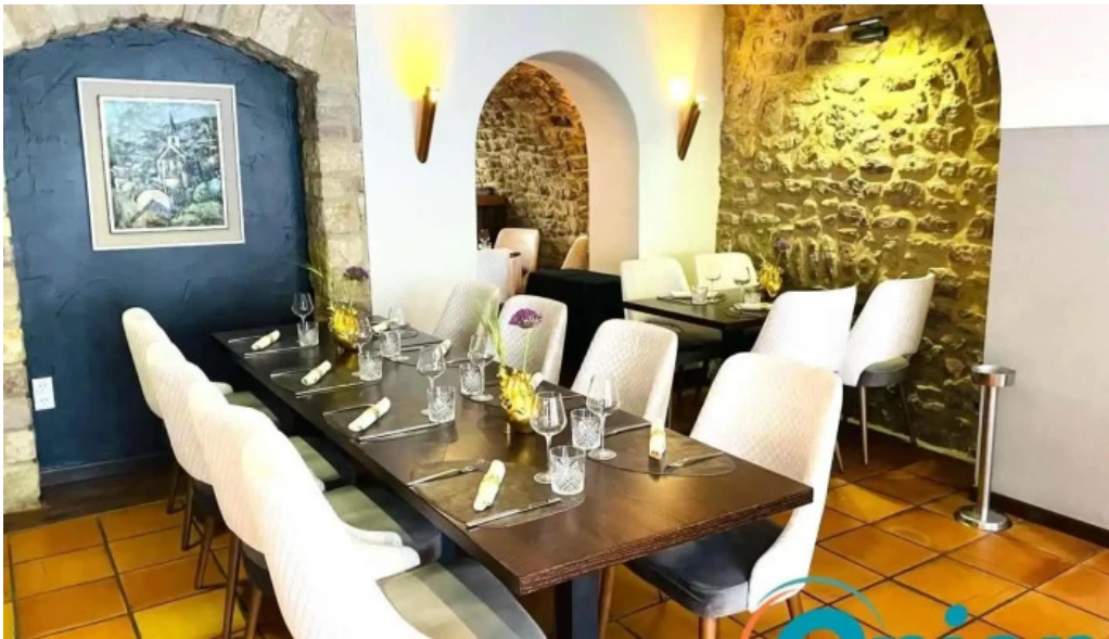
La grappe dor atmosphere