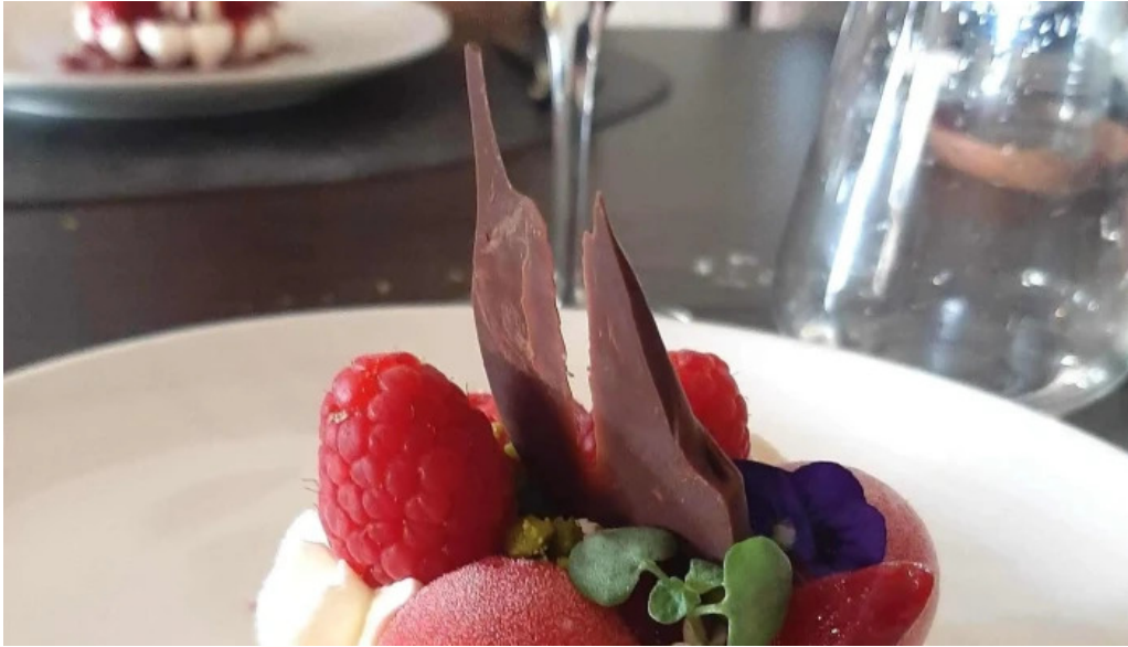
La grappe dor bewaertung