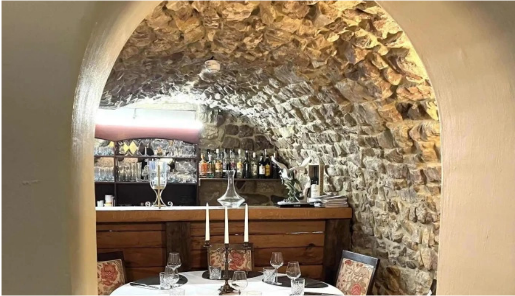
La grappe dor wei do ukommen