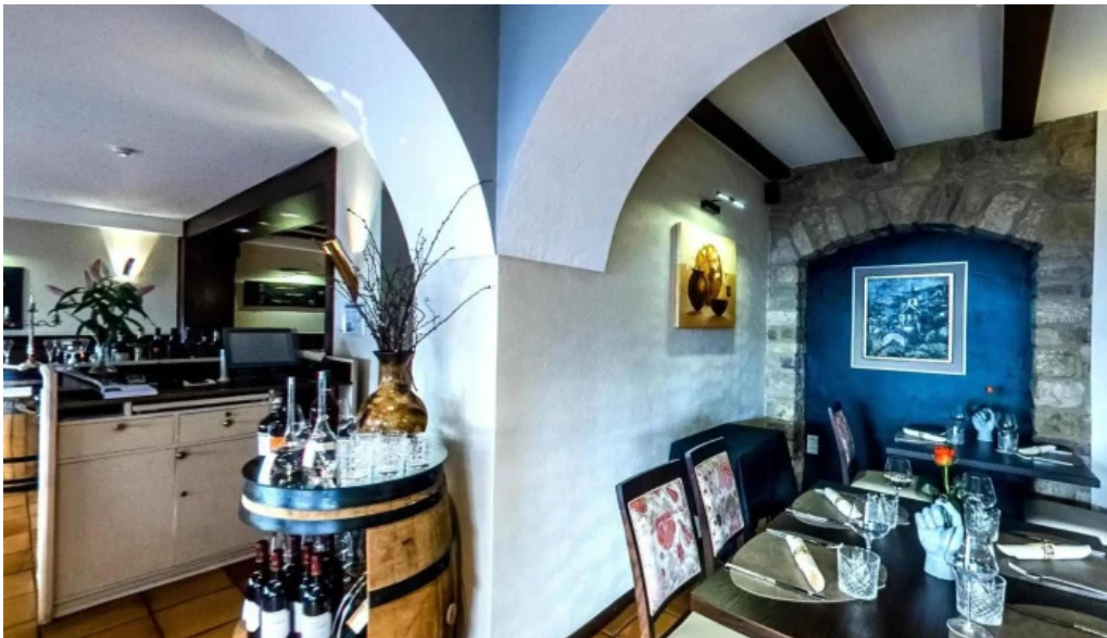
La grappe dor street view 360deg fotos