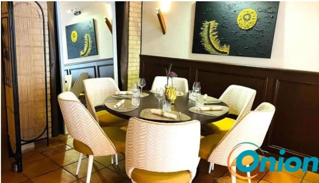
La grappe dor telefone