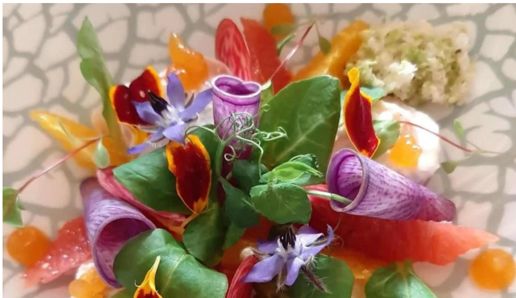
La grappe dor promotioun