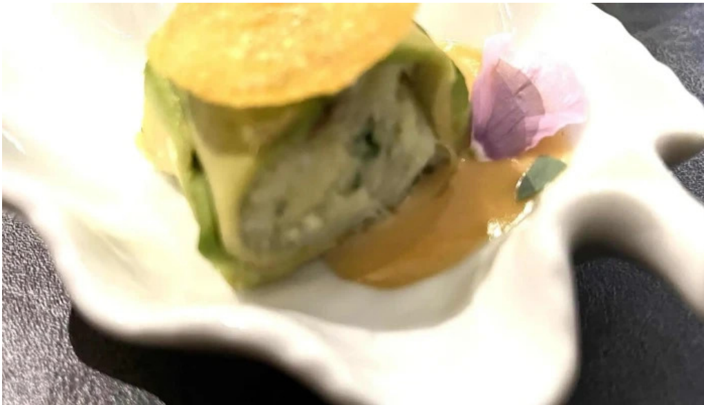
La grappe dor adress