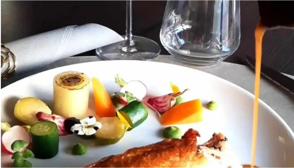
La grappe dor videos