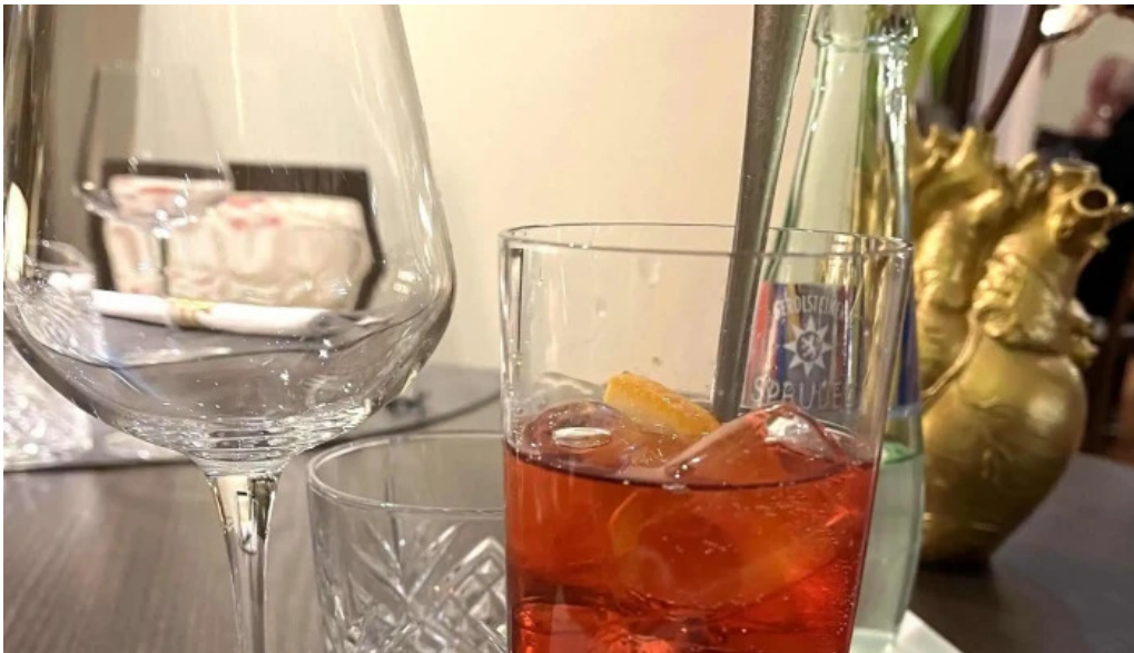
La grappe dor websait