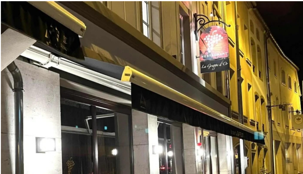
La grappe dor location