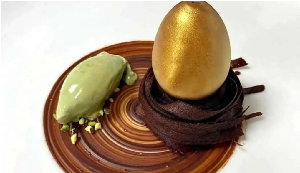
La grappe dor essen und trinken