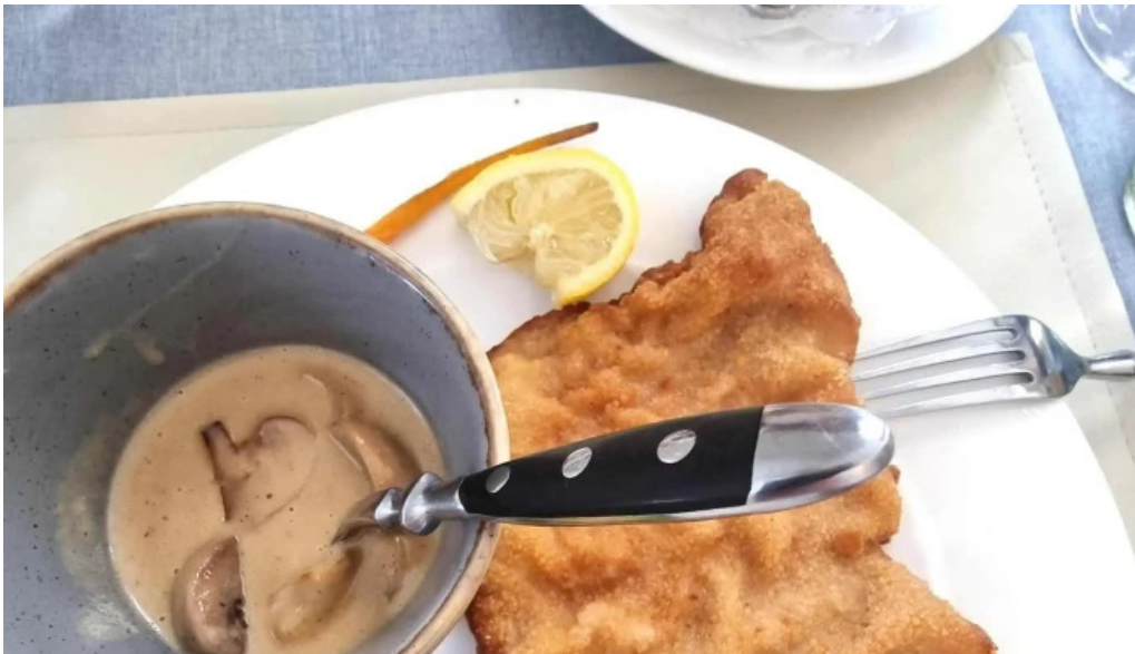
Beim charel instagram