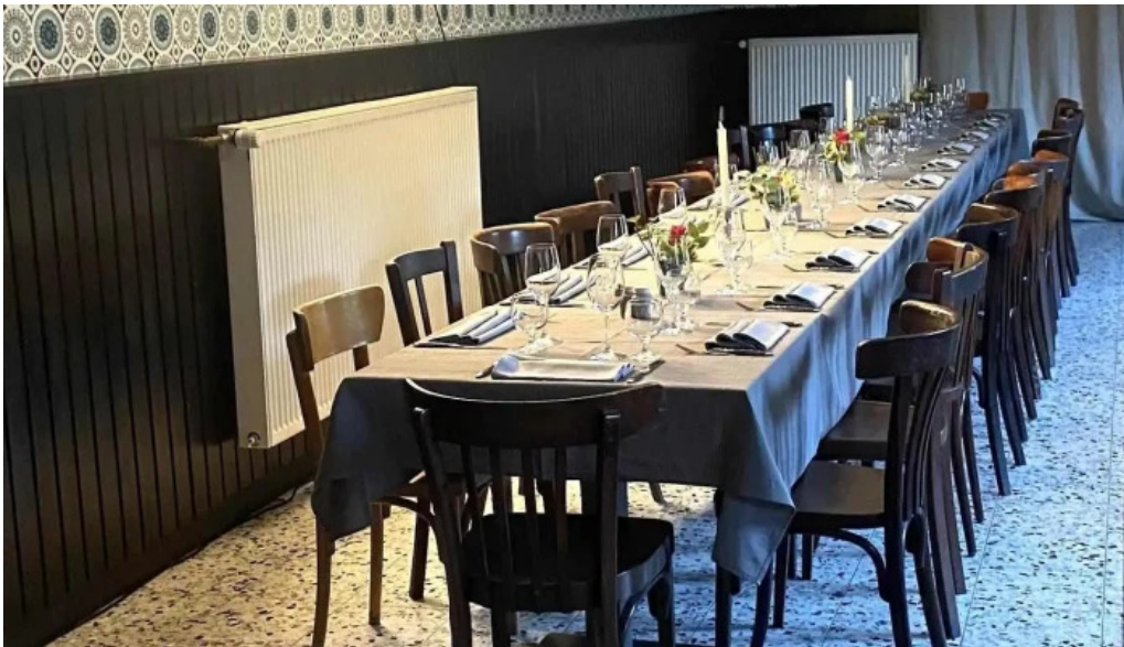
Beim charel atmosphere