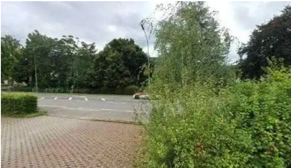
Beim charel street view 360deg fotos