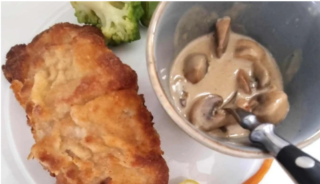
Beim charel erpeldingen