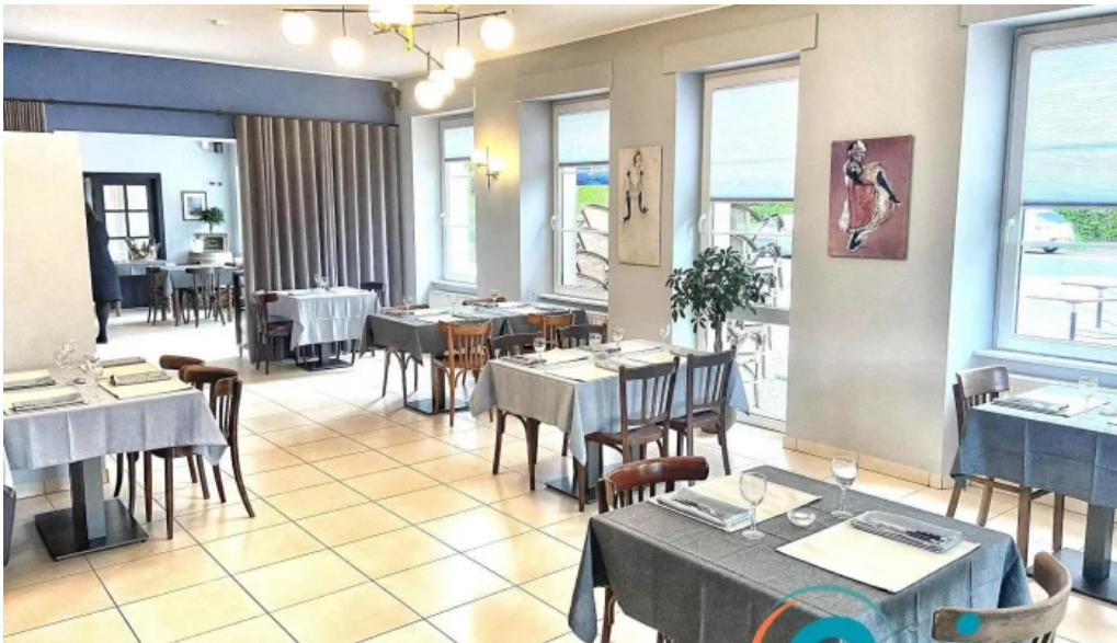
Beim charel instagrame