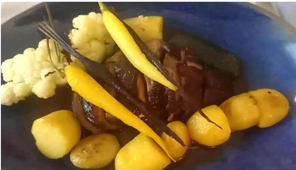
Beim charel wei do ukommen