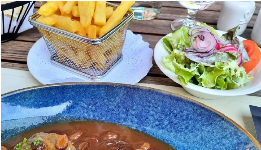
Beim charel kommentaren