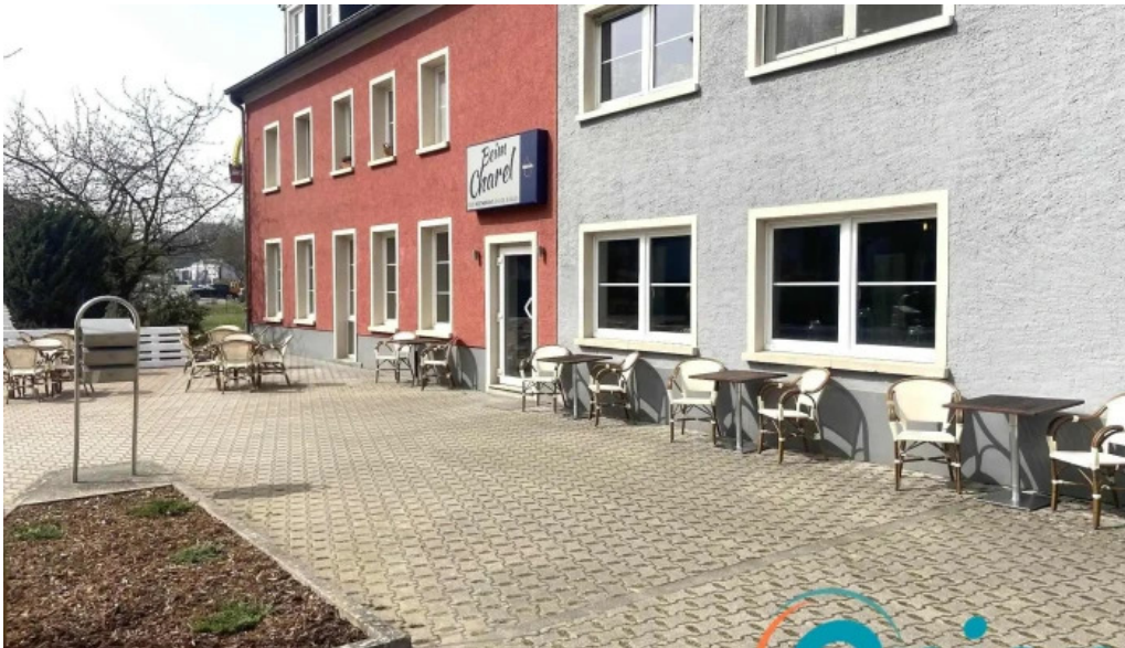
Beim charel vom inhaber