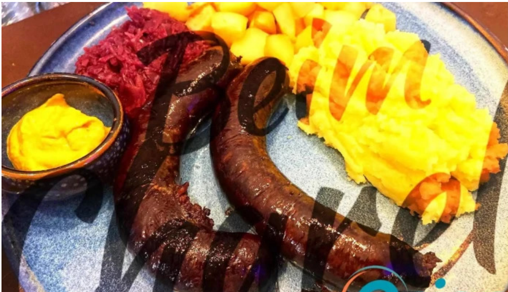
Beim charel essen und trinken