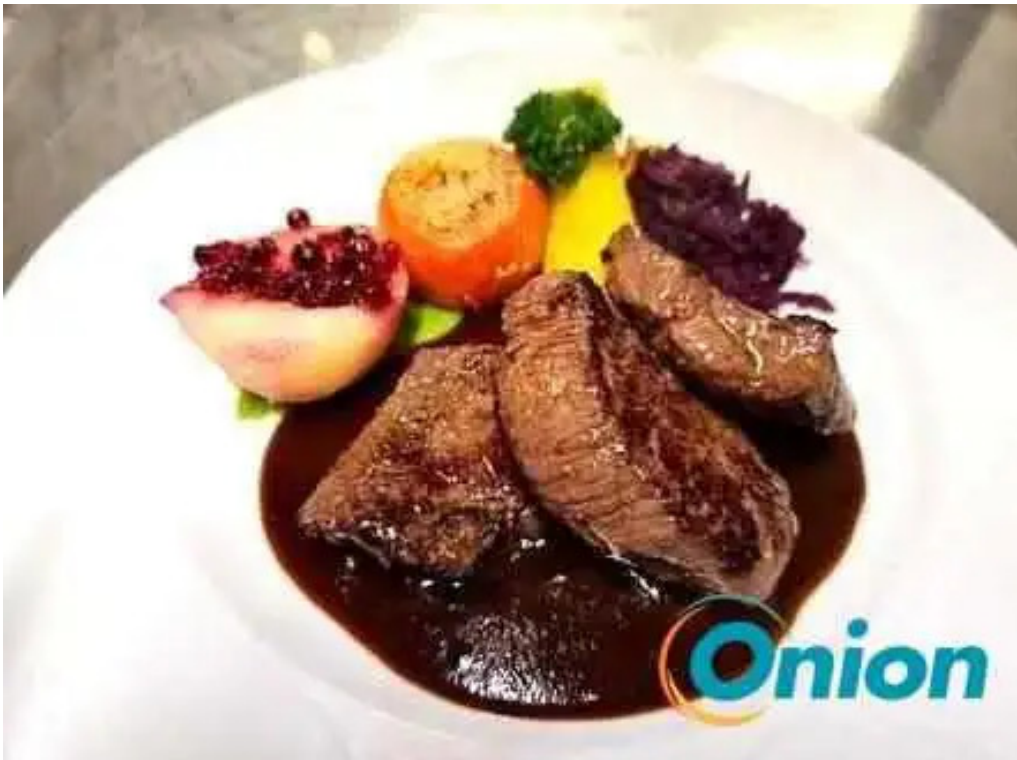
Beim troterbatti essen und trinken