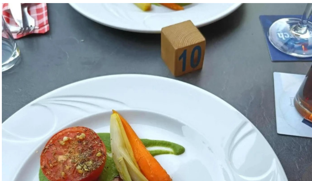
Beim troterbatti wou