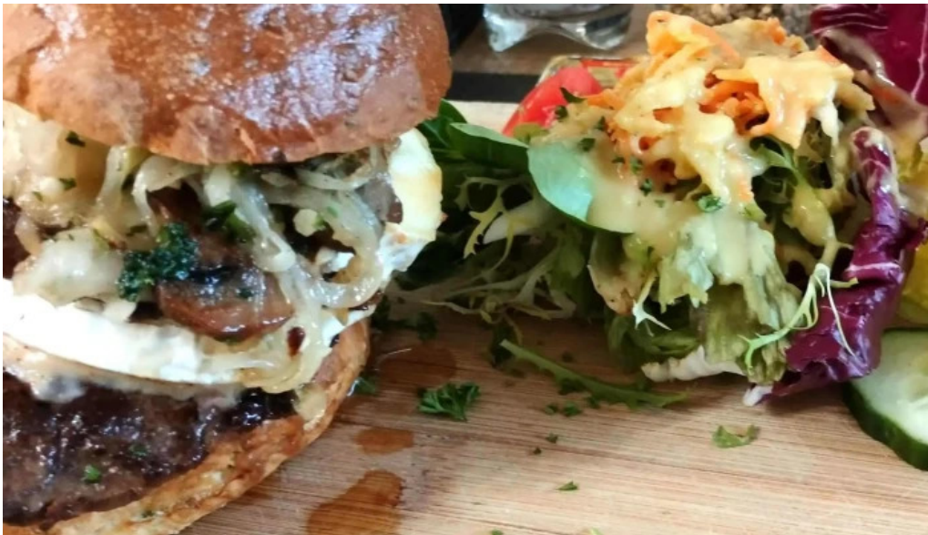
Beim troterbatti stonnenplang