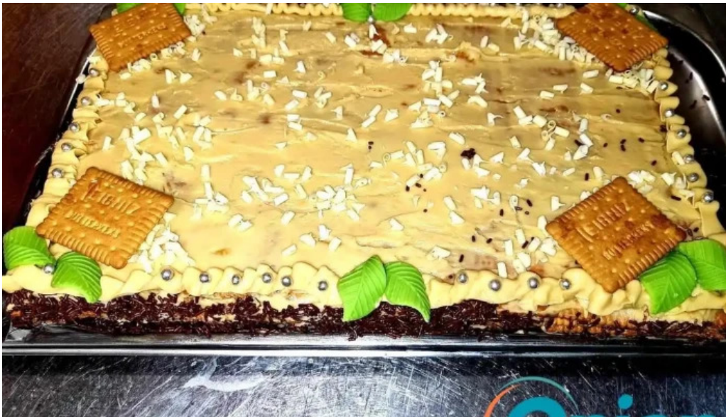
Beim troterbatti vom inhaber