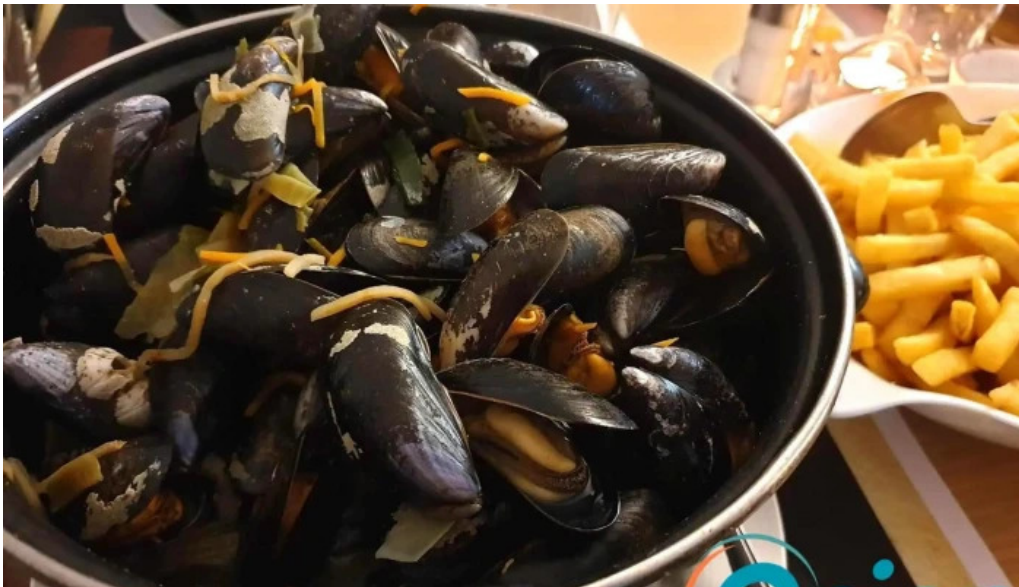
Beim troterbatti muscheln