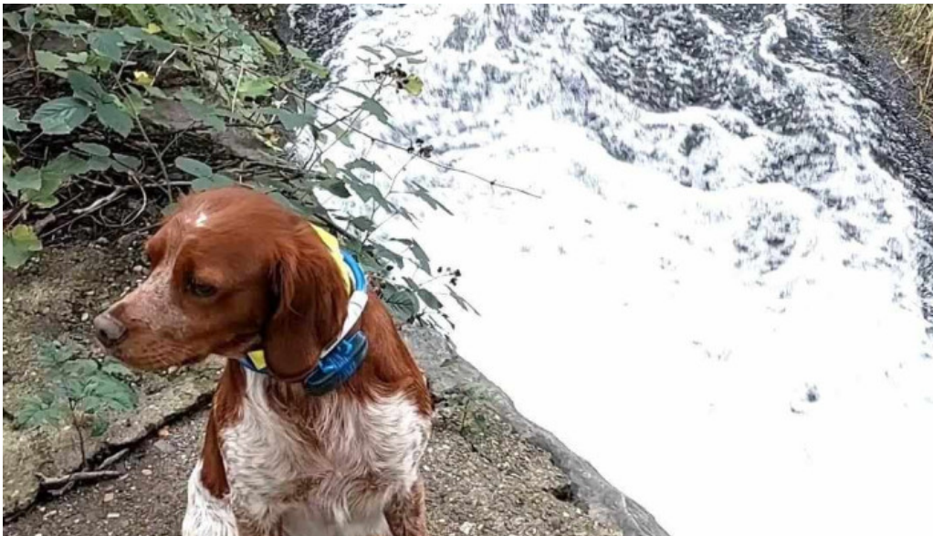
Beim troterbatti videos