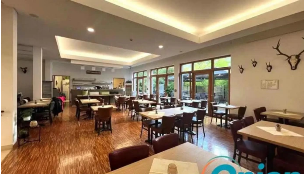
Beim troterbatti stonnenplange