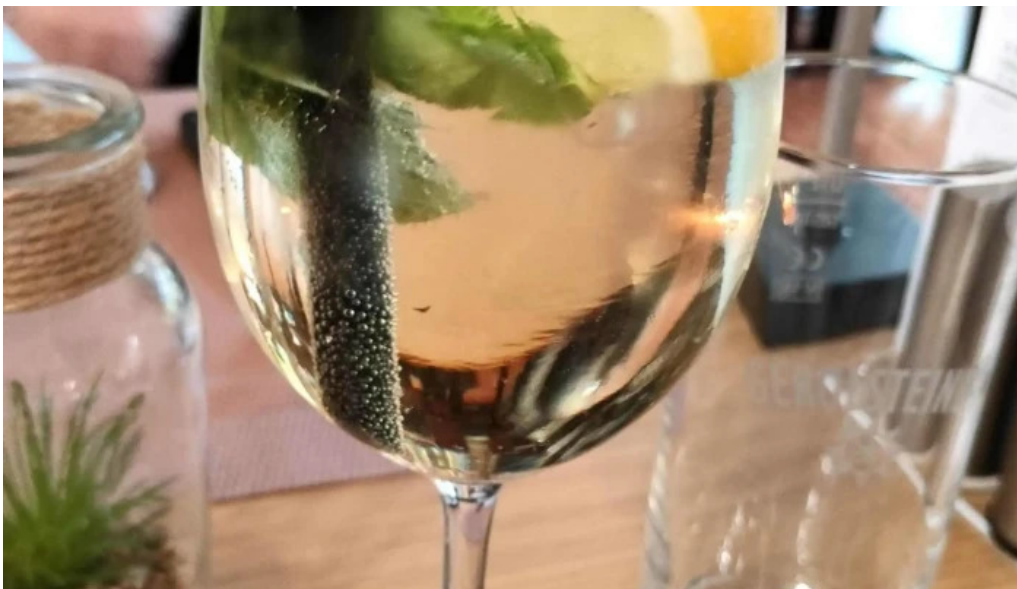
Beim troterbatti erpeldingen