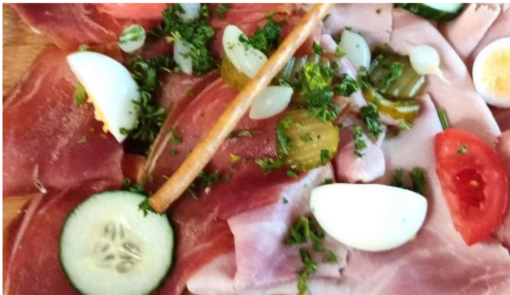
Beim troterbatti geigend