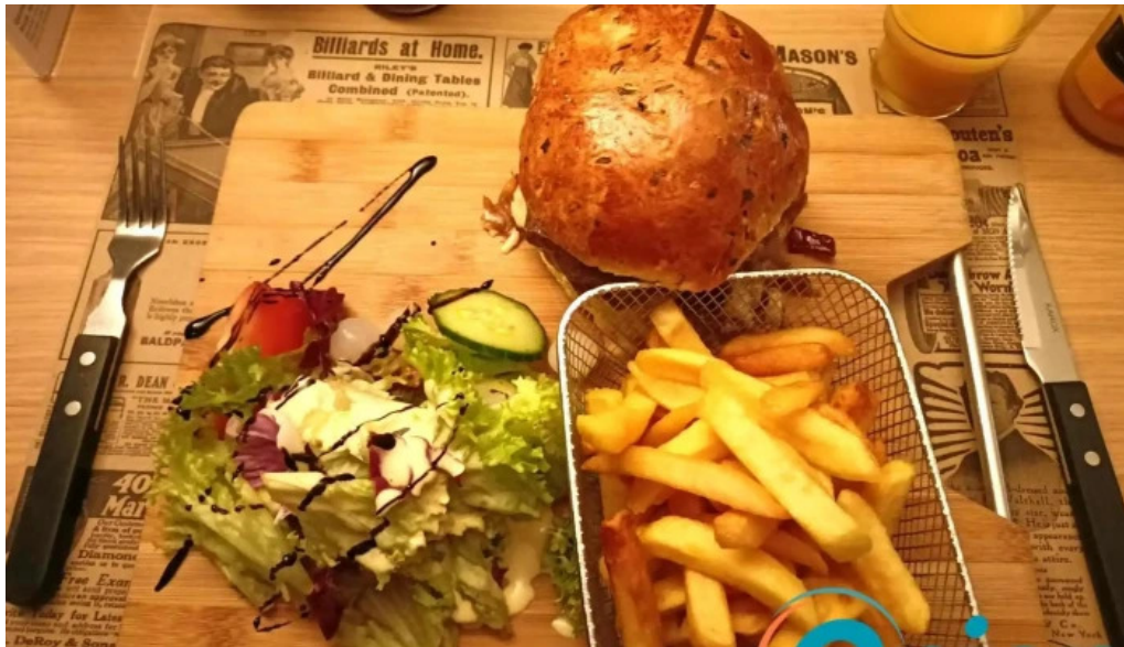
Beim troterbatti hamburger