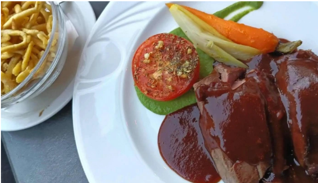
Beim troterbatti bewaertung