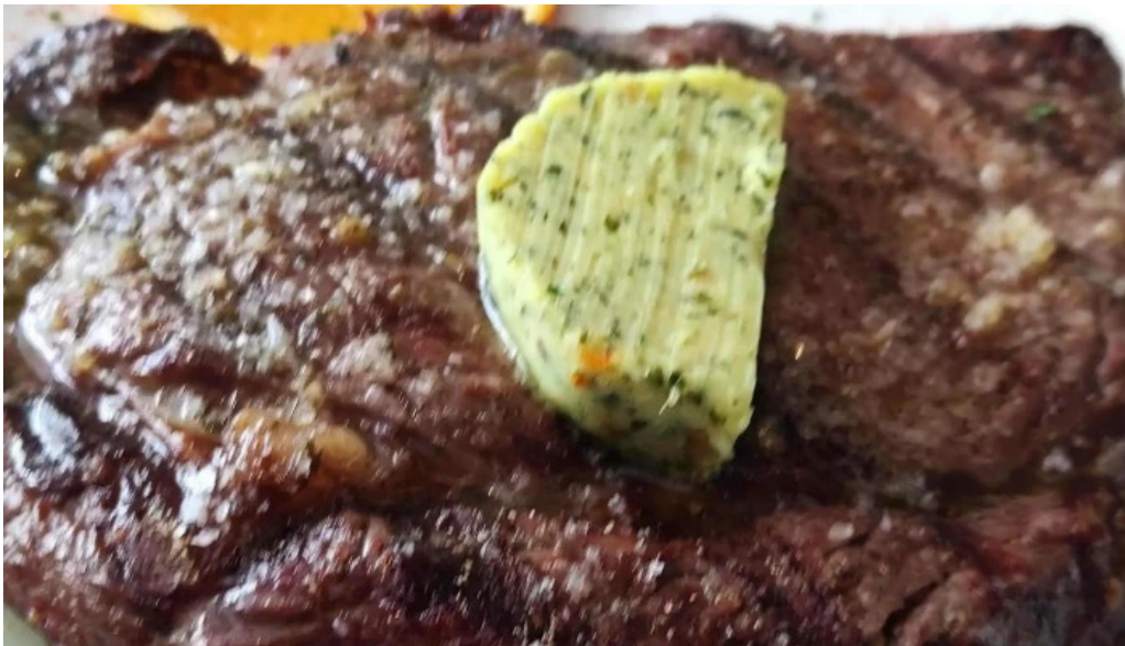
El brasero komentaren