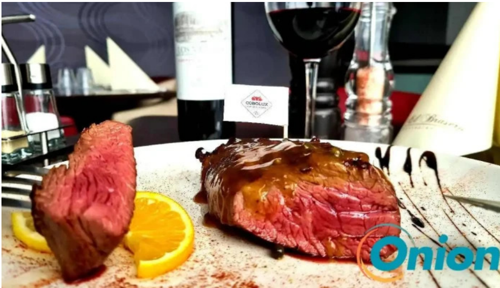
El brasero essen und trinken