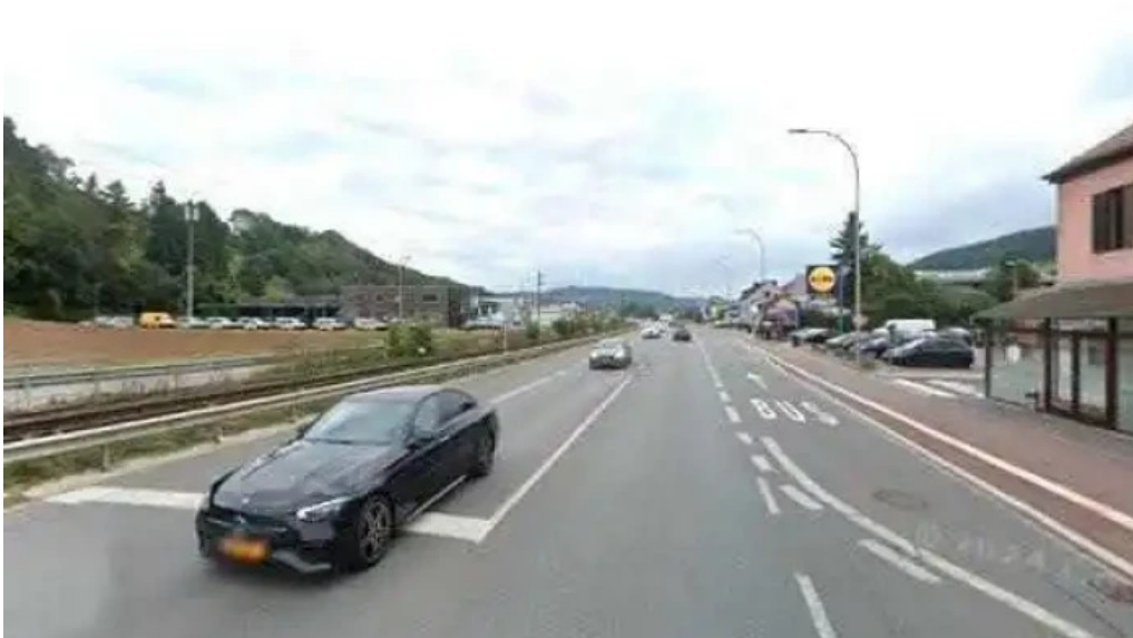
El brasero street view 360deg fotos