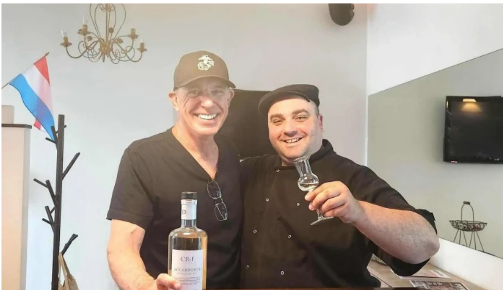
El brasero telefon