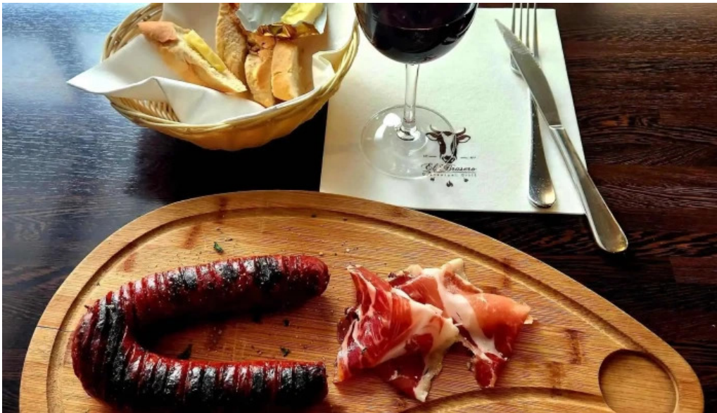
El brasero bewaertung