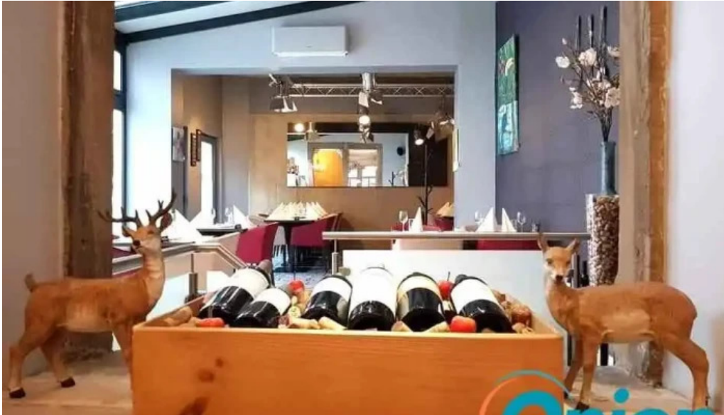
El brasero bewaertunge