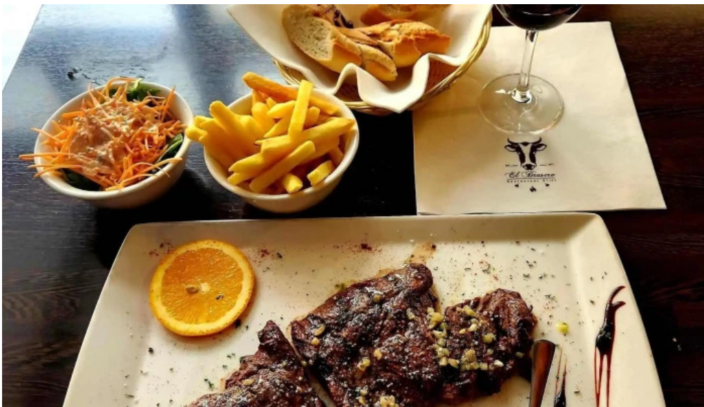
El brasero erpeldingen