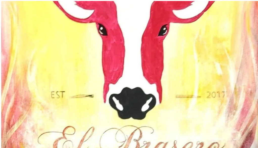
El brasero remisen