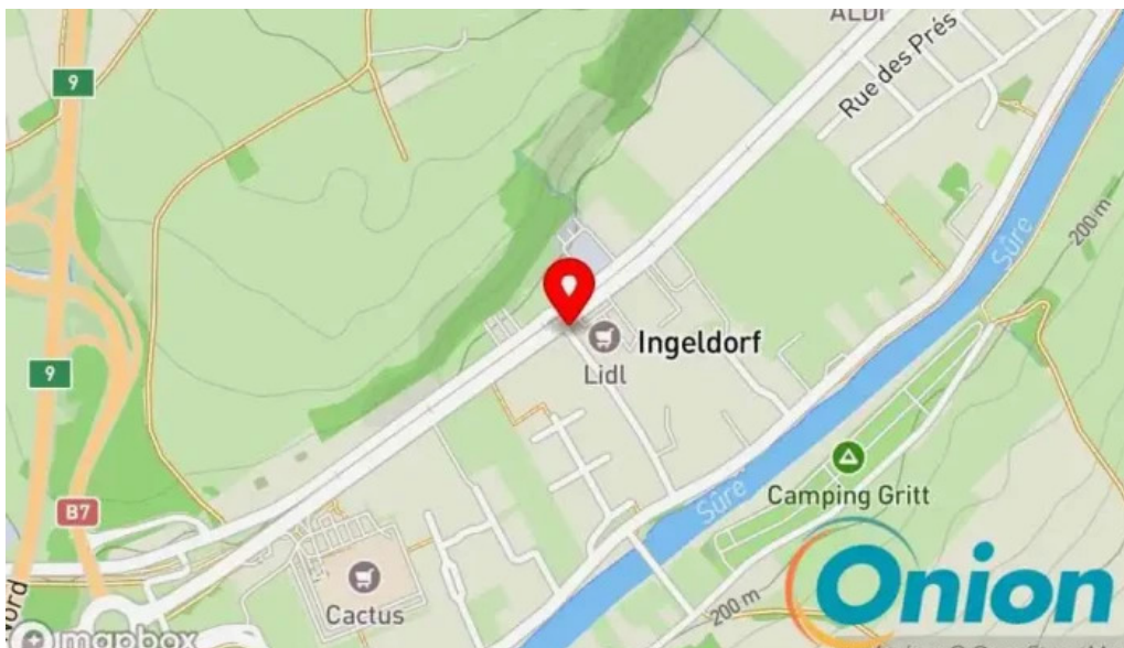
El brasero Kaart