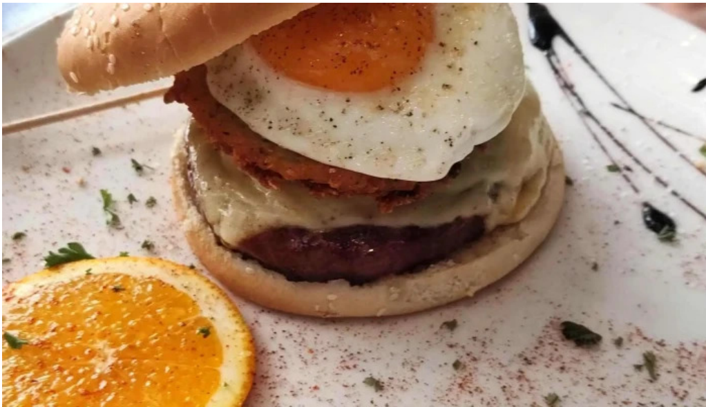
El brasero instagram