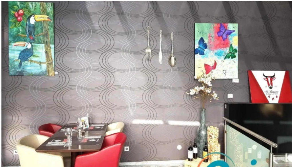
El brasero atmosphere