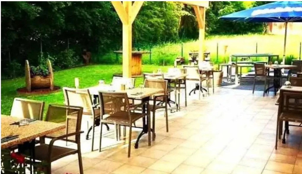
Bricher stuf adresse