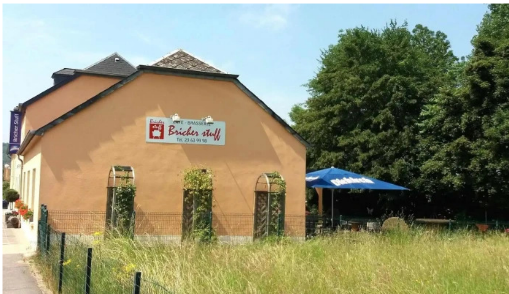
Bricher stuff wei do ukommen