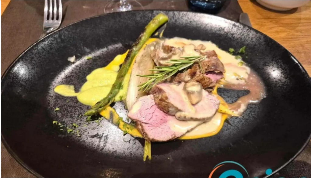
Bricher stuff neueste