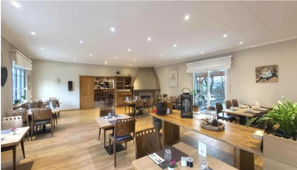
Bricher stuf atmosphere