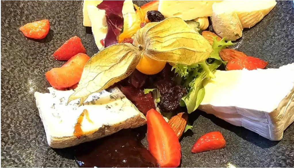
Bricher stoff helperknapp