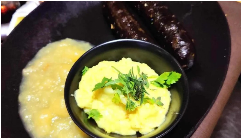
Bricher stoff essen und trinken