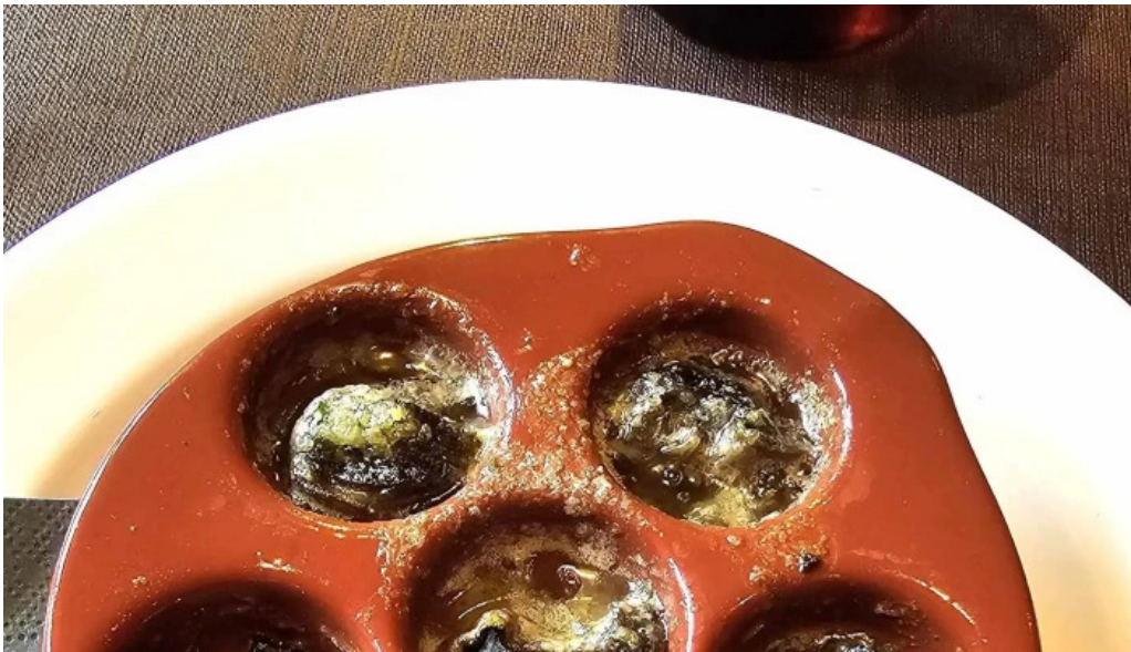
Bricher stuff katalog