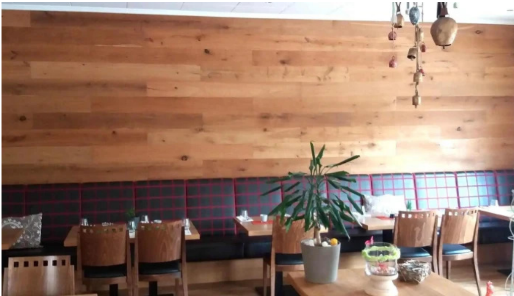
Bricher stuff bewaertungen