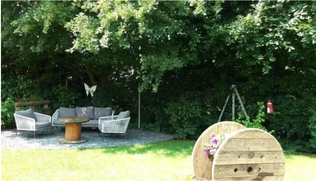
Bricher stuff elo op