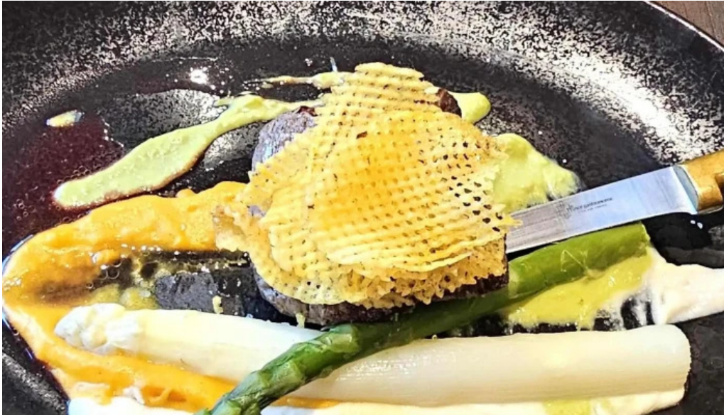
Bricher stuff adress