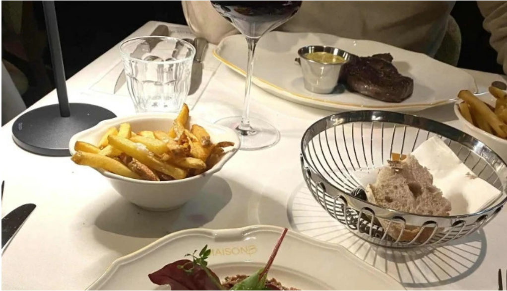
Maison b wou