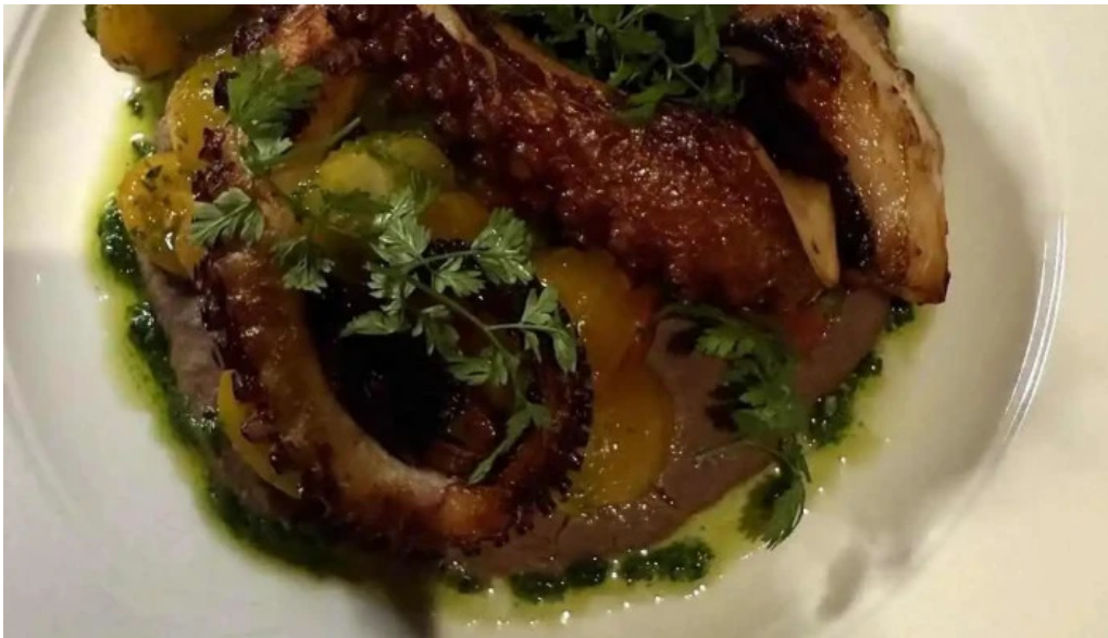
Maison b neueste