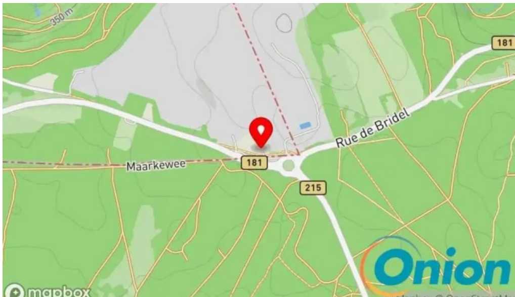
Maison b Kaart