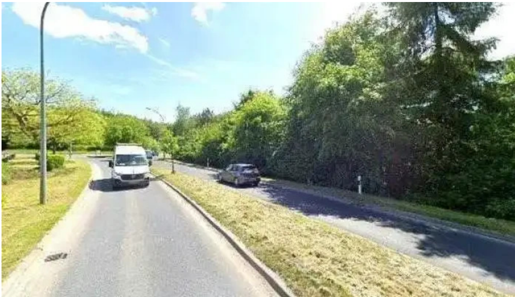
Maison b street view 360deg fotos