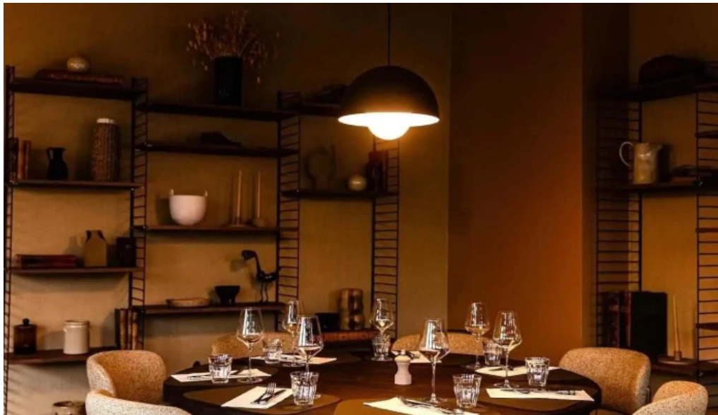
Maison b atmosphere