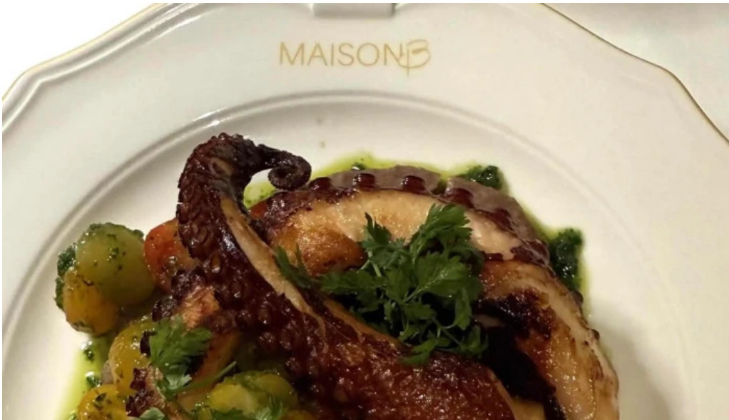
Maison b websait