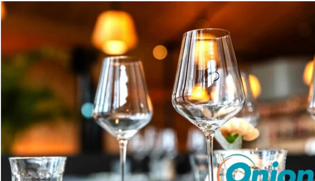
Maison b essen und trinken