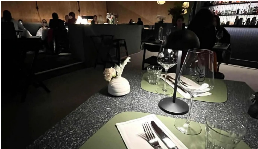
Maison b bewaertungen