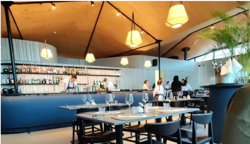
Maison b katalog