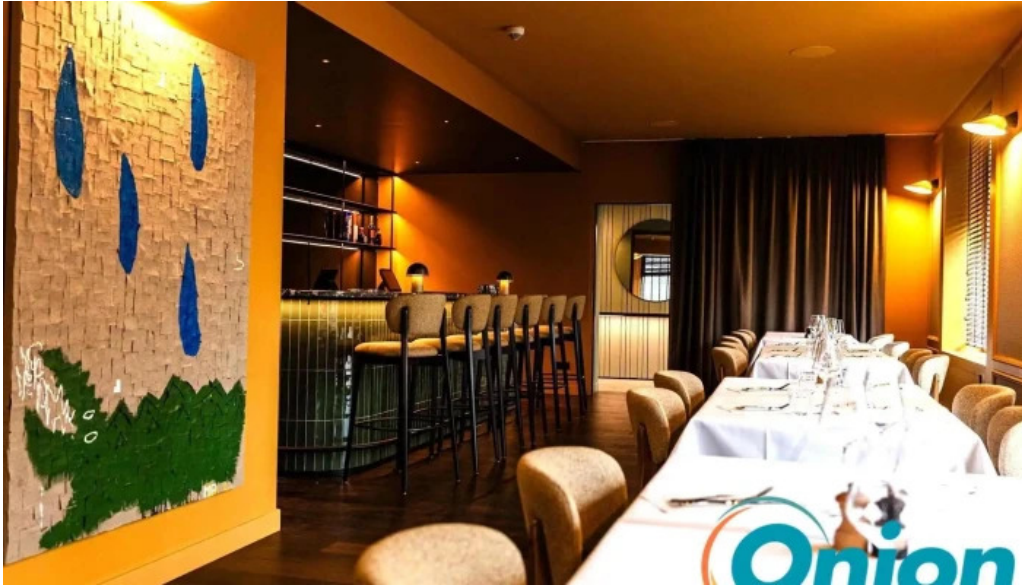
Maison b kataloge