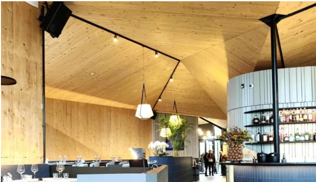
Maison b kopstal