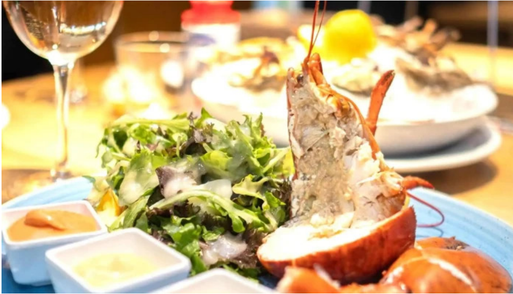
Brasserie des jardins vom inhaber