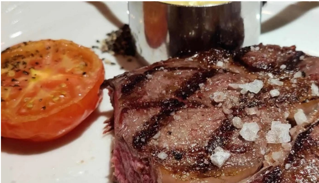
Brasserie des jardins kommentaren