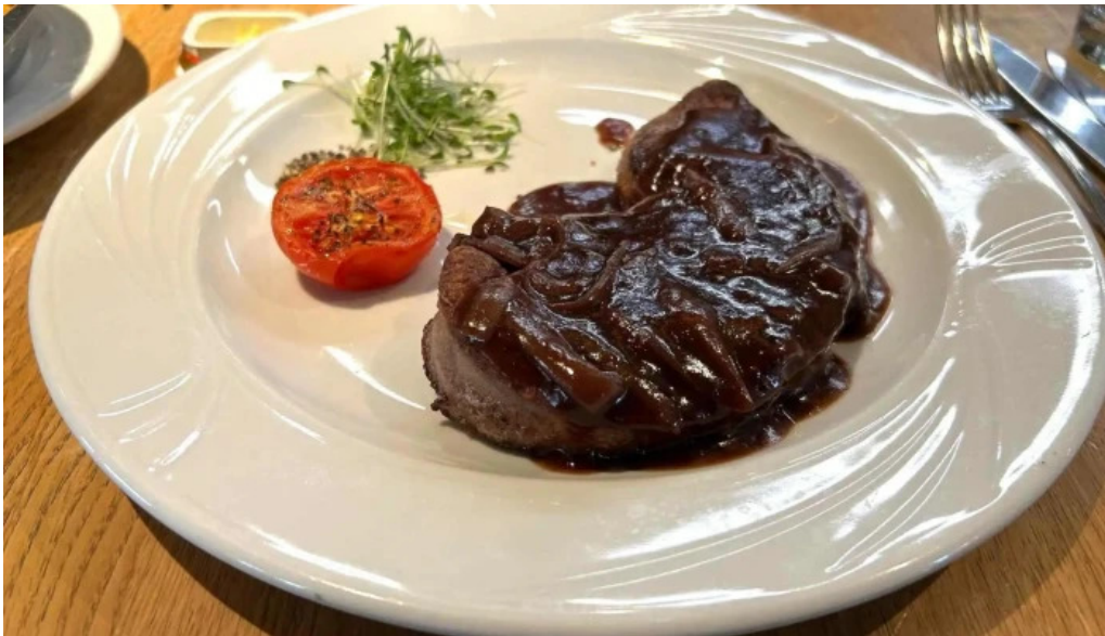
Brasserie des jardins luxemburg