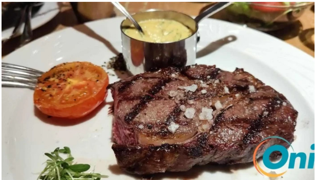
Brasserie des jardins rib eye steak