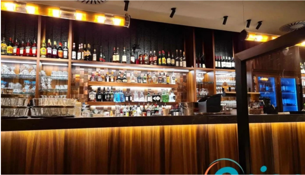
Brasserie des jardins atmosphere