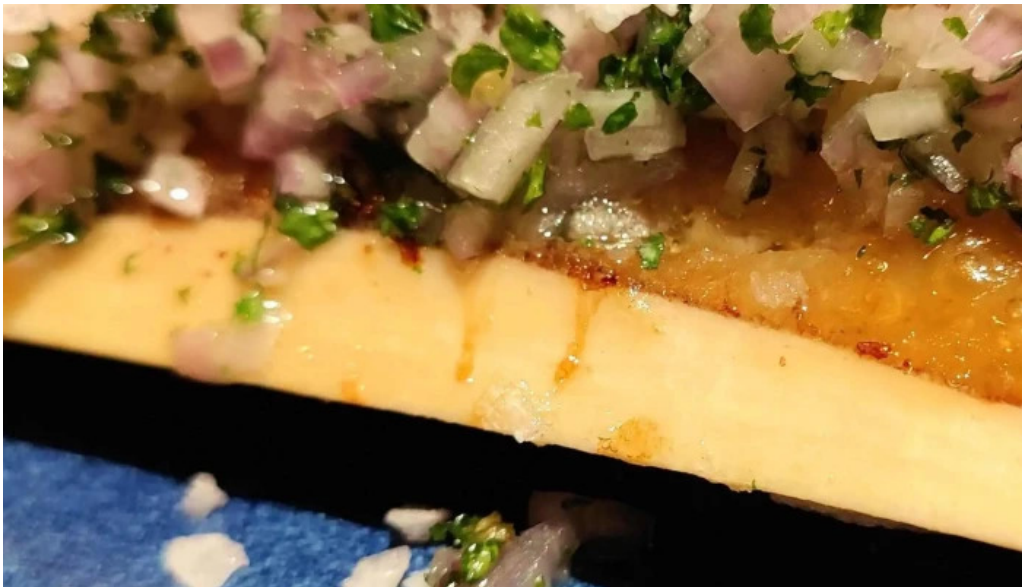
Brasserie des jardins elo op