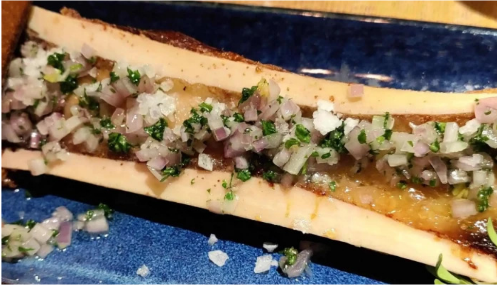
Brasserie des jardins nummer