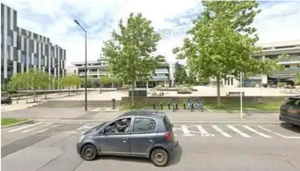
Brasserie des jardins street view 360deg fotos