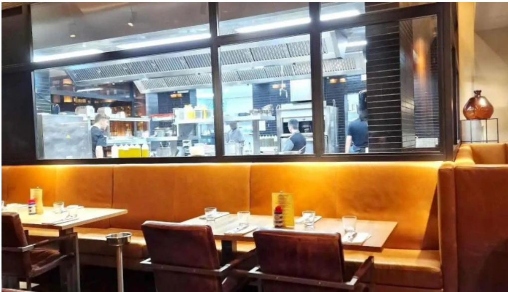
Brasserie des jardins bewaertung