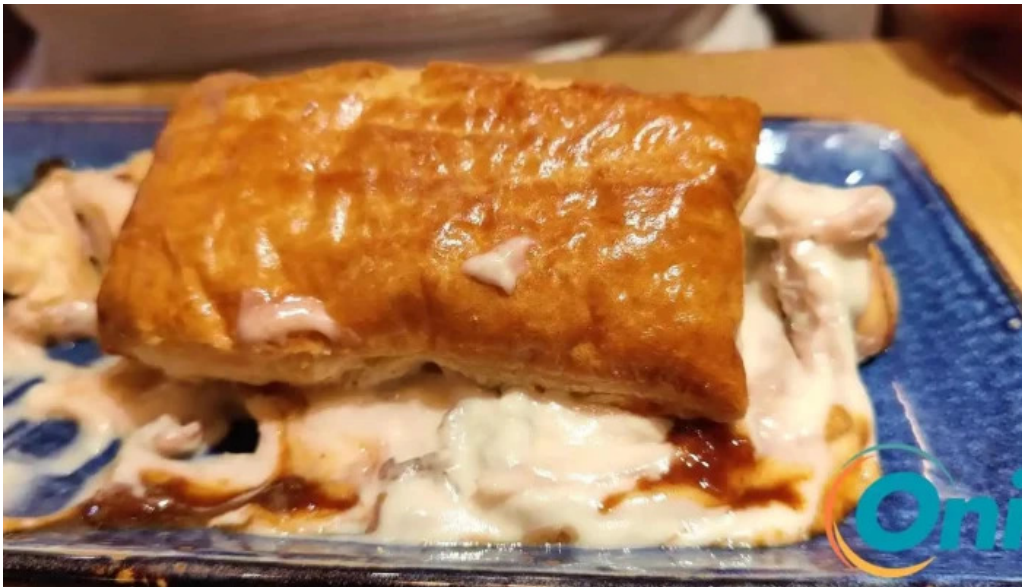
Brasserie des jardins neueste