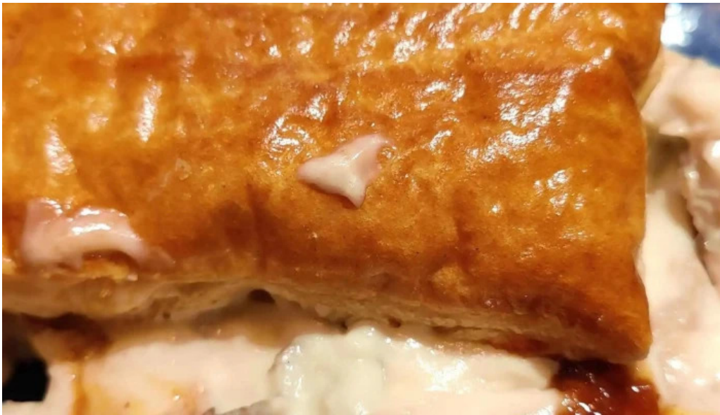
Brasserie des jardins adress