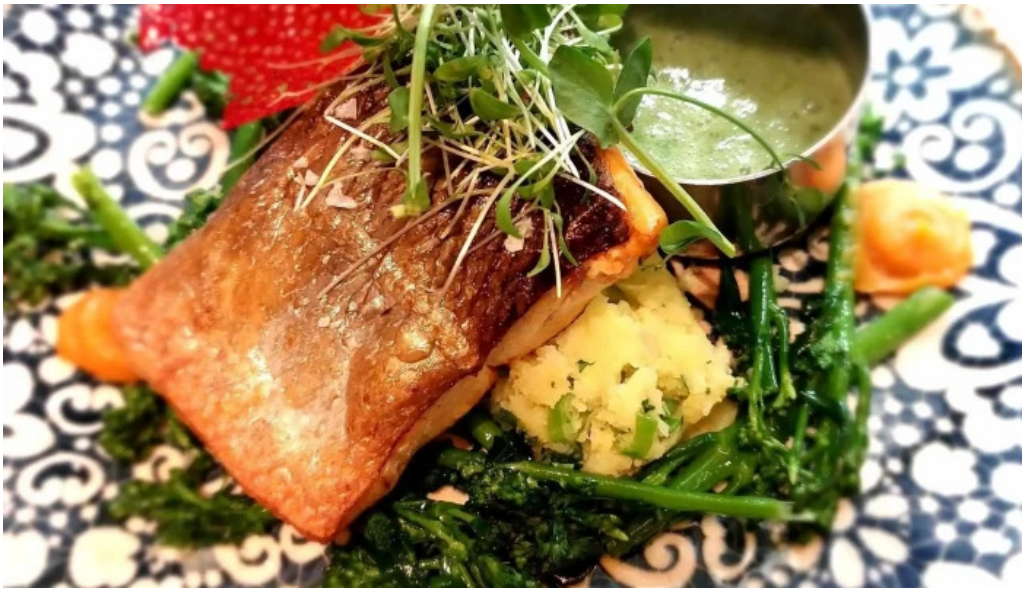
Brasserie des jardins essen und trinken