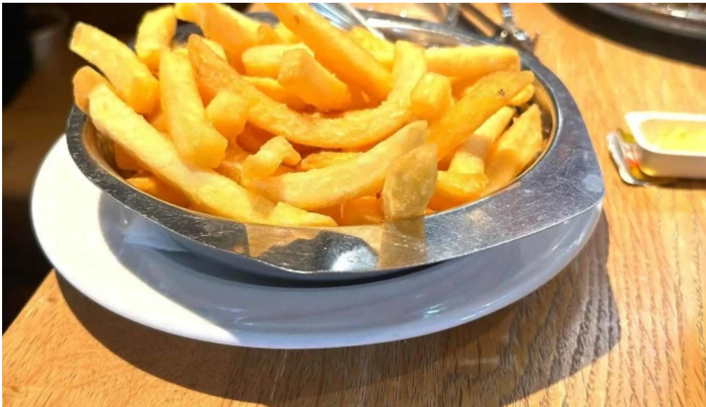
Brasserie des jardins bewaertung