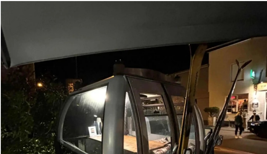
Um haeffchen beringen kommentaren