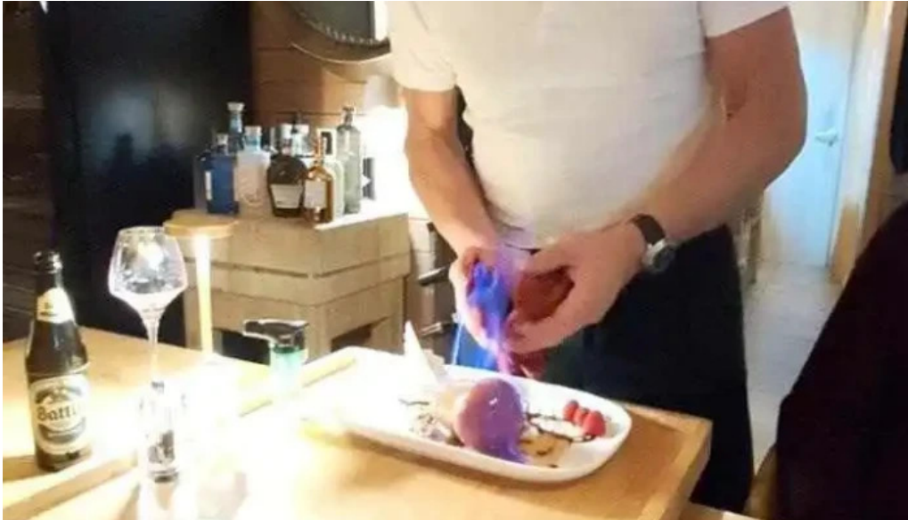
Um haeffchen beringen videos