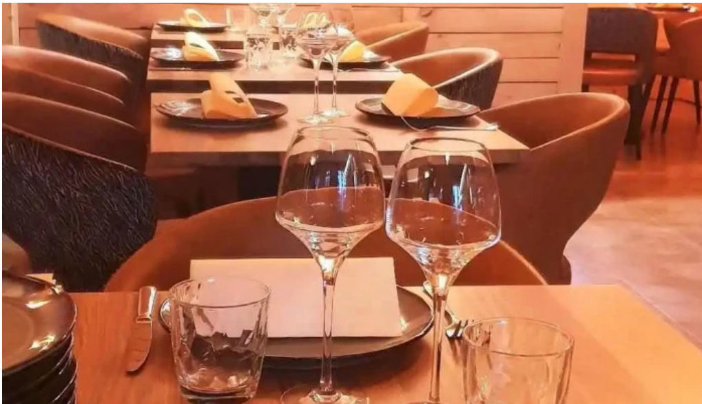
Um haeffchen beringen bewaertungene