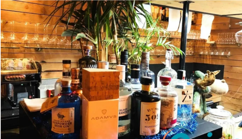
Um haeffchen beringen essen und trinken