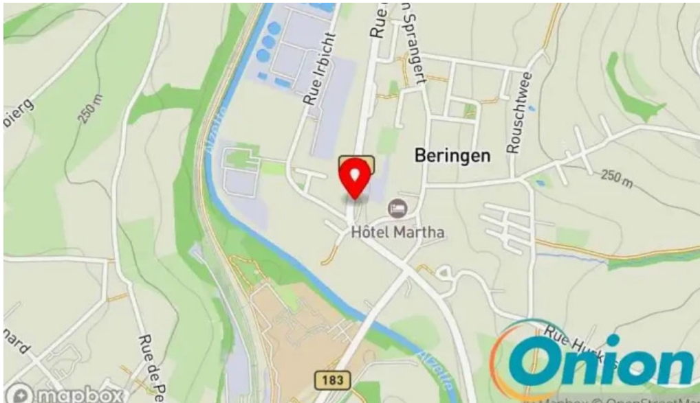
Um haeffchen beringen Kaart