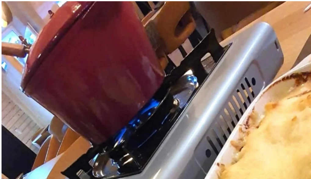
Um haeffchen beringen mersch