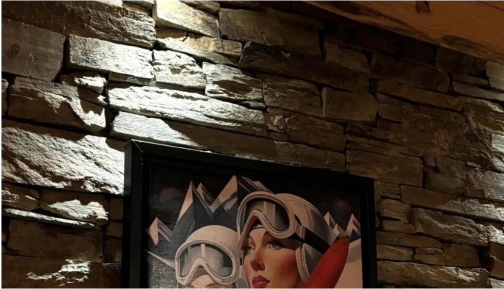
Um haeffchen beringen wou