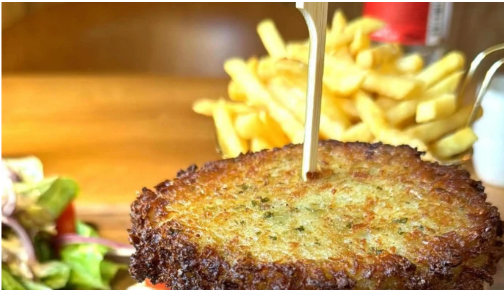
Um haeffchen beringen websait