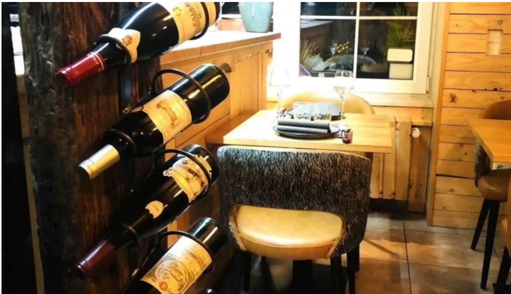
Um haeffchen beringen atmosphere