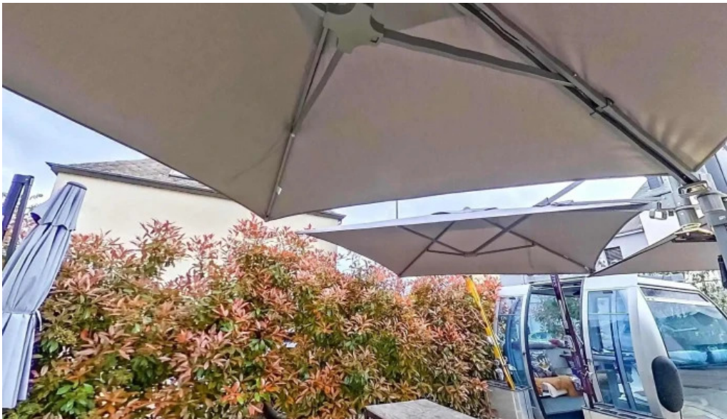
Um haeffchen beringen street view 360deg fotos