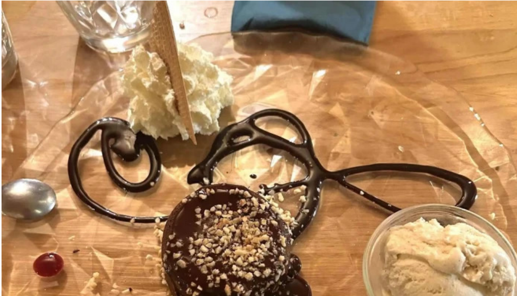
Um haeffchen beringen bewaertungen