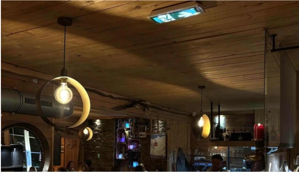
Um haeffchen beringen location