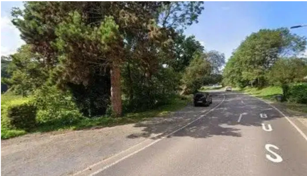
Auberge roudbaach street view 360deg fotos