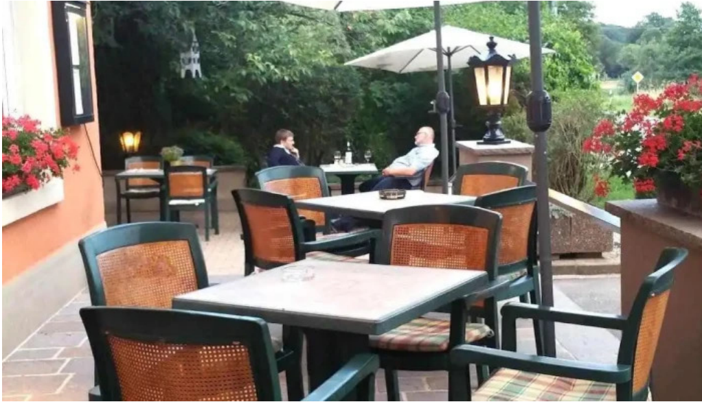
Auberge roudbaach atmosphere