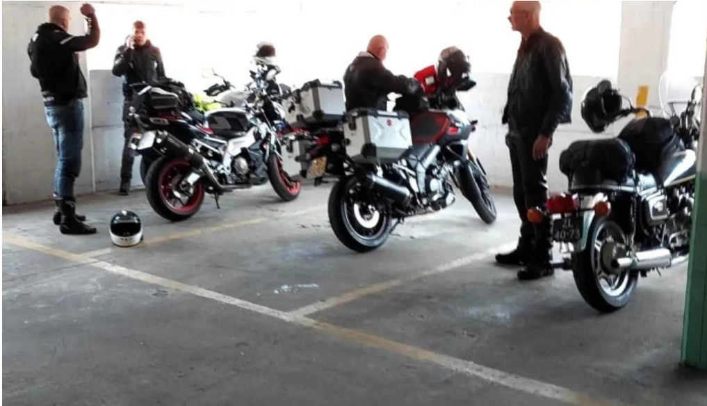
Auberge roudbaach stonnenplang

Auberge Roudbaach Restaurant L'Écrevisse