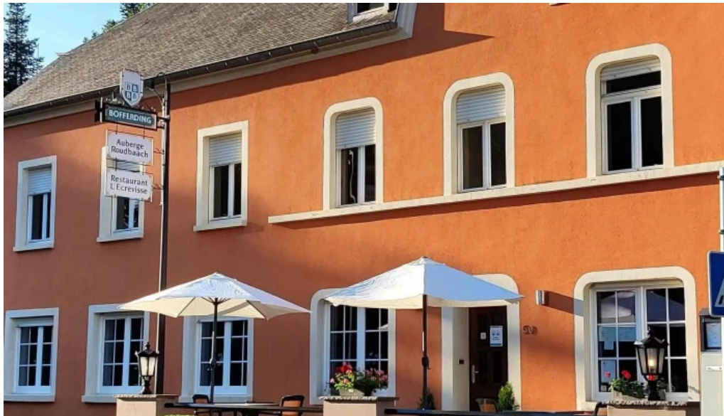
Auberge roudbaach websait