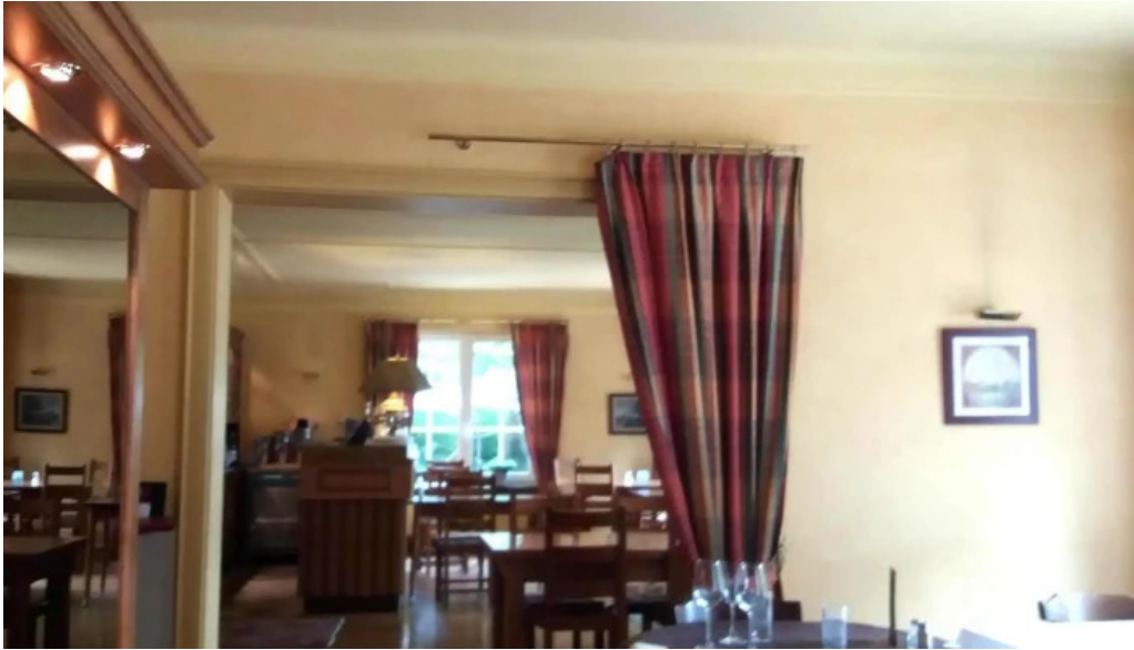
Auberge roudbaach preizerdaul