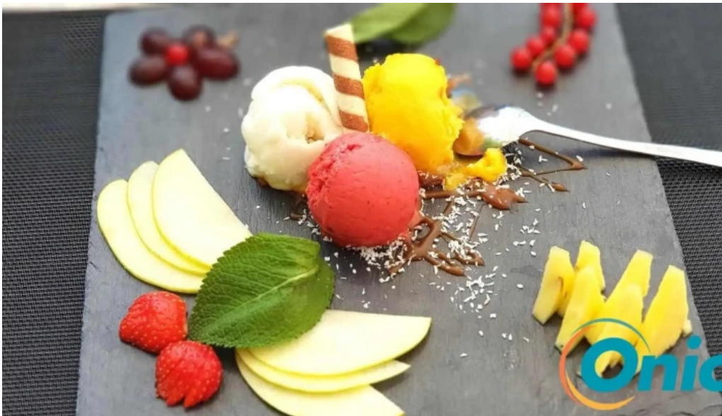
Auberge roudbaach essen und trinken