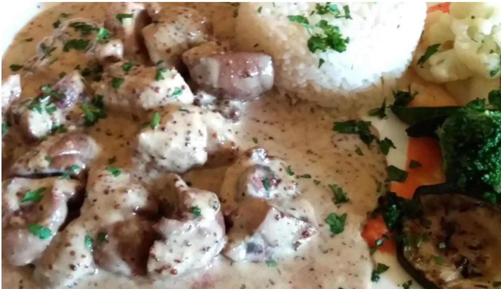
Auberge roudbaach adress