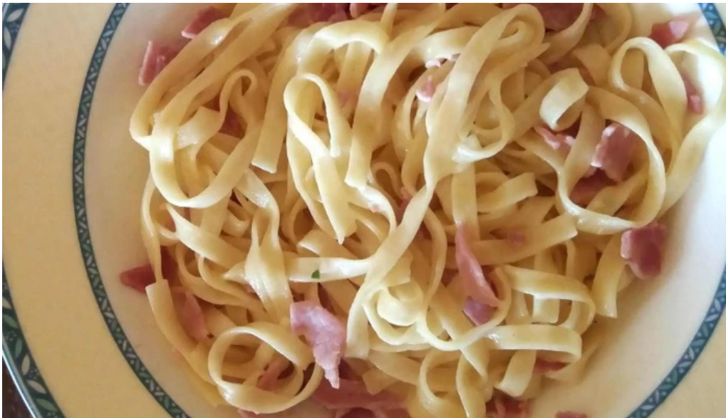
Auberge roudbaach praiser