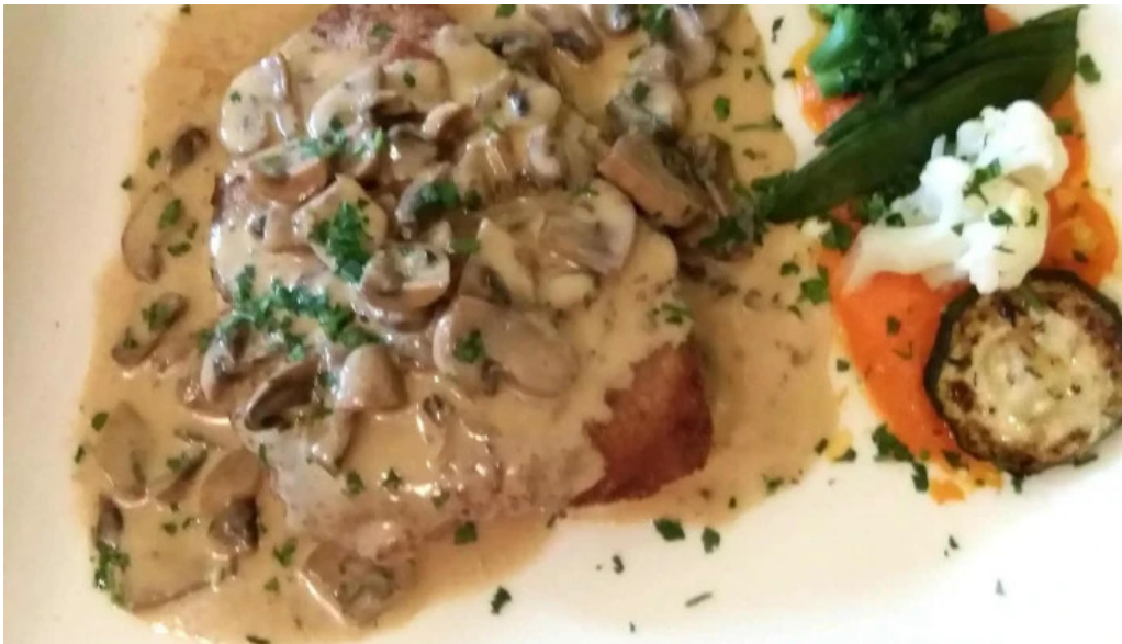
Auberge roudbaach elo op