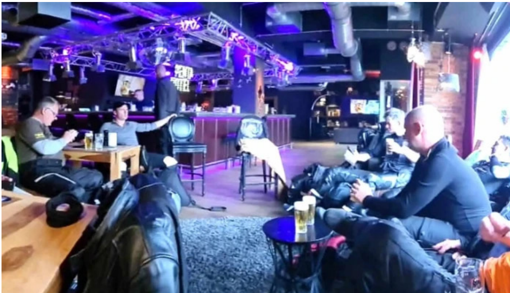
Auberge roudbaach bewaertung