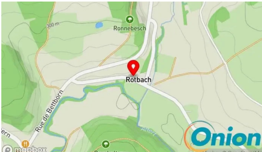
Auberge roudbaach Kaart