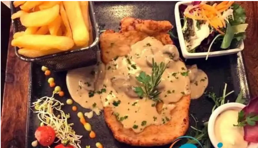
Bistrot relais postal pommes frites