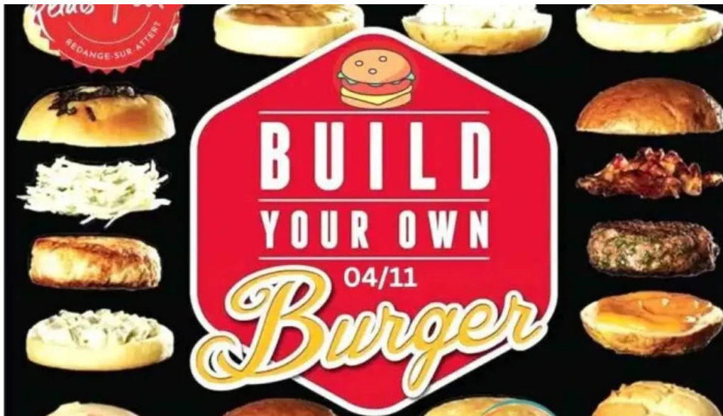
Bistrot relais postal videos