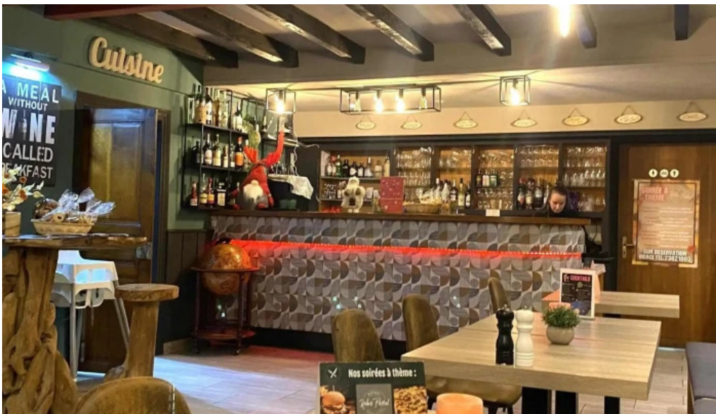
Bistrot relais postal nummer