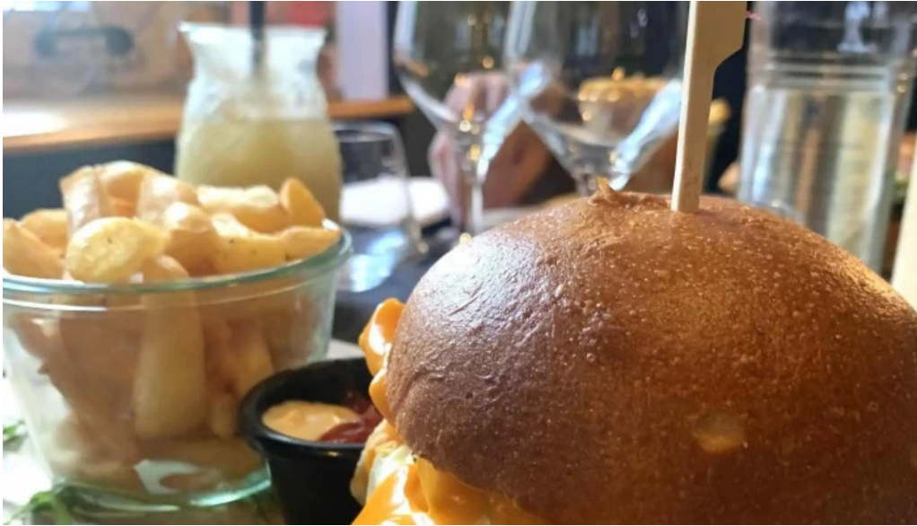
Bistrot relais postal kommentaren