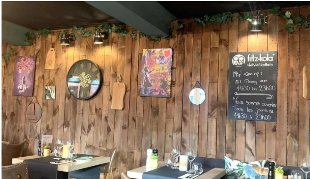
Bistrot relais postal praiser