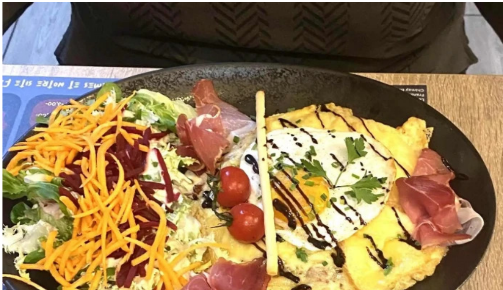
Bistrot relais postal bewaertungen