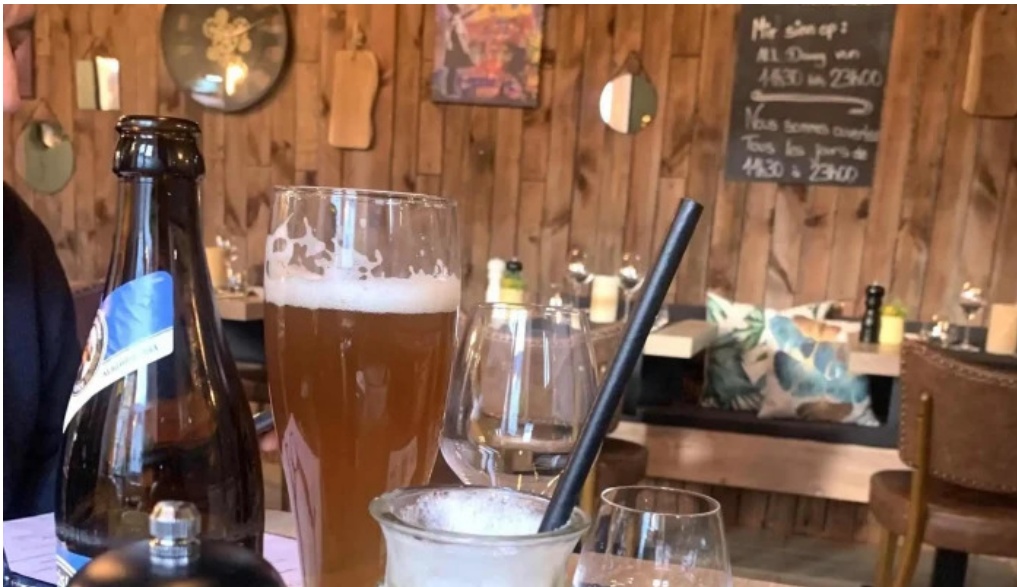
Bistrot relais postal stonnenplang