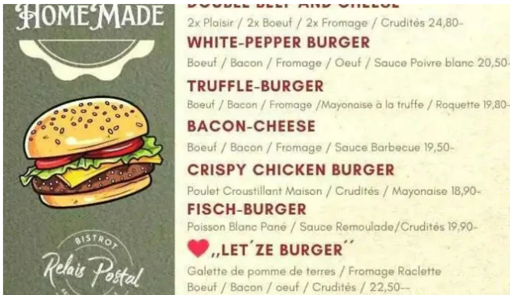
Bistrot relais postal speisekarte