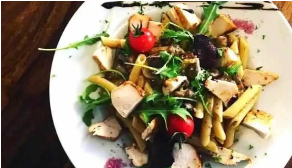
Bistrot relais postal essen und trinken