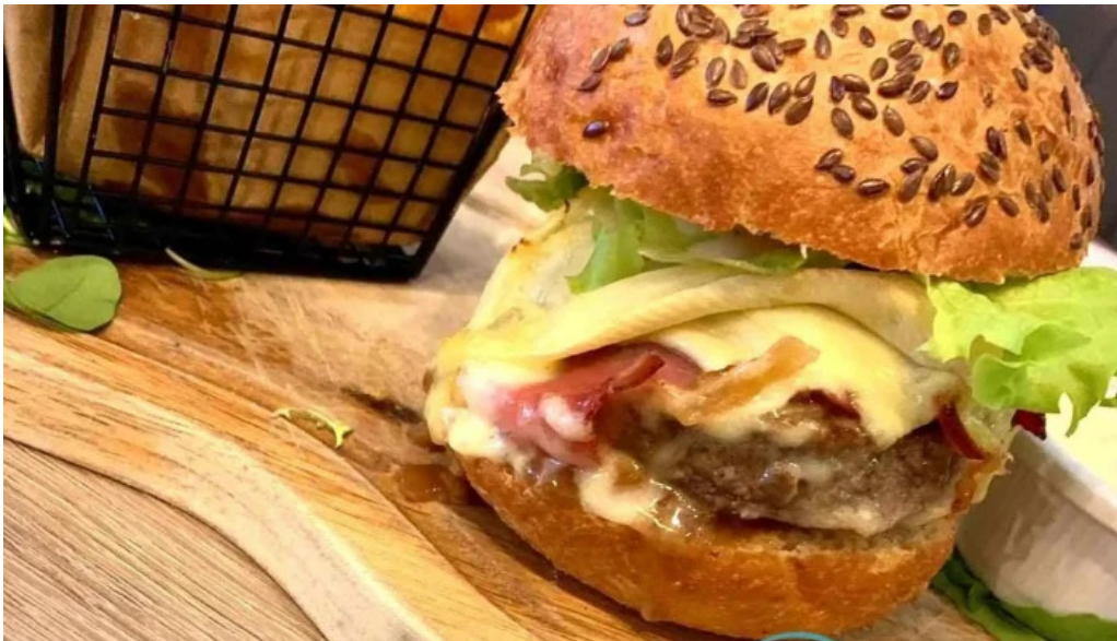
Bistrot relais postal hamburger