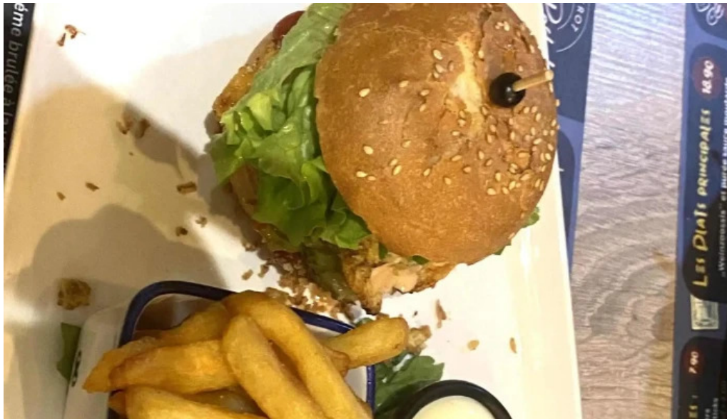
Bistrot relais postal redingen