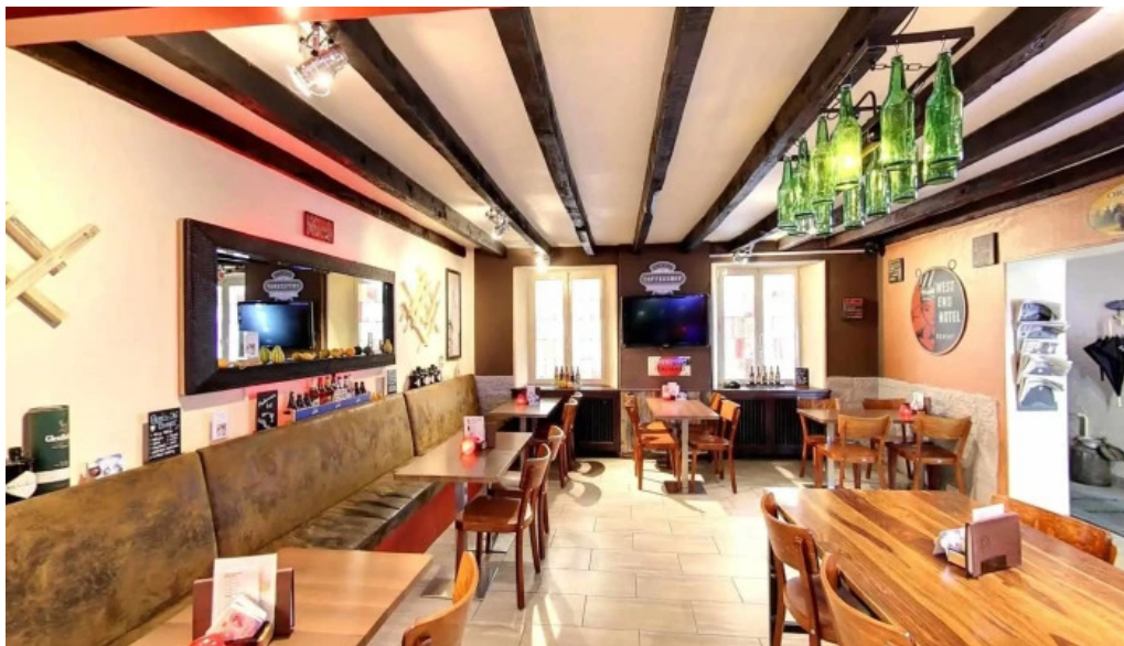
Bistrot relais postal street view 360deg fotos