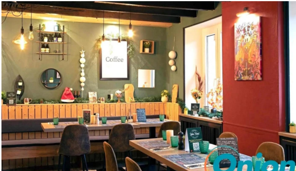
Bistrot relais postal atmosphere