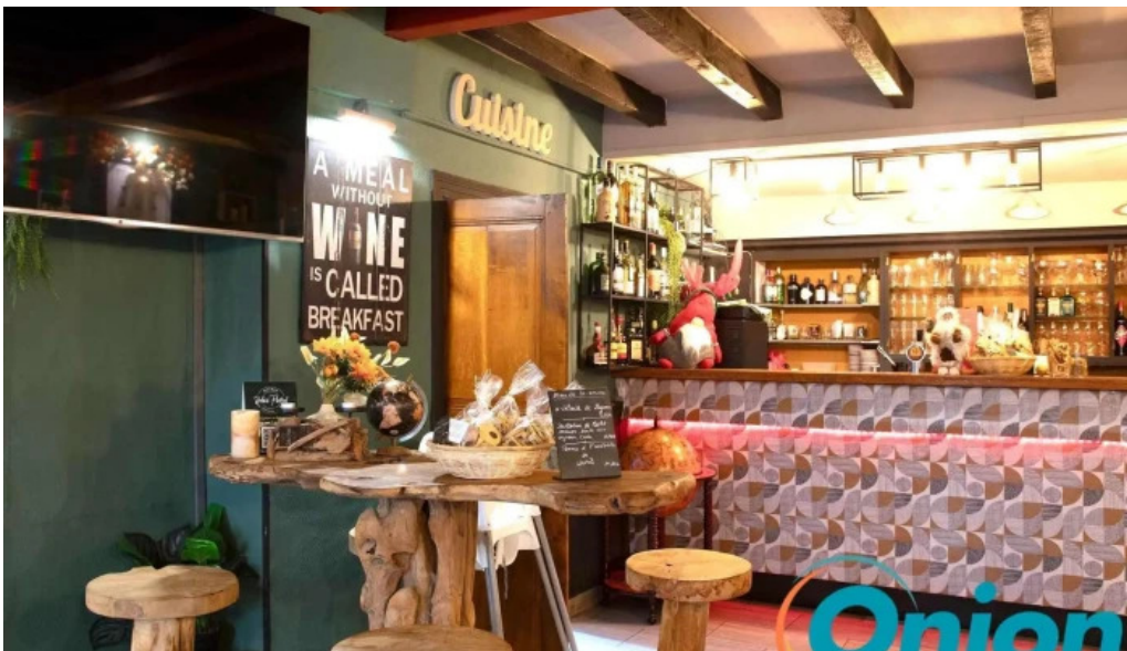
Bistrot relais postal bewaertungene