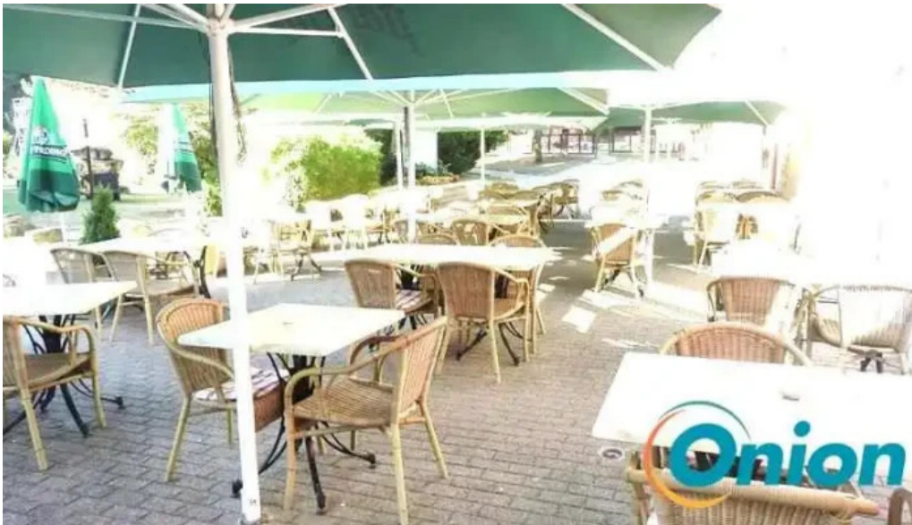
Brasserie du musee atmosphere