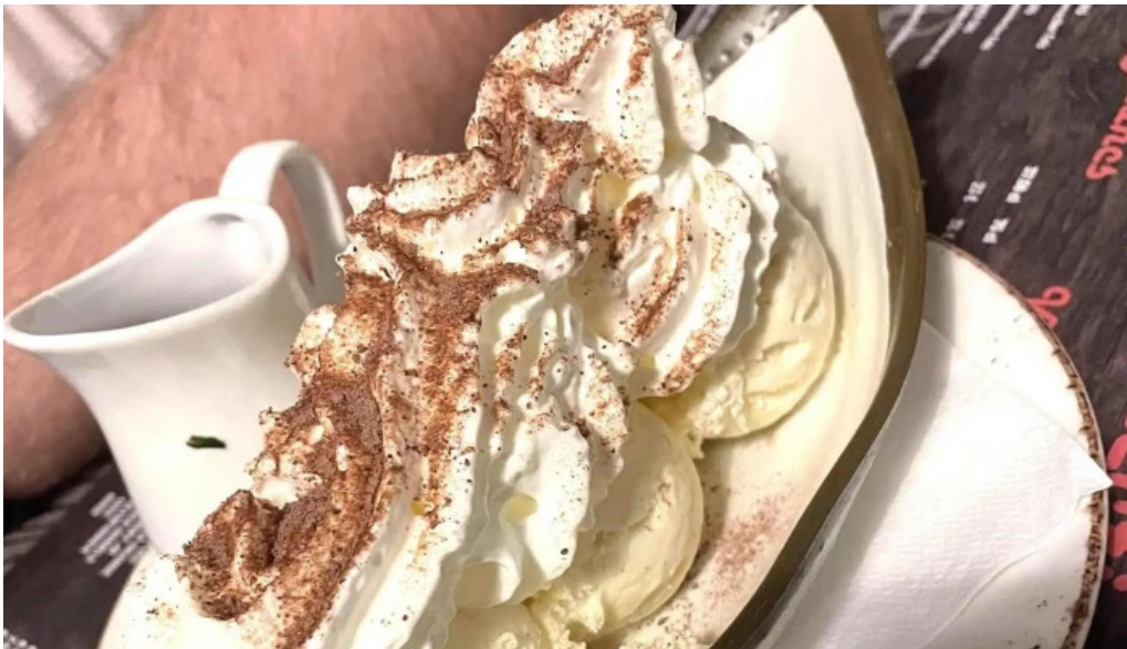
Brasserie du musee adress