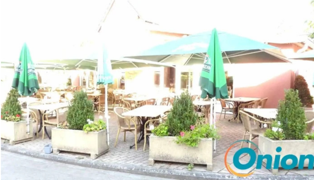
Brasserie du musee vom inhaber