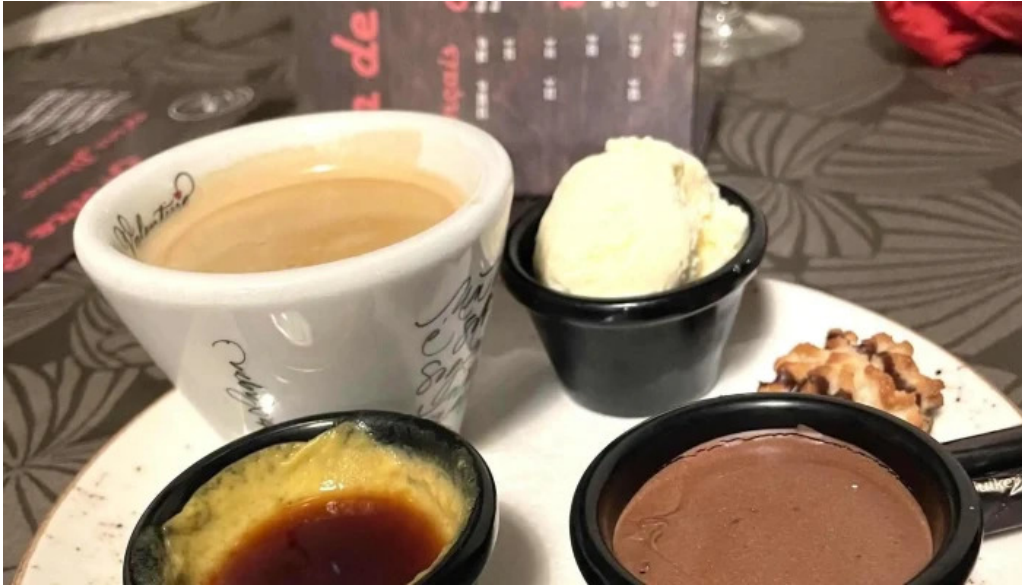
Brasserie du musee videoen