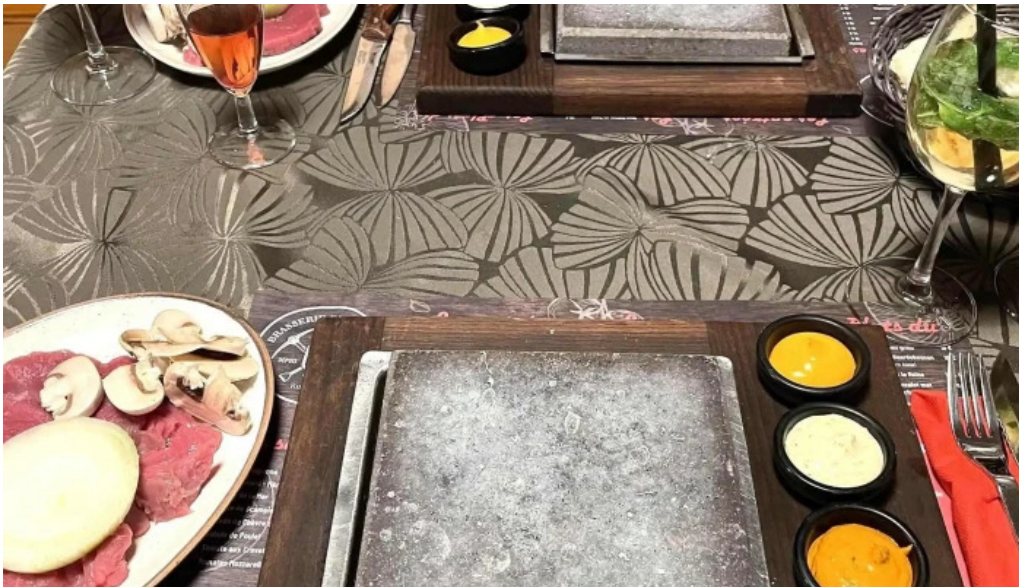
Brasserie du musee bewaertungen