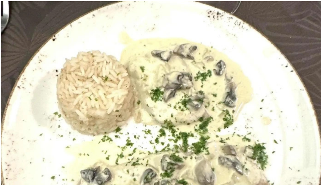
Brasserie du musee nummer