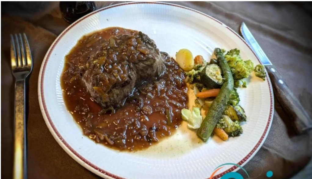
Brasserie du musee essen und trinken