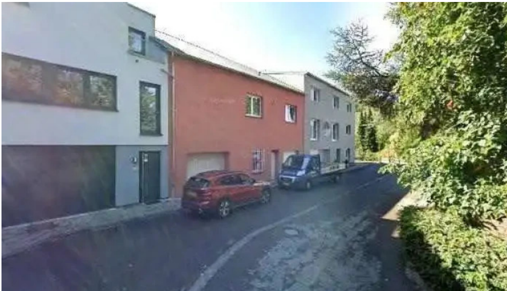
Brasserie du musee street view 360deg fotos