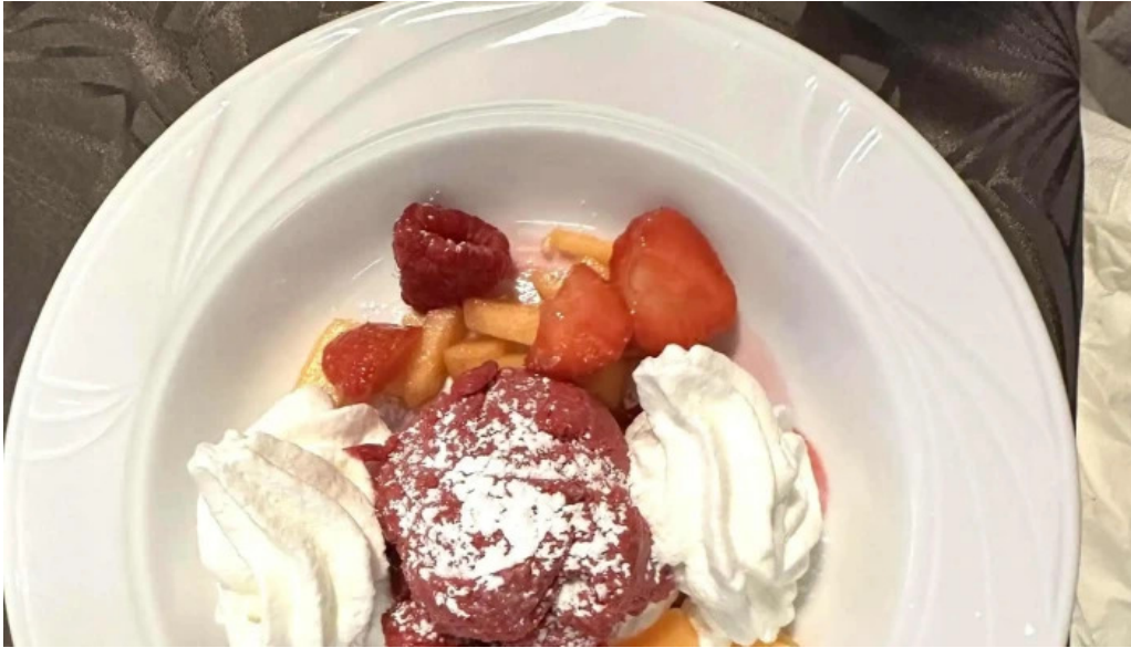
Brasserie du musee geigend