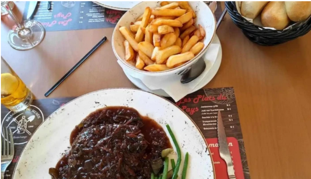
Brasserie du musee pommes frites