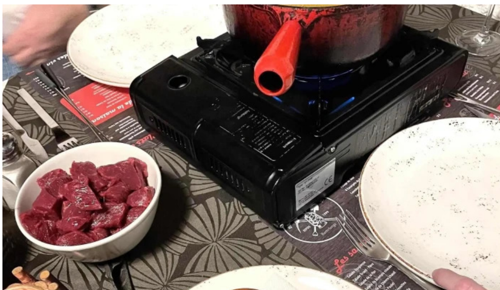
Brasserie du musee websait