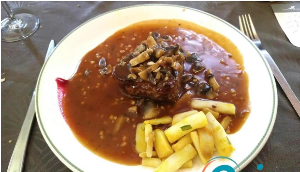
Brasserie du musee pilzsosse