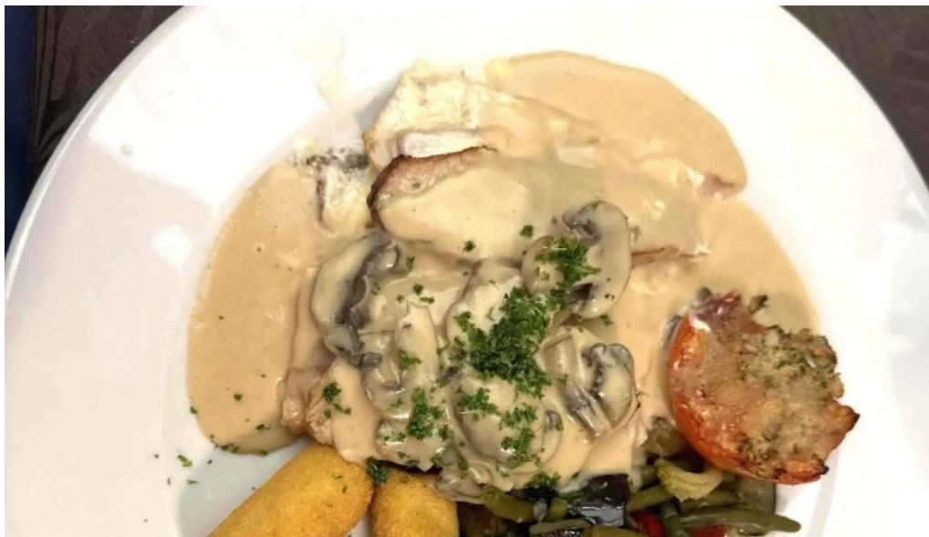
Brasserie du musee rumelingen