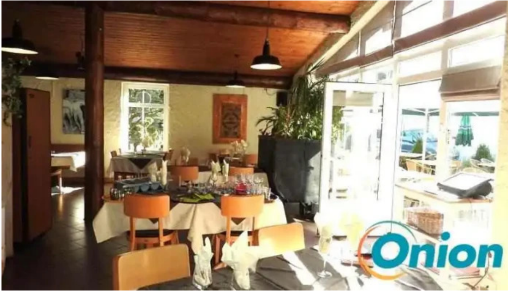
Brasserie du musee nummere