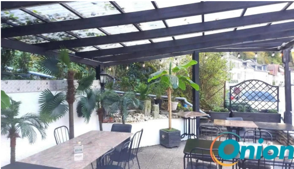
Madame marianne atmosphere