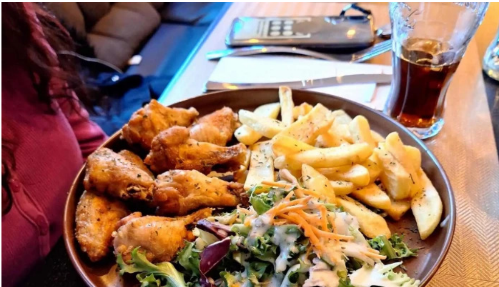
Madame marianne nummer