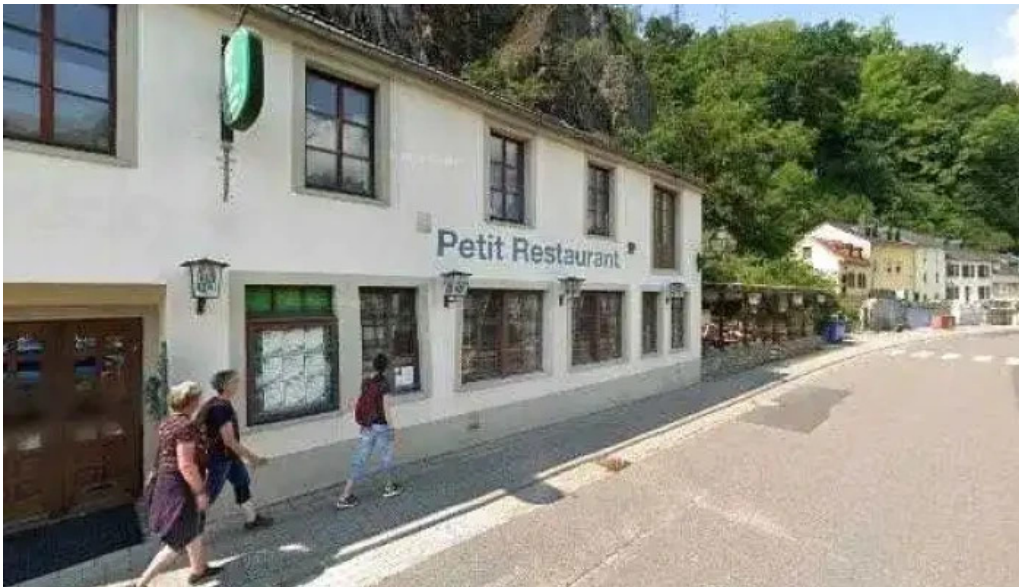
Madame marianne street view 360deg fotos