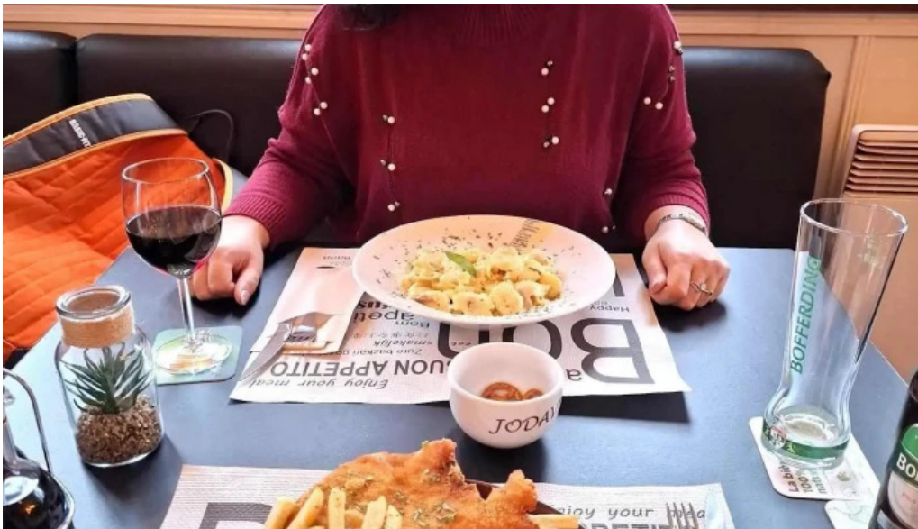
Madame marianne pommes frites