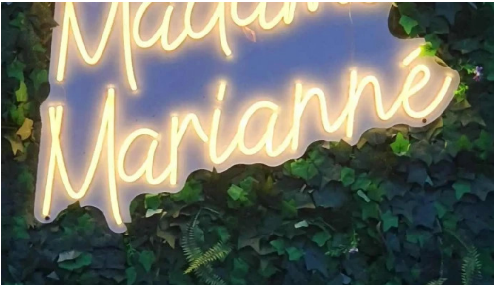
Madame marianne vom inhaber