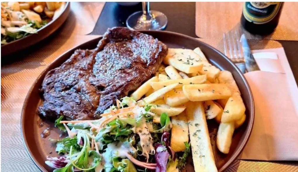
Madame marianne essen und trinken