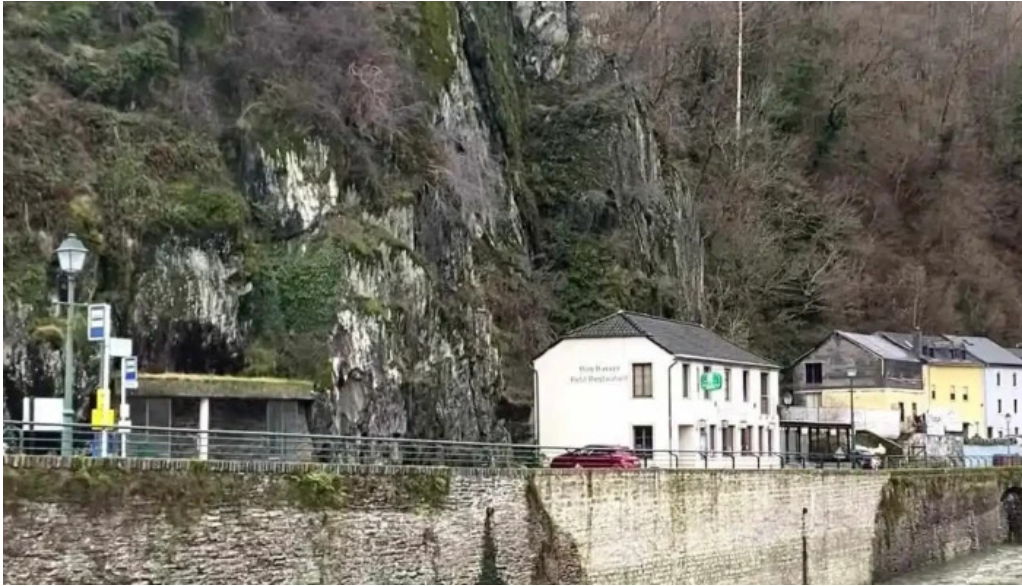
Madame marianne videos