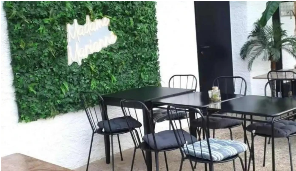
Madame marianne videoene