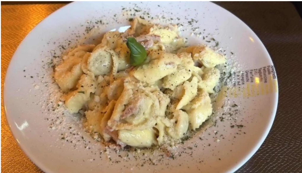
Madame marianne neueste