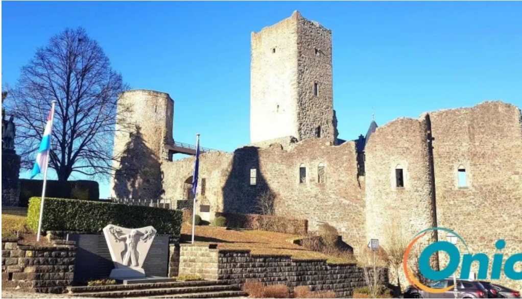
Burg useldingen natursteinmauerwerk