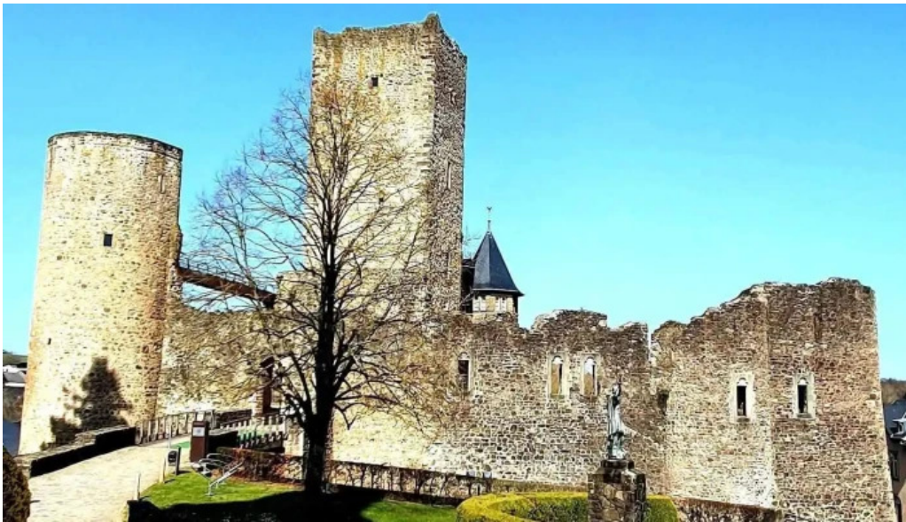
Burg useldingen telefone