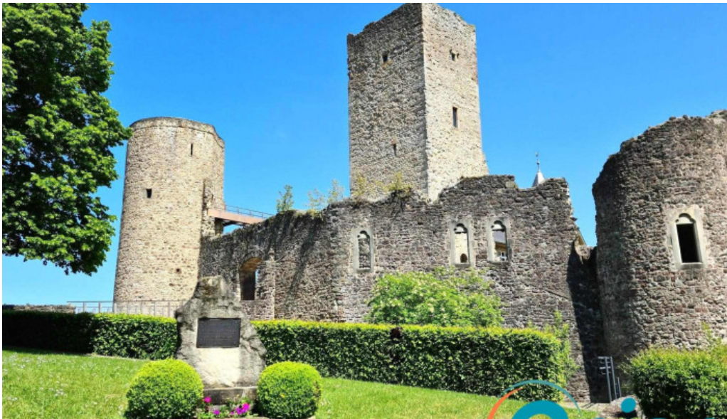
Burg useldingen garten