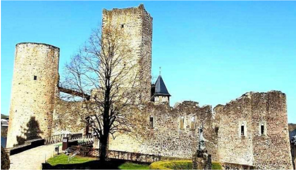
Burg useldingen useldingen