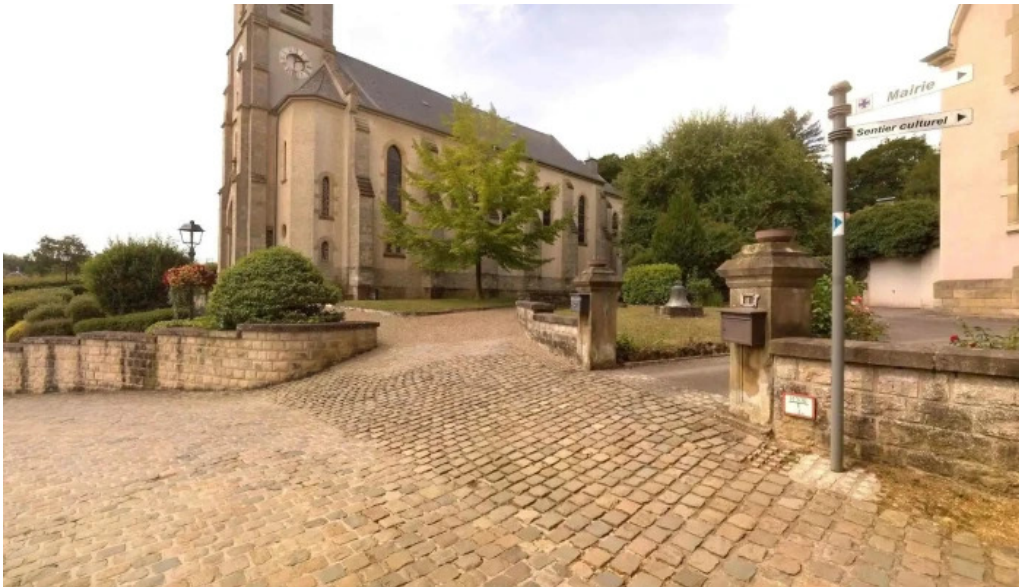
Burg useldingen street view 360deg fotos