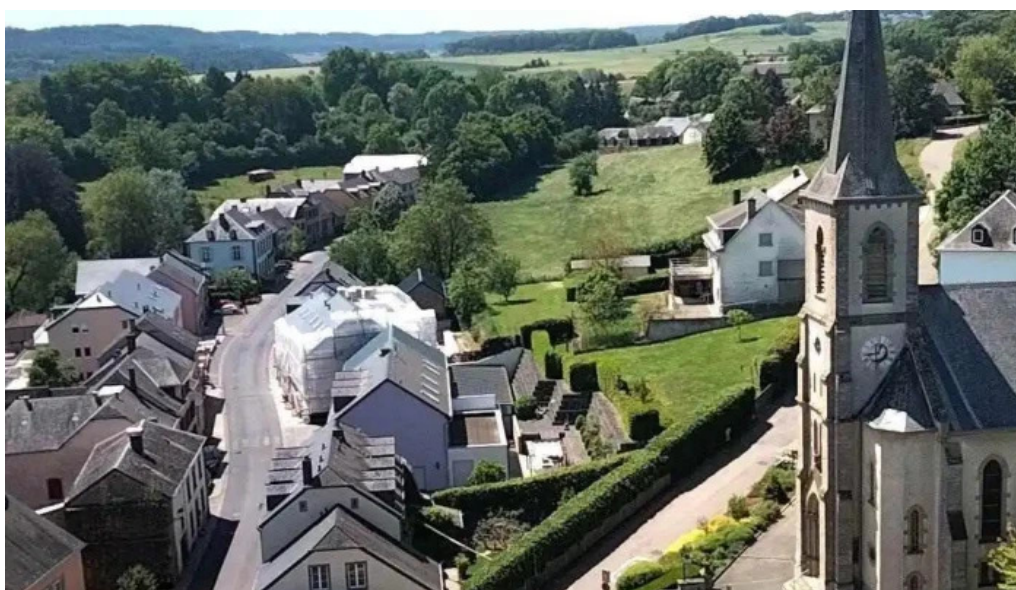
Burg useldingen videos