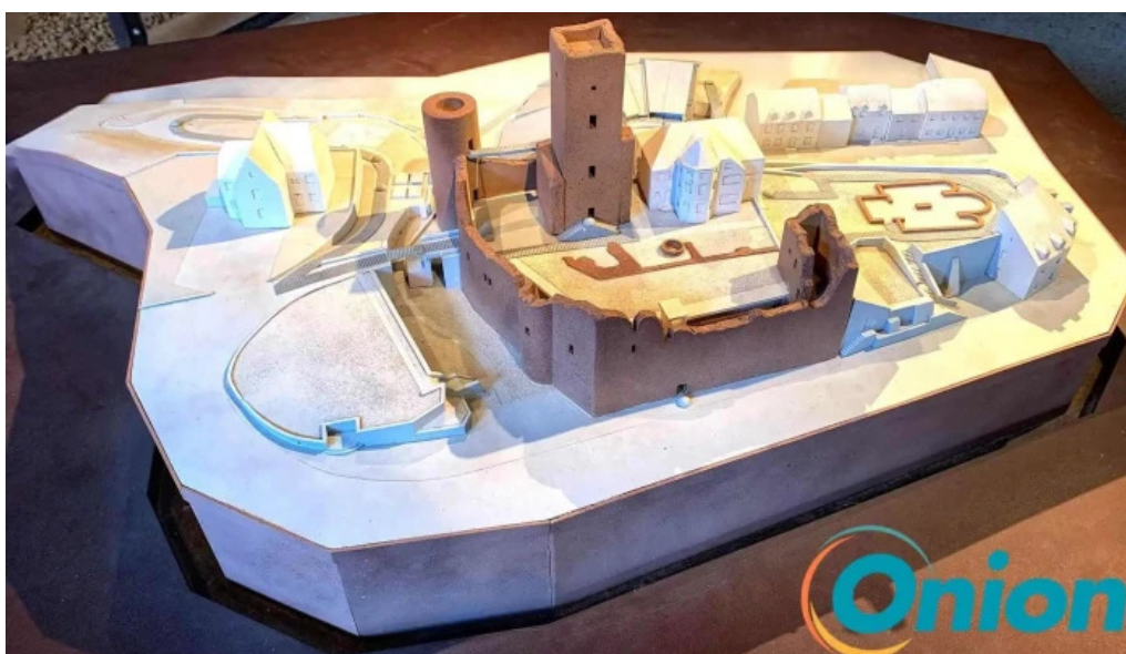
Burg useldingen vom inhaber