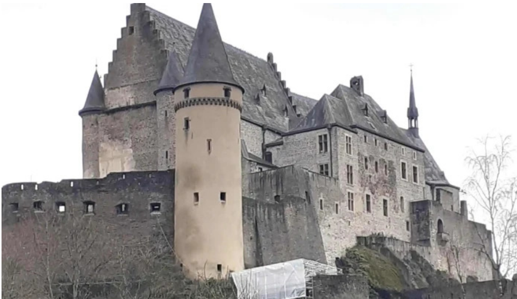
Burg vianden promotioun