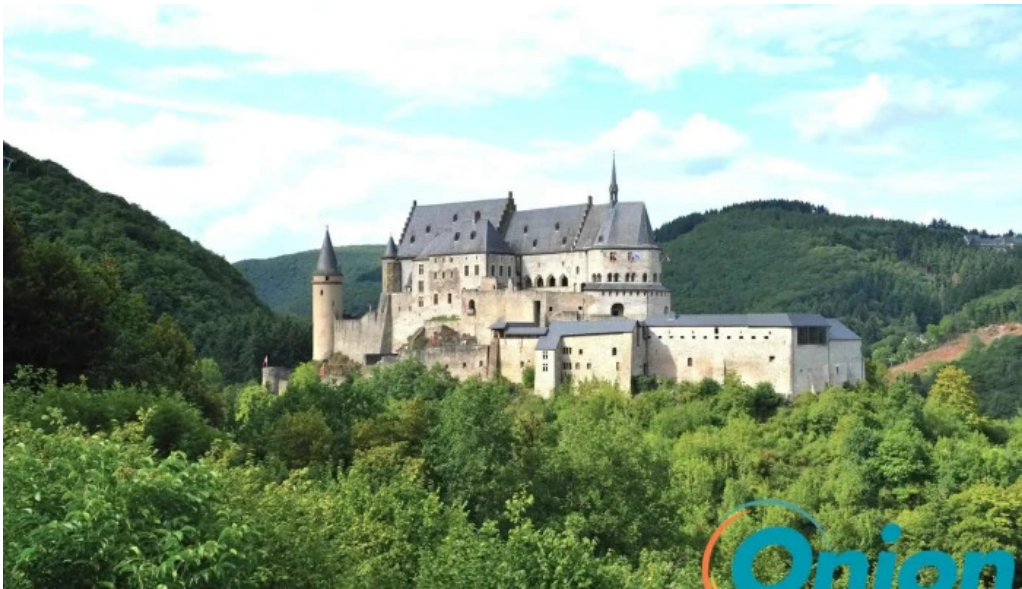
Burg vianden vom inhaber