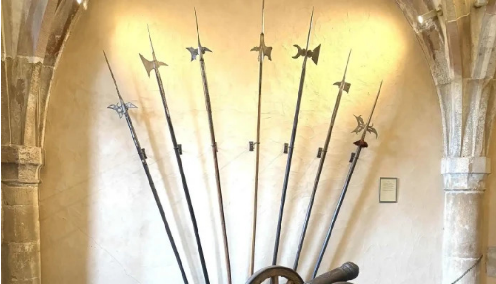
Burg vianden vianden