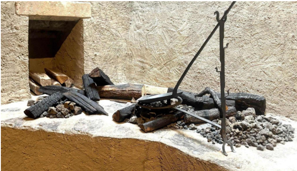
Burg vianden bewaertung