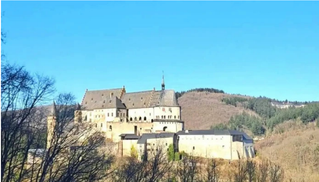
Burg vianden neueste