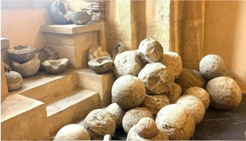
Burg vianden wou