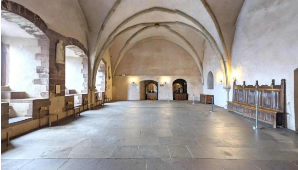
Burg vianden street view 360deg fotos