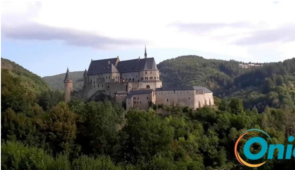
Burg vianden videos