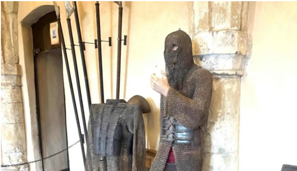
Burg vianden videoen