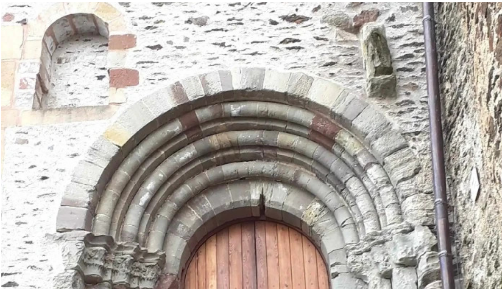
Burg vianden telefon