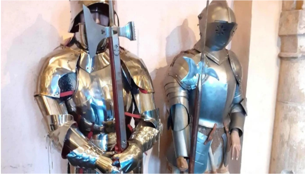
Burg vianden praiser