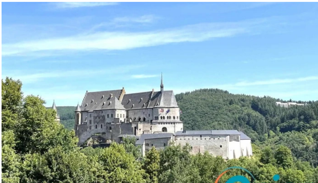
Burg vianden woue