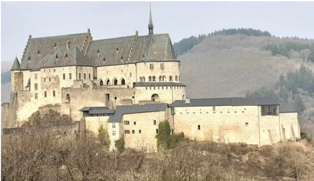
Burg vianden no bei mir