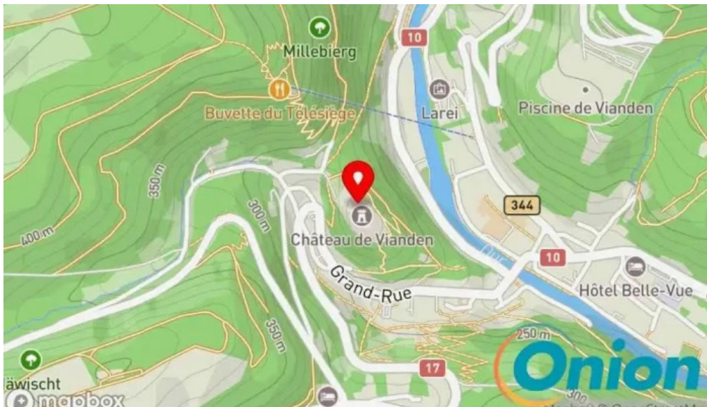
Burg vianden Kaart