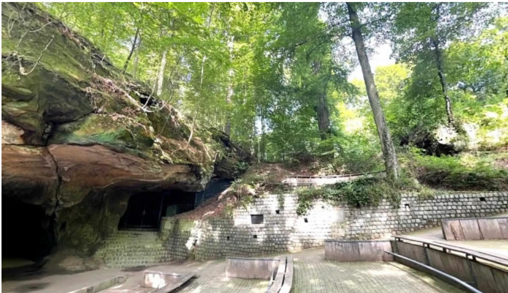
Amphitheater breechkaul street view 360deg fotos