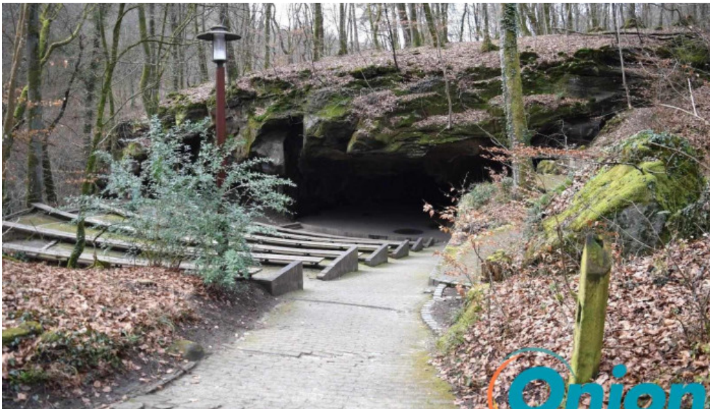
Amphitheater breechkaul berdorf