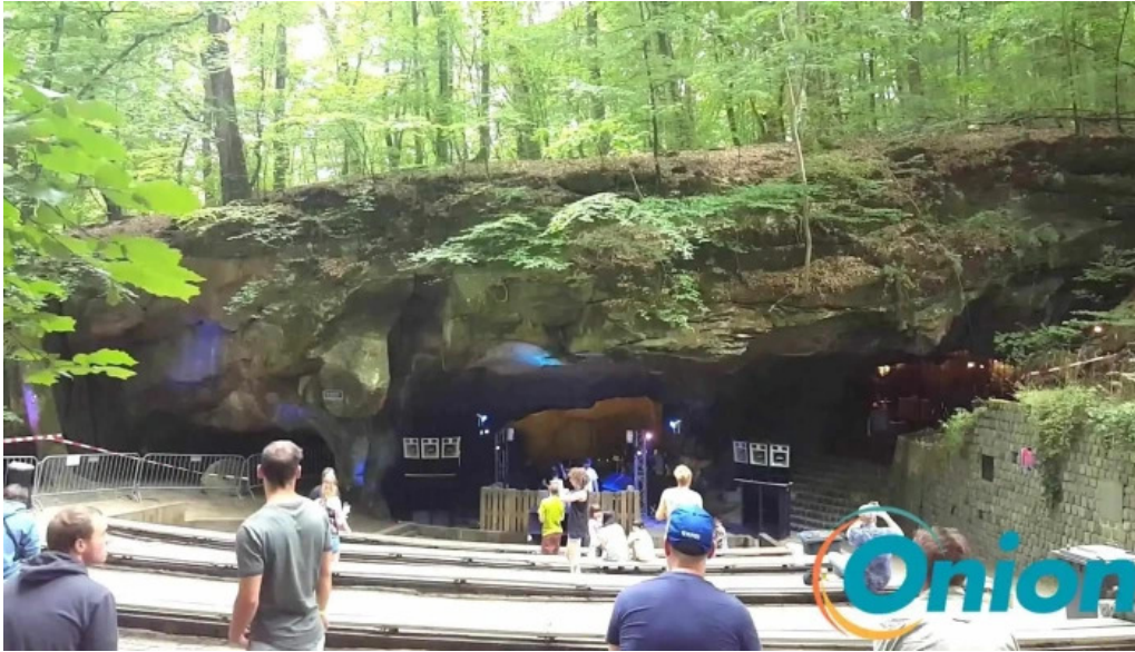
Amphitheater breechkaul videos