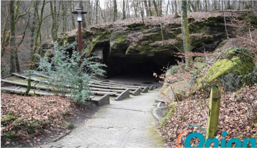
Amphitheater breechkaul kommentarene